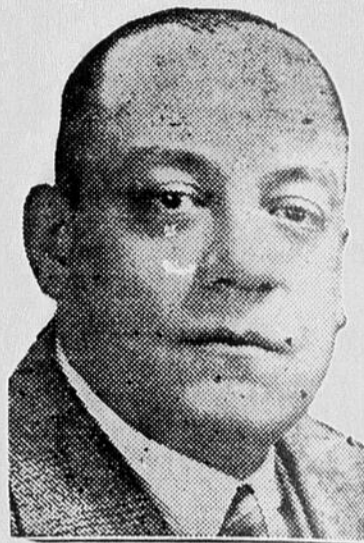
Camillien Houde, ancien maire de Montréal, qui sera relâché d'un camp d'internement d'ici quelques jours suivant un rapport. Houde est interné depuis quatre ans.

sont nullement enchantés de la décision des directeurs de l'équipe et même plusieurs joueurs.