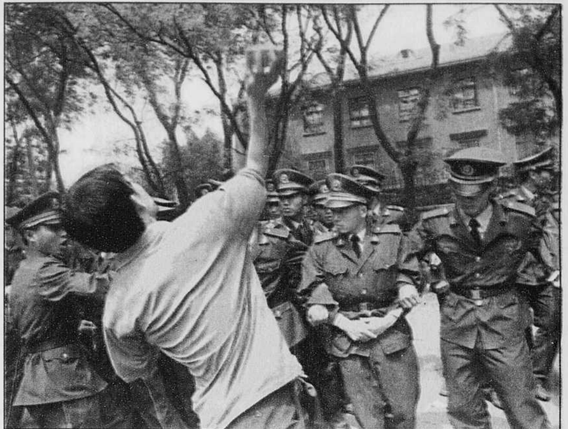
Un homme lance une pierre en direction de l'ambassade américaine de Pékin. La scène a été captée hier, lors d'une manifestation pour protester contre le bombardement de l'ambassade chinoise à Belgrade.

Belgrade n'a pas été bombardée durant la nuit de samedi à dimanche, mais le porte-parole de l'OTAN Jamie Shea a noté que cela n'était pas significatif. Il n'y a «absolument aucune réduction dans l'intensité» des frappes et «aucune installation représentant une valeur militaire ne constituera un sanctuaire», a-t-il dit.