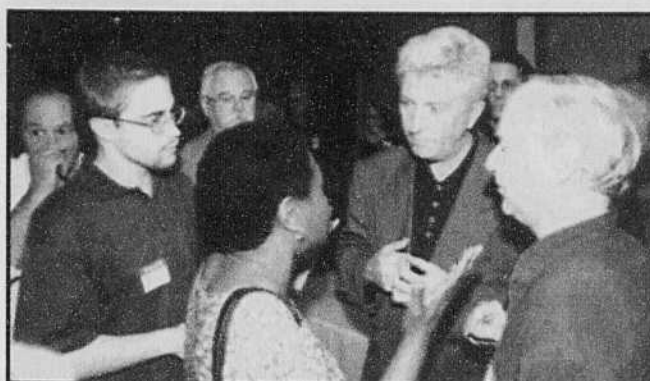
Le chef du Bloc québécois, Gilles Duceppe, a profité de son passage dans la région de Drummond pour échanger avec ses partisans.

«Les documents de travail qui nous ont été soumis, a-t-