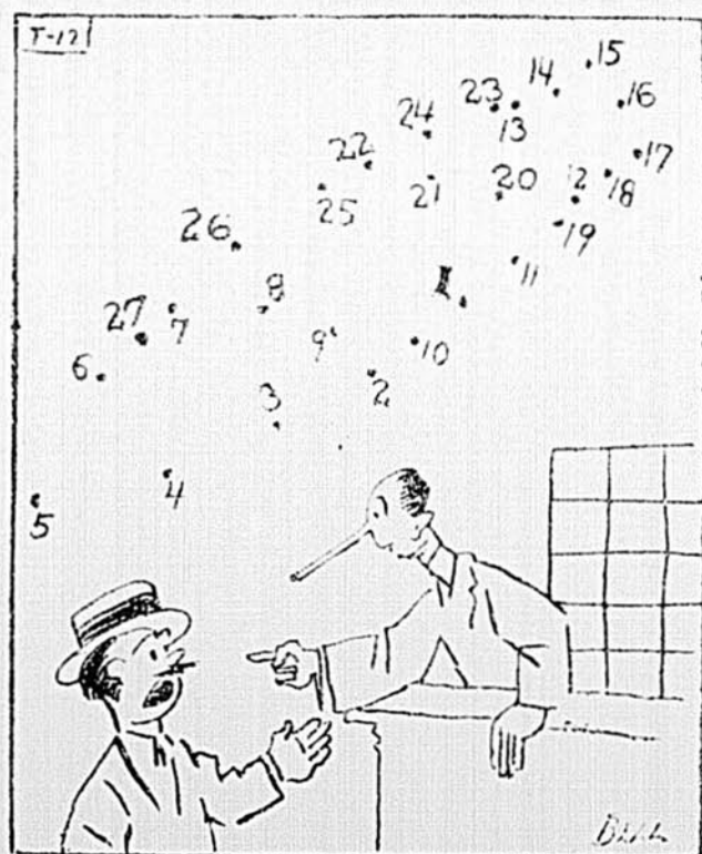
"Si vous êtes pour passer la soirée ici, vous devrez suivre les règlements. Sinon, dehors! Allez à la tour avant d'entrer." En parlant ainsi, le commis faisait allusion à son..... (Pour compléter ce dessin, tracez des lignes droites, dans l'ordre numérique.)