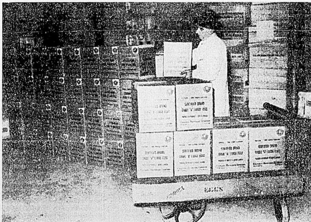
Première d'une série d'expéditions d'œufs strictement frais du Québec sur le marché de Londres, faite avec le concours et l'appui financier du Ministère de l'Agriculture de la province de Québec. Similaires expéditions seront faites toutes les semaines durant janvier et février. Si l'essai réussit on verra à développer davantage ce commerce dans l'intérêt des cultivateurs. Chaque boîte porte l'inscription: "Province de Québec, Canada."