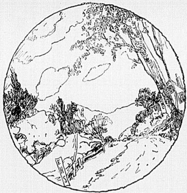
Voyez-vous un voyageur quelque part?

La Coopérative de Rimouski mérite une mention spéciale pour le grand succès qu'elle a remporté en 1937, avec les opérations de son poste d'incubation. L'incubateur a reçu 44,749 œufs en 1937 provenant de pondeuses de races pures sélectionnées et passées à l'épreuve du sang. L'éclosion donna 29,391 poussins, soit un rendement de 65 p.c. Il est intéressant de noter que le pourcentage moyen d'éclosion pour tous les couvoirs de la province fut de 63. Les poussins furent vendus en grande partie dans la région chez les membres des cercles avicoles de Matane et de Rimouski, et 5,000 à des cultivateurs du Nouveau-Brunswick. Les directeurs de la Coopérative comptent sur une saison prospère en 1938. Le couvoir sera alimenté par les œufs de 2,300 poules certifiées, qui seront accouplées avec 172 coqs R.O.P., et approuvés par le ministère fédéral de l'Agriculture. En plus, deux troupeaux, au total de 500 poules R.O.P., fourniront des sujets d'élite de haute qualité.