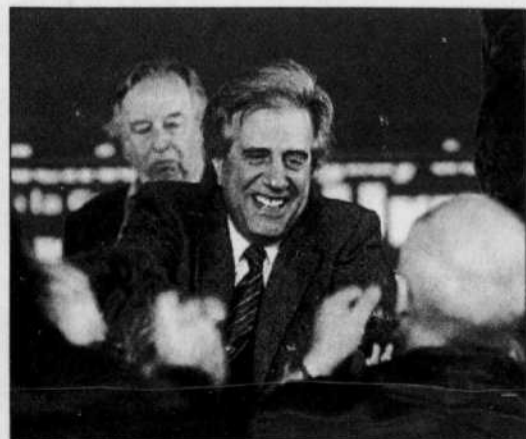
Le socialiste Tabaré Vazquez.