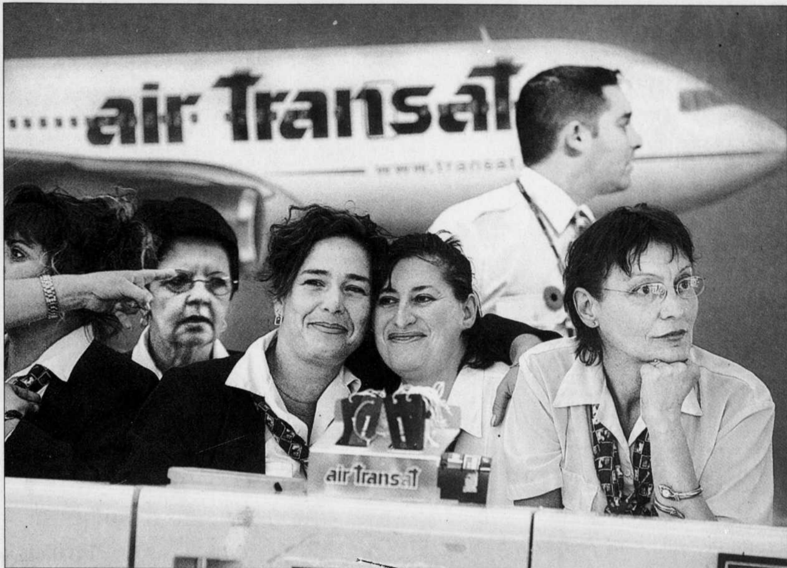
Des employés d'Air Transat lors de leur dernière journée de travail, hier, à Mirabel. À 20h55, elles sont descendues sur la piste de décollage pour saluer l'ultime vol de passagers, le TS-710, à destination de Paris.