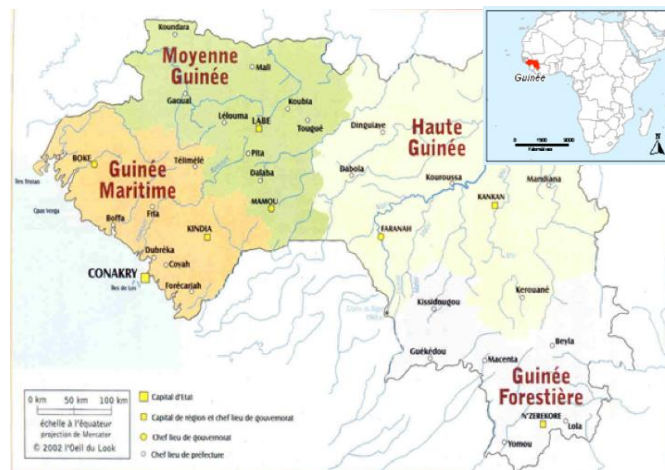
Figure 1 : Carte de localisation de la Guinée maritime, République de Guinée, Afrique de l'Ouest

La Guinée maritime est la région naturelle de Guinée qui concentre les zones côtières. Selon une étude de la Société minière Rio Tinto (2012, p.94), «son écosystème côtier inclut 305 km 2 d'estrans intertidaux, 2 036 Km 2 de mangroves, 755 km 2 de marais côtiers d'eau douce ou d'eau saumâtre et 605 km 2 de rizières inondées». Le secteur de la pêche y est l'un des moteurs du développement économique national. Il contribue également à la sécurité alimentaire. Il procure plus de 12 000 emplois directs et 100 000 emplois indirects et assure des recettes à l'état à travers les redevances et les amendes de pêche (Enda diapol/WWF, 2007).