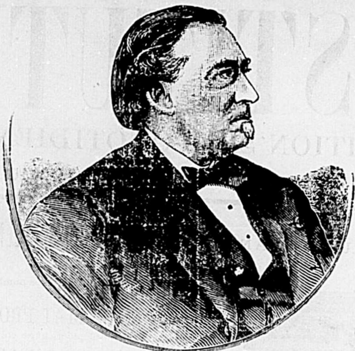
Hector L. Langevin, Ministre des Travaux Publics

Le 30 mars 1864, il était fait conseil de la reine. Sir Hector n'était