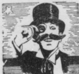
— PAR — L'ACADEMICIEN