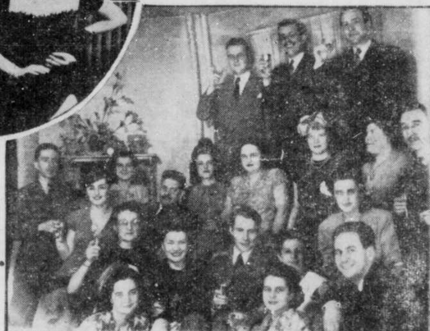
Le groupe des invités à la réception chez Tamara.