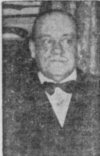
Son Honneur CAMILLIEN HOUDE, maire de Montréal.

DANS LES SALONS DE L'HOTEL WINDSOR, SAMEDI LE 12 AVRIL — COURONNEMENT DE MISS RADIO — DISTRIBUTION DES TROPHÉES.