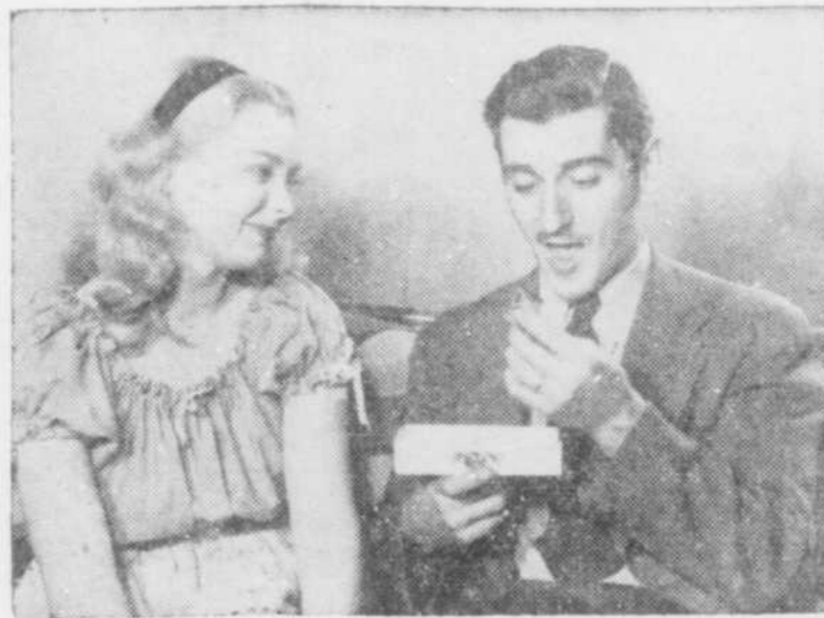
C'est Pâques, et MARGUERITE et ZEPHIRIN peuvent à nouveau se permettre les petites sucreries, dans cette scène de "Madeleine et Pierre", dont les trois dernières représentations seront données en reprise les 5, 6 et 7 avril, au Monument National.