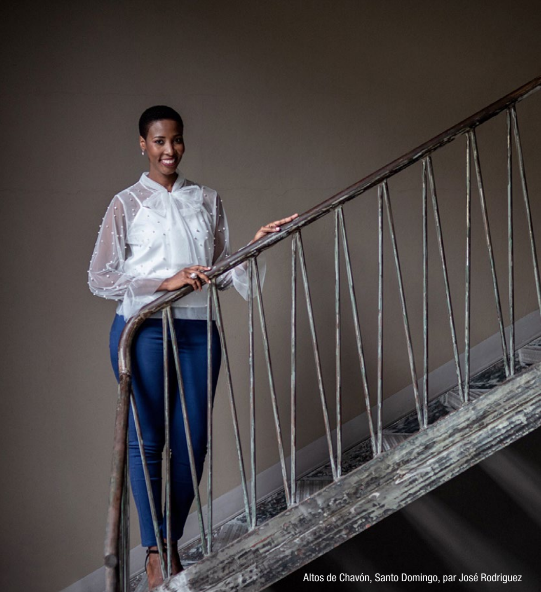
Altos de Chavón, Santo Domingo, par José Rodríguez

À toute personne qui est en processus de recherche d'une image intégrale qui soit son compagnon d'évolution, vous pouvez me contacter, cela me fera plaisir de vous assister.