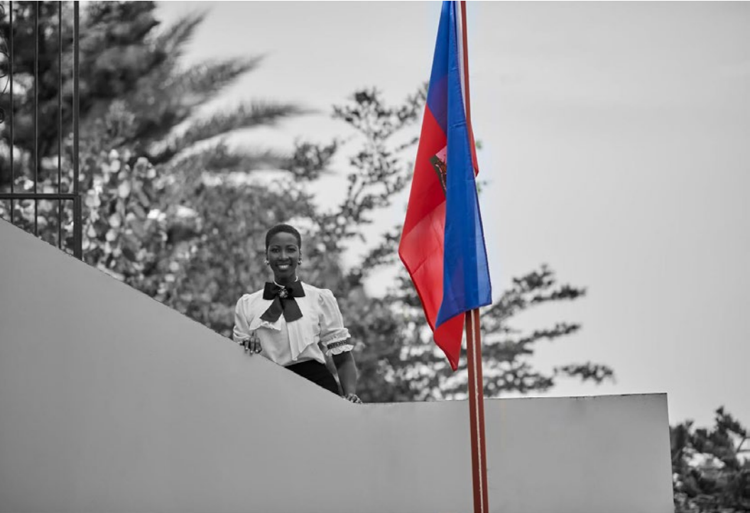
Photo à mon école l'Externat Saint-François-Xavier, Cap-Haïtien, par Jean-Joseph Napoléon.

Nous voici à la fin de mon partage des 7 secrets de Rhodie . Je termine en rappelant que ces techniques d'apprentissage que je partage avec vous sont les fruits de mes expériences vécues dans différents pays d'Amérique, comme le Canada, les États-Unis, la République dominicaine et Haïti, mon pays d'origine.