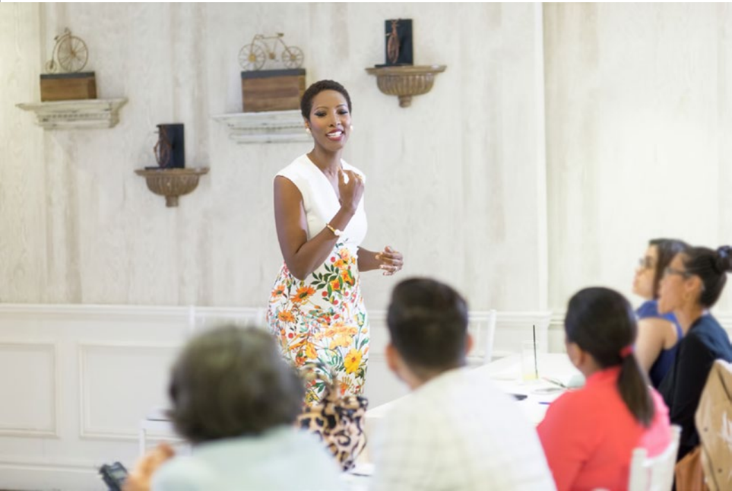
Causerie, Santo Domingo.

notre habillement. Par réflexe, bon nombre d'entre nous – pas tout le monde bien entendu – ont tendance à se diriger vers les tons neutres quand ça ne va pas bien, ou encore vers des morceaux qui nous avantagent moins. Si notre garde-robe reste bien équipée de ce qui nous va bien, cela nous sécurise lors des journées difficiles et nous aide à entretenir une communication plus positive envers nous et avec les autres. J'applique ce principe à ma garde-robe depuis près de dix ans. Cette intelligence vestimentaire est ce qui laisse croire que je suis toujours élégante.