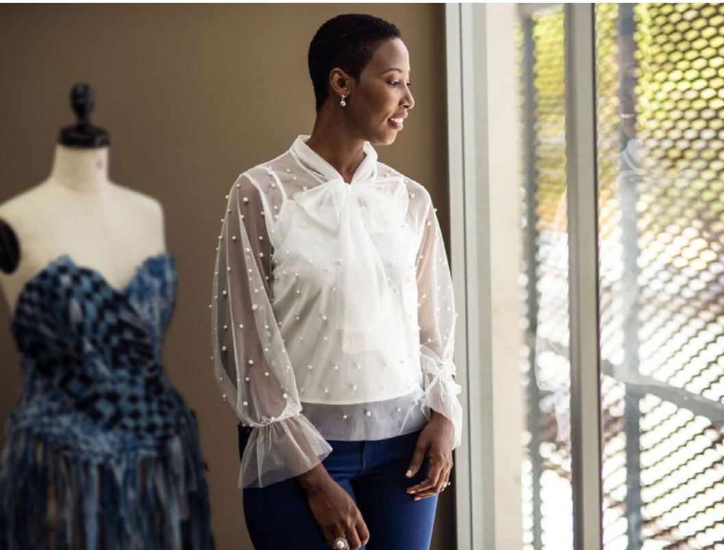
Altos de Chavón, Santo Domingo, par José Rodríguez.

d'elles positivement. Ce sont des vertus appréciables tant dans le milieu professionnel que personnel. Ceci veut aussi dire de se retenir de colporter des commérages et d'émettre de mauvais commentaires. L'autre bonne nouvelle c'est qu'en étant bon envers les autres, à vouloir le bien d'autrui, nous avons tout à gagner, car nous mettons notre esprit en mode de positivité. En désirant le bien pour les autres, nous nous illuminons nous-mêmes, car c'est un acte altruiste. Notre comportement avec les autres sera transformé. Même notre miroir nous sourira davantage!