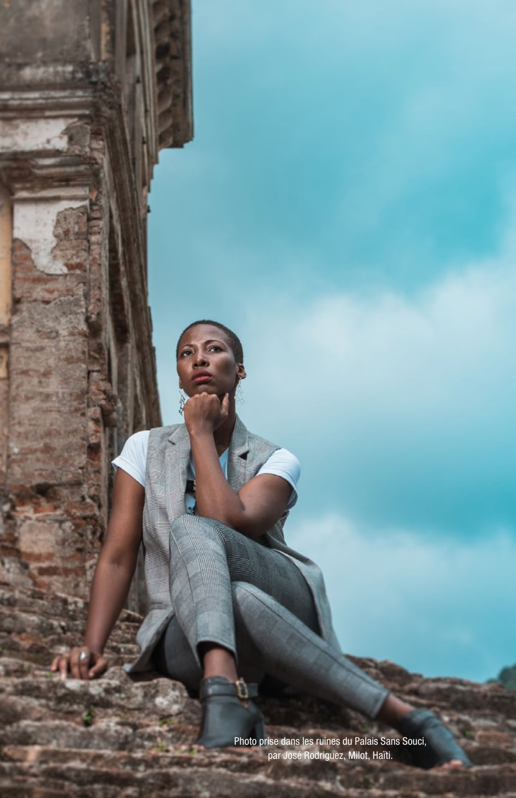
Photo prise dans les ruines du Palais Sans Souci, par José Rodriguez, Milot, Haïti.