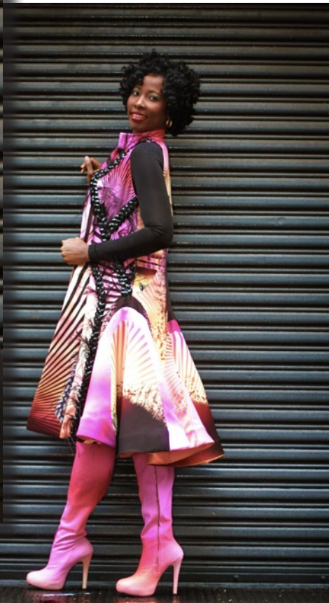
Les couleurs vives contrastent avec le noir favorablement.