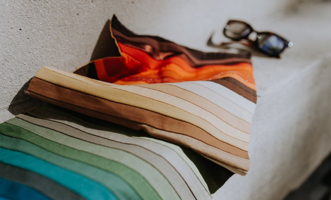
Palette de couleurs d'automne, par Camille Tellier, Montréal.

Sans que je vous en prévienne, je viens d'essayer de vous faire vivre une expérience colorée. La même chose se produit avec les belles couleurs qui nous vont à merveille, qui s'agencent avec notre teint, avec la couleur de nos cheveux et de nos yeux. Elles laissent des images qui s'imprègnent.