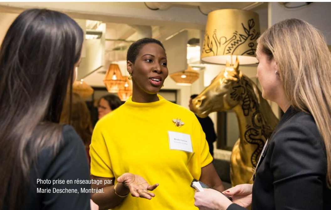
Montréal.

Sans que je vous en prévienne, je viens d'essayer de vous faire vivre une expérience colorée. La même chose se produit avec les belles couleurs qui nous vont à merveille, qui s'agencent avec notre teint, avec la couleur de nos cheveux et de nos yeux. Elles laissent des images qui s'imprègnent.