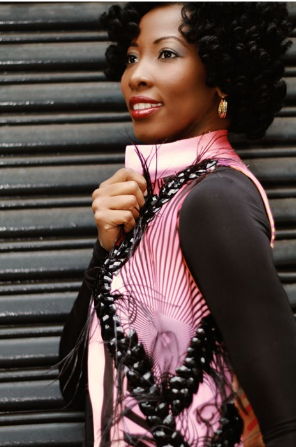
Veste et bottes, créations de Carlos De Moya.

En adoptant des couleurs qui vous vont bien, vous dégagez davantage de charisme et démontrez que vous vous appréciez.