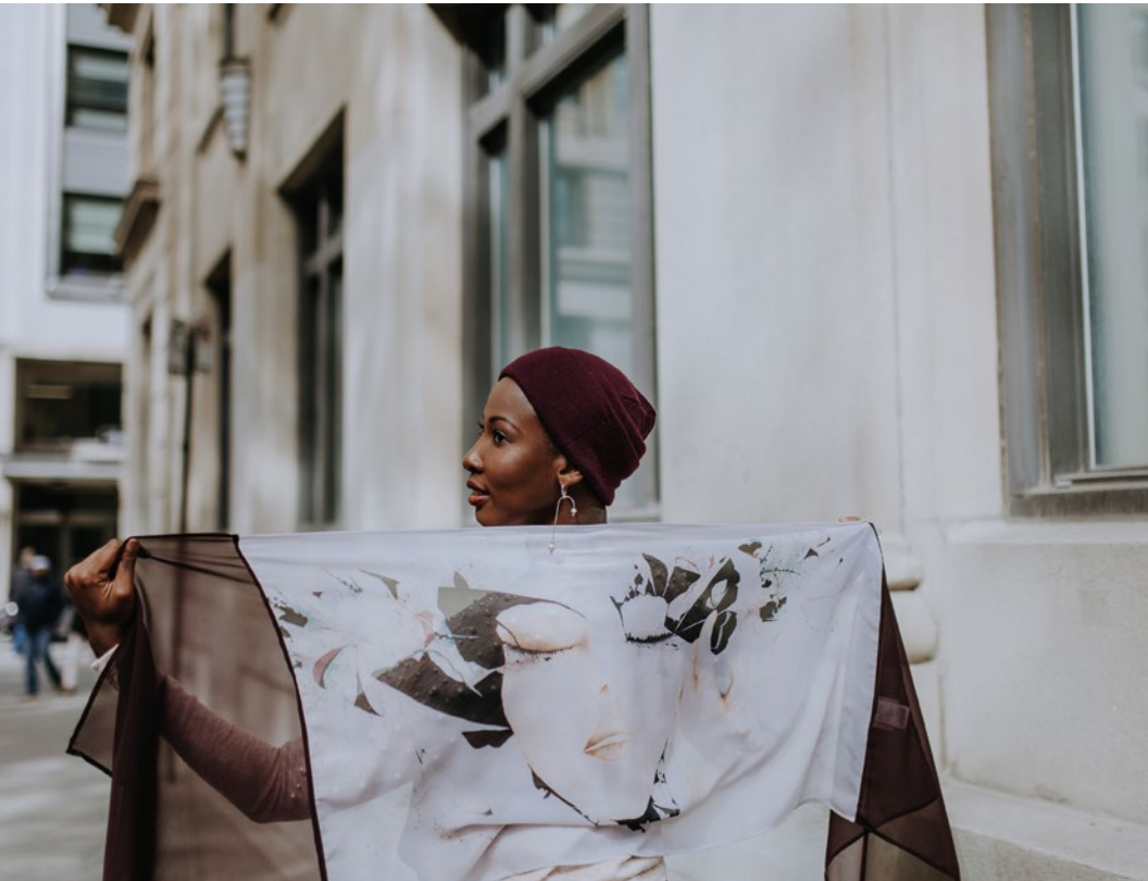
Avec un foulard de Métamorphose et Os cane, photographie par Camille Tellier, Montréal.

Cultiver notre paix intérieure nous aide à réduire le poids de nos préoccupations, de nos doutes et, pour moi, à faire davantage confiance aux autres, ce qui augmente ma capacité à pouvoir déléguer. En cultivant notre paix intérieure, même lorsque des situations imprévues surviennent, nous arrivons à nous calmer et à avoir la tête assez claire pour prendre une décision ou s'aider d'un coup de pouce. Ce qui est à changer pour mieux rebondir nous apparaît plus clairement.