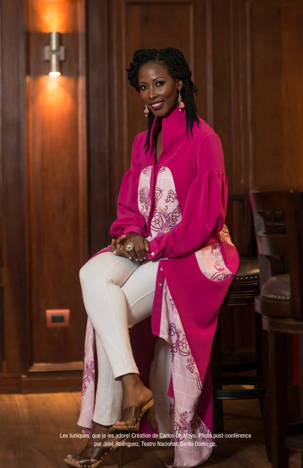
Les tuniques, que je les adore! Création de Carlos De Moya. Photo post-conférence par José Rodríguez, Teatro Nacional, Santo Domingo.