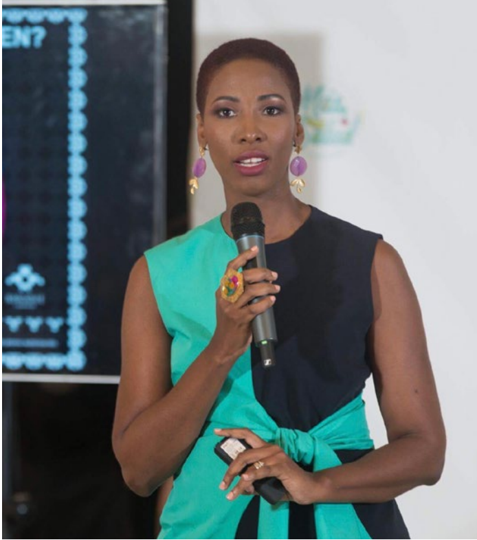
Ensemble, création de Melkis Diaz.

Déterminer nos couleurs d'une façon réfléchie nous connecte avec qui l'on est, reflète notre identité et améliore notre représentation.