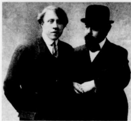
Caplet et Debussy