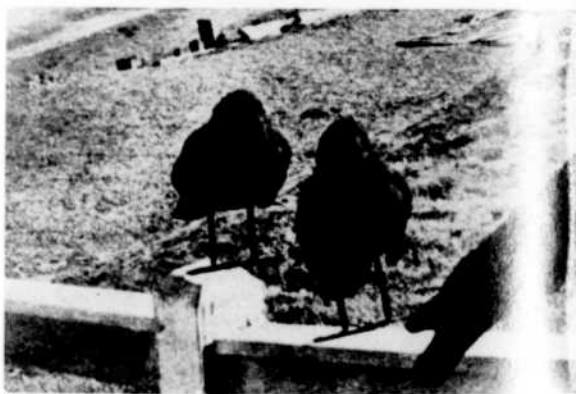
« The Birds » de Hitchcock, présenté hors-concours.