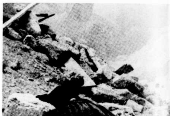
« Le Guépard » de Visconti.