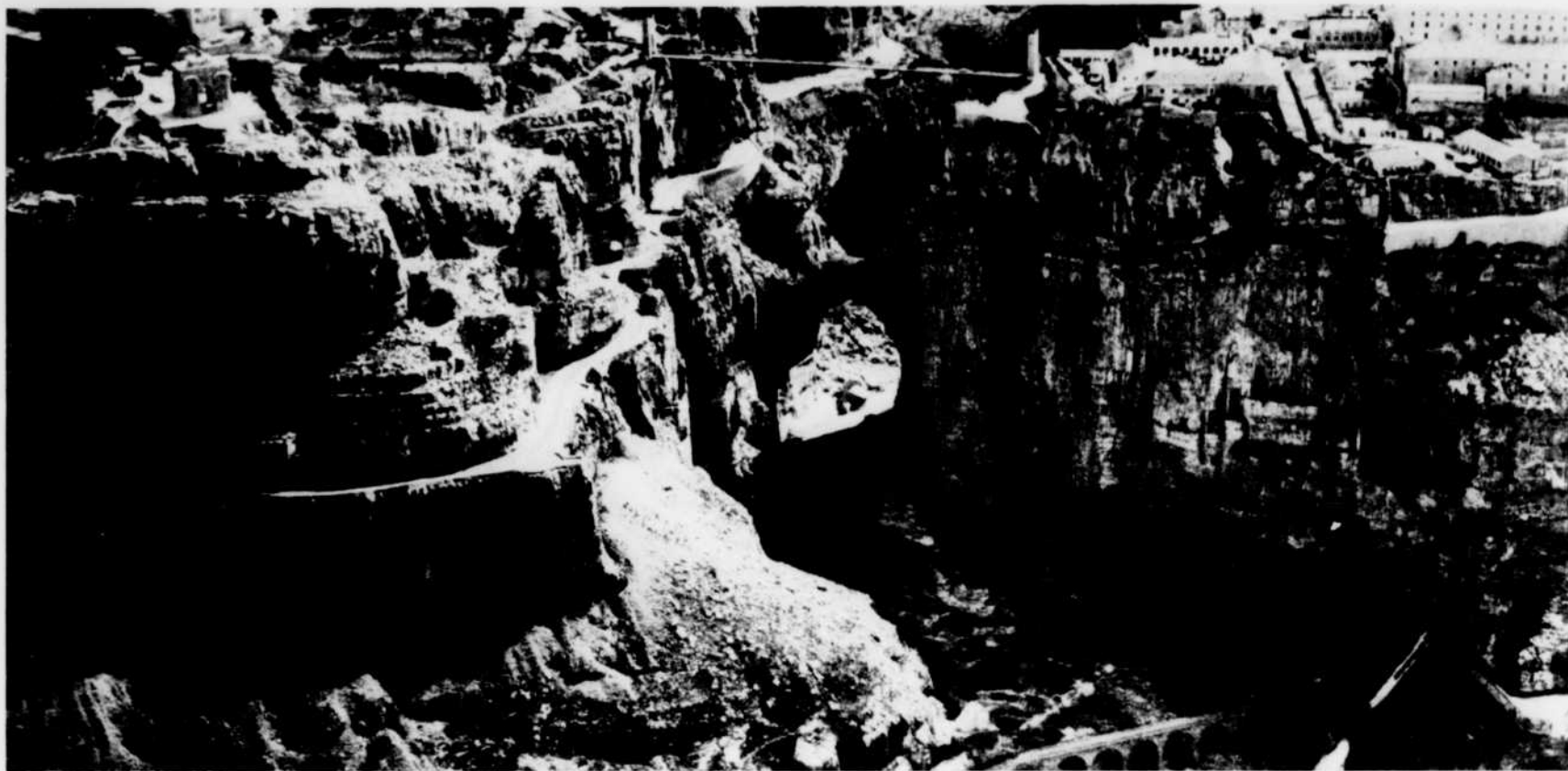
Les gorges du Rummel, en Afrique du Nord, où les Donatistes pratiquaient le suicide religieux.