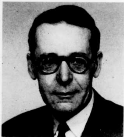
HENRI GUILLEMIN présente, les samedis et dimanche matin à 10 h. 15, un grand auteur de la littérature française.

Des circonstances imprévisibles peuvent entraîner des changements après la publication de cet horaire.