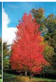
Érable rouge Armstrong