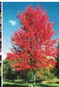
Érable Autumn Blaze