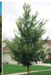
Orme New Horizon