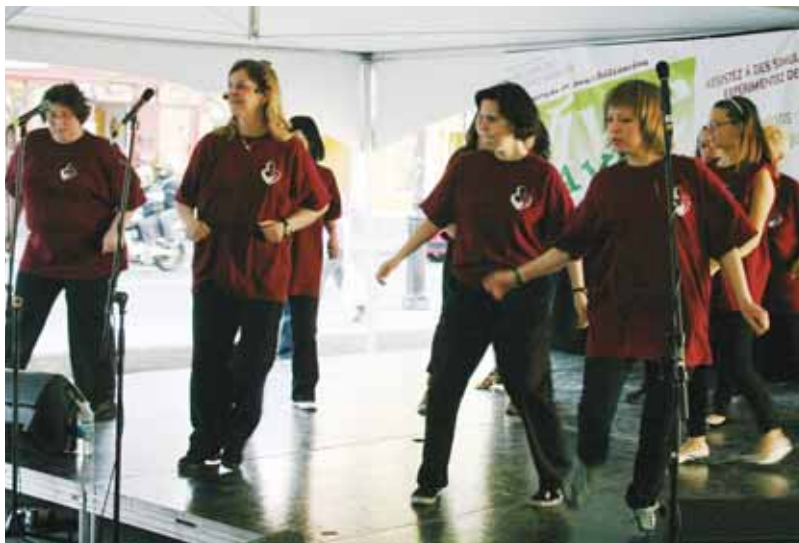
Troupe Le Choeur qui danse, de l'Association des parents et des handicapés de la Rive-Sud Métropolitaine.

Dimanche 6 juin de 10 h à 16 h Parc Saint-Charles, à l'angle des rues Saint-Charles Ouest et de Châteauguay ☎ 450 674-5224