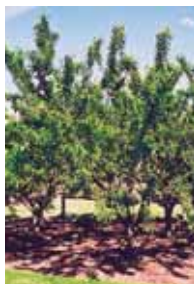
Prunier européen Mont Royal

Quantités limitées Premiers arrivés, premiers servis !