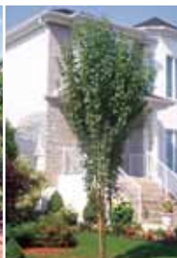
Pommier colonnaire de Sibérie