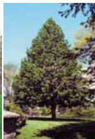
Tilleul à petites feuilles