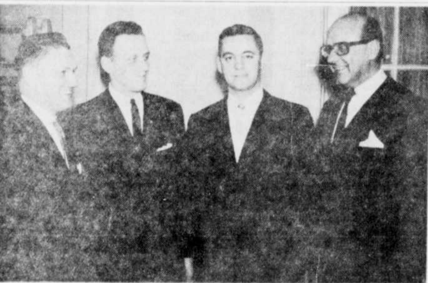
Un homme de confiance, le courtier d'assurances n'est pas seulement un vendeur de polices!