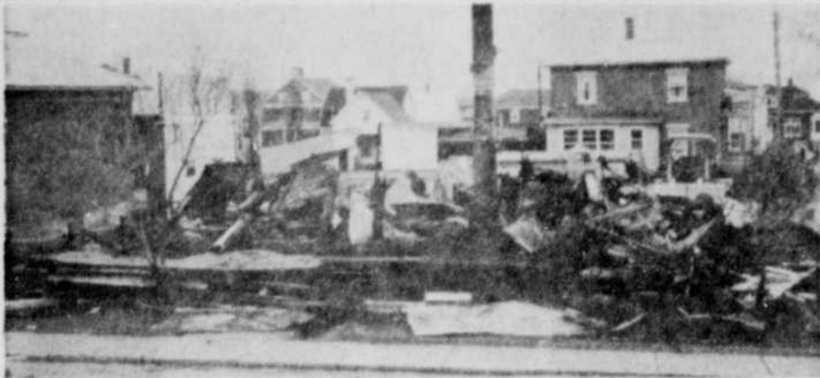
LOURDES PERTES A WARWICK — Des pertes que l'on estime à plus de $10,000 ont été rapportées à la suite d'un incendie qui s'est déclaré dans la nuit de jeudi à vendredi, à Warwick.