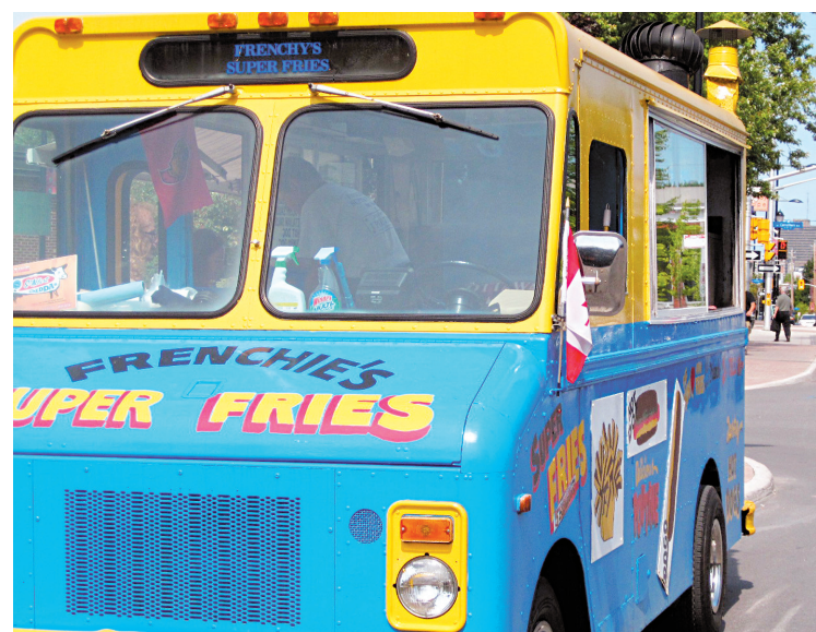
La popote roulante dite Frenchies a gagné la distinction de la meilleure poutine en Ontario. Sa roulotte est sur la rue Wellington.

Le Canada dans un panier: mille et une trouvailles alimentaires de confection canadienne au même endroit, quelle bonne idée. 55 By Ward Market Square. La Bottega Nicastrò: un incroyable supermarché italien, au 64, rue George. On se croirait à Rome. Anchois, sardines, tomates San Marsano, fromages. Impressionnant. Les sauces à pâtes Nicastrò, vendues à Montréal, sont de la même maison. Grand Pizzeria: pour une authentique pizza au four à bois aussi savoureuse que celle des