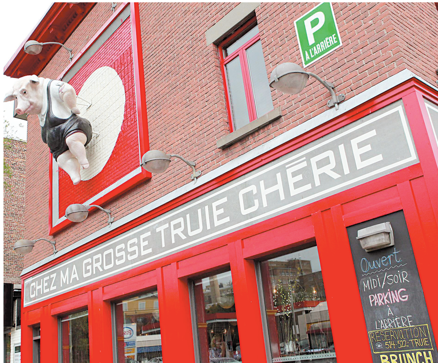
Le porc est devenu depuis quelque temps le saint cochon, au point qu'un restaurant s'est nommé Chez ma grosse truie chérie.

Mais le problème demeure entier pour les consommateurs, car, au moment où l'Agence canadienne d'inspection des aliments recom-