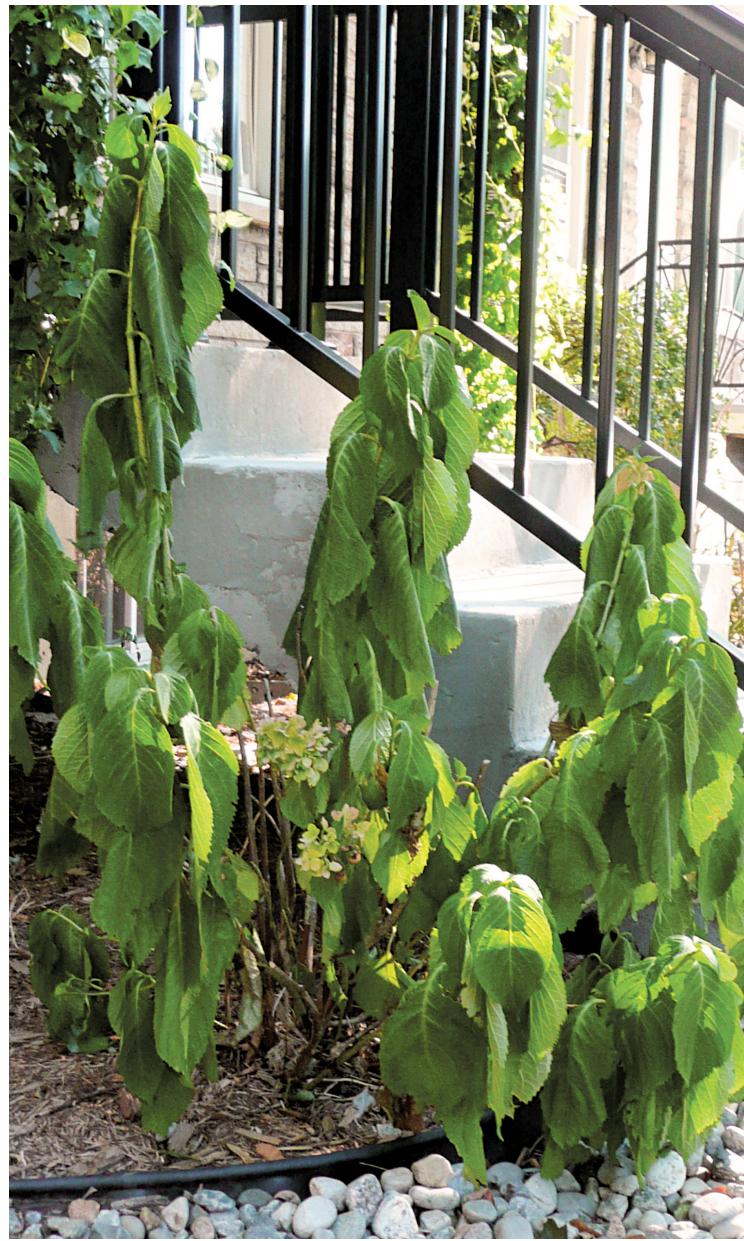
À cause d'un climat plus chaud et sec, cet été, même les plantes bien établies ont manqué d'eau.

Des questions sur votre jardin? N'hésitez pas à me contacter à lgobeille@ledevoir.com .