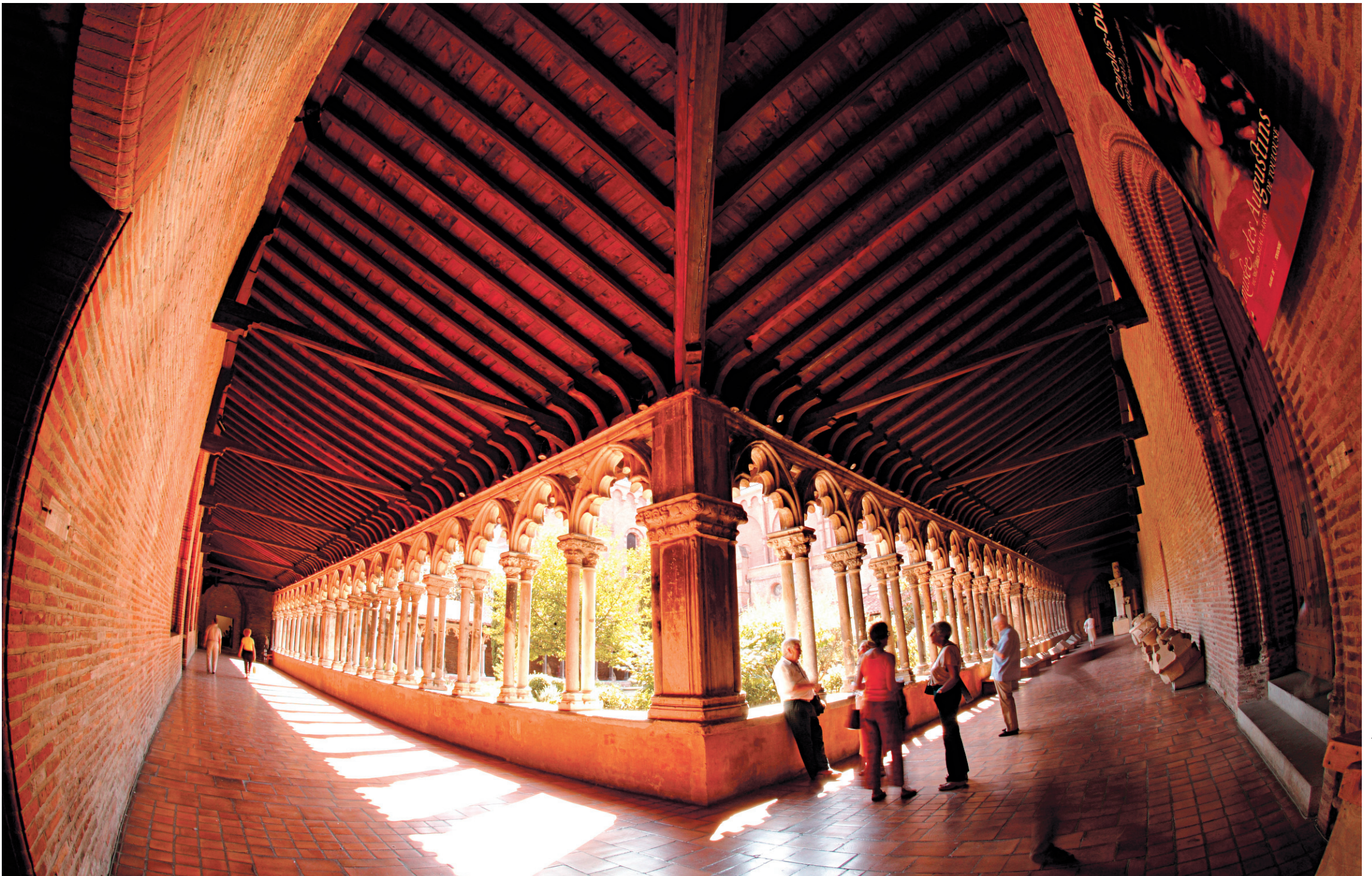
Le cloître des Augustins, musée des beaux-arts de Toulouse.

CAHIER D > LE DEVOIR, LES SAMEDI 22 ET DIMANCHE 23 SEPTEMBRE 2012