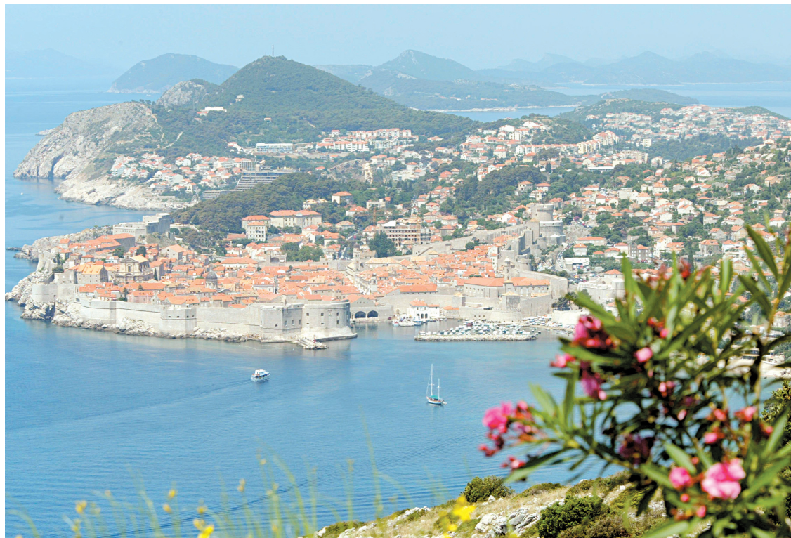
Vue de la ville de Dubrovnik, en Croatie.

Un mois à Paris en été, c'est plutôt bien: moins de circulation, moins de Parisiens stressés et toujours le même nombre de touristes. Il faudra simplement vous habituer à trouver la boulangerie et la pharmacie de garde dans le 6 e . Musées, clubs de jazz, cinémas, discos, événements dans les jardins et parcs,