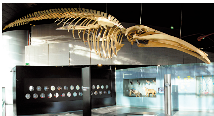
FRÉDÉRIC RIPOLL MUSÉUM DE TOULOUSE