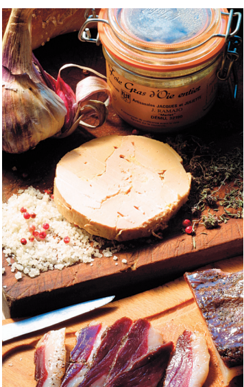
Le foie gras et le cassoulet typiques du Midi.