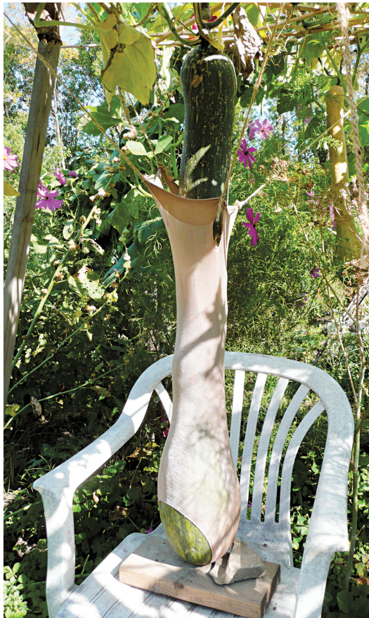
La géante courge d'Éléna au jardin communautaire Les Églantiers est si lourde qu'elle doit être soutenue par une chaise.

À cette période de l'année avec le potager, la division des vivaces et les réaménagements de jardin, on se retrouve avec des surplus de récoltes, de végétaux ou des matériaux à donner, ou encore on est à la recherche d'un de ces produits. Le site de Plant Catching permet de faire tout cela sans frais. plantcatching.com