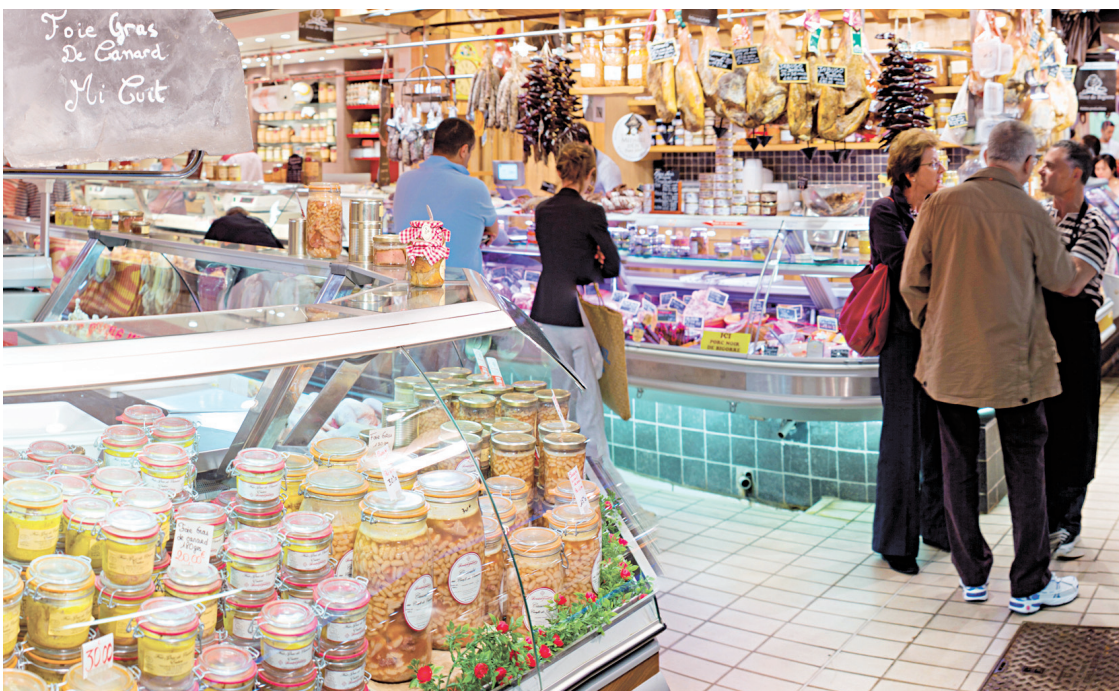
Le marché Victor-Hugo.