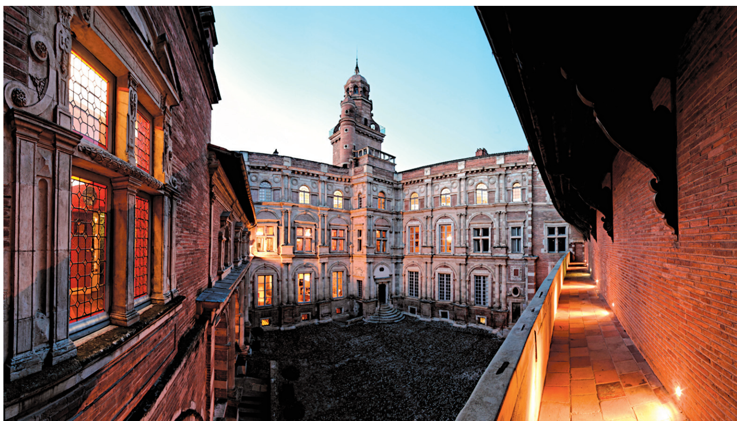
PATRICE NIN VILLE DE TOULOUSE