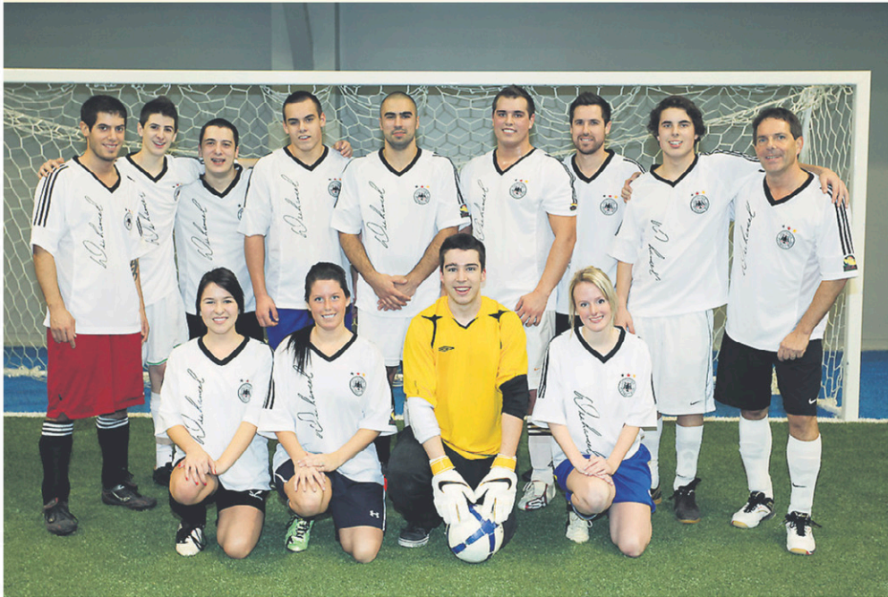
L'équipe des Rôtisseries Duhamel lors d'un tournoi de soccer au profit de la Fondation Jean-Yves-Phaneuf, en janvier 2012.