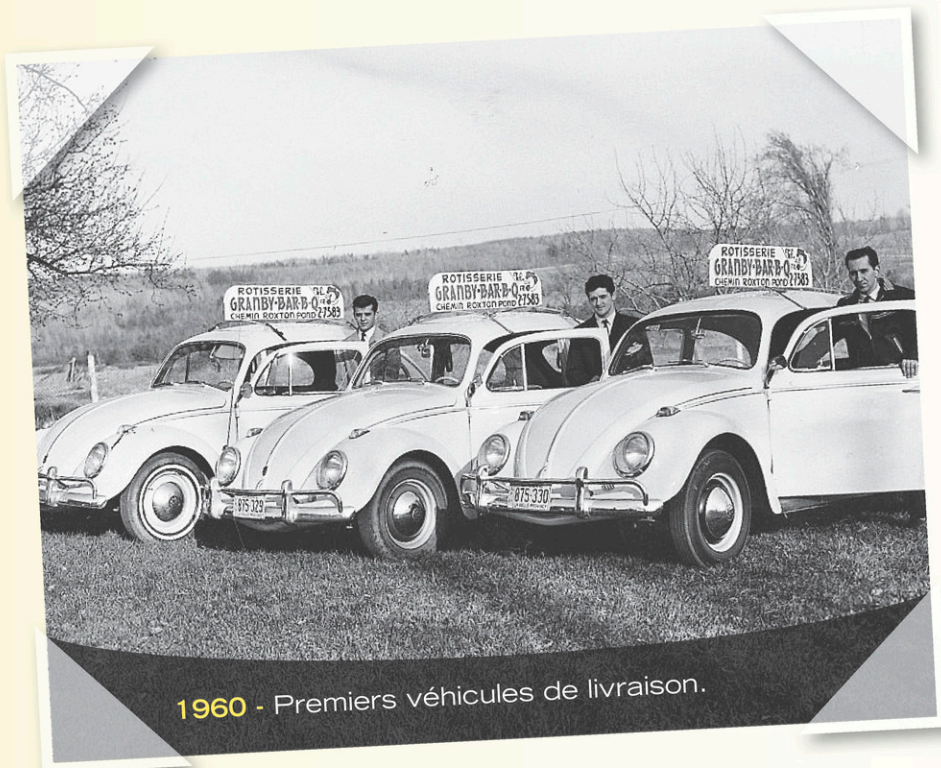
1960 - Premiers véhicules de livraison.

Initiés dès leur plus jeune âge au domaine de la restauration, Alain et Claude Duhamel, fils des fondateurs et copropriétaires actuels des Rôtisseries Duhamel, ont choisi de suivre les traces de leurs parents – l'innovation faisant aussi partie intégrante de leur philosophie. Aujourd'hui, ils se sont adjoint les services d'une équipe engagée, qui contribue à la réalisation d'une vision commune axée sur l'excellence.