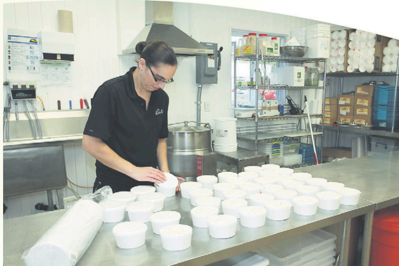
La cuisine centrale approvisionne les trois succursales des Rôtisseries Duhamel.

Bref, la cuisine centrale assure la standardisation des recettes au sein des trois établissements, où les clients retrouvent les mêmes excellents produits, dont la populaire sauce à spaghetti et la pâte à pizza, issues de recettes familiales.