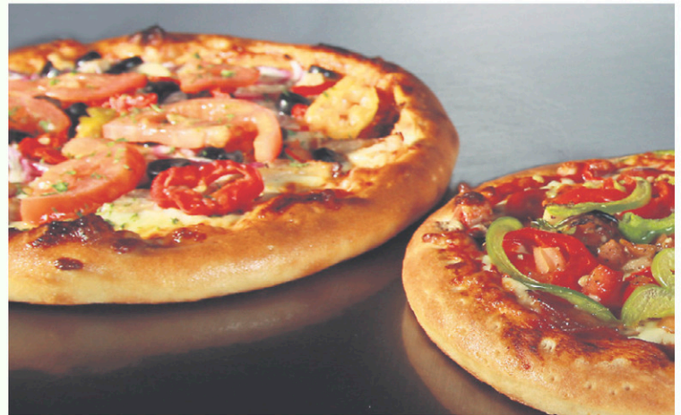
Copieusement garnies, les pizzas sont un passage obligé dans Les Rôtisseries Duhamel, d'autant plus que le fromage provient d'un fournisseur local notoire, soit Agropur.