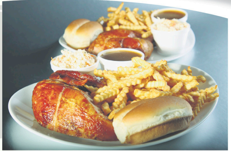
Les Rôtisseries Duhamel servent uniquement des poulets en provenance du Québec, et les frites y sont cuites avec de l'huile de canola. La gestion efficace et proactive des huiles garantit une qualité de cuisson supérieure.

Depuis, le poulet et la pizza sont l'apanage des Rôtisseries Duhamel, auxquels viennent s'ajouter des mets de base parfois cycliques. « Il est bon de savoir qu'au Québec, les produits à base de volaille sont soumis à des normes de contrôle très rigoureuses, gages de qualité, poursuit-il. Nous offrons aussi deux modes de cuisson de la viande, soit traditionnelle ou à l'ancienne sur charbon de bois, ainsi qu'un mets exclusif, la Pizzados. Cette pizza a été conçue à l'intention des adolescents, selon un format hors standard de 20 pouces, mais tout le monde peut évidemment la commander! »