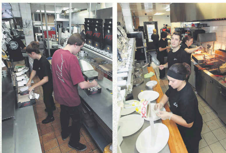
Aux Rôtisseries Duhamel, les clients ont le privilège de voir les talents culinaires à l'œuvre grâce aux cuisines à aires ouvertes.