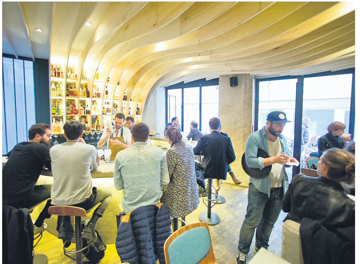
Situé tout près du canal Saint-Martin, le Gravity Bar est un endroit tout en courbes, du plafond en bois aux comptoirs de béton.

44, rue des Vinaigriers 10 e arrondissement facebook.com/gavitybar