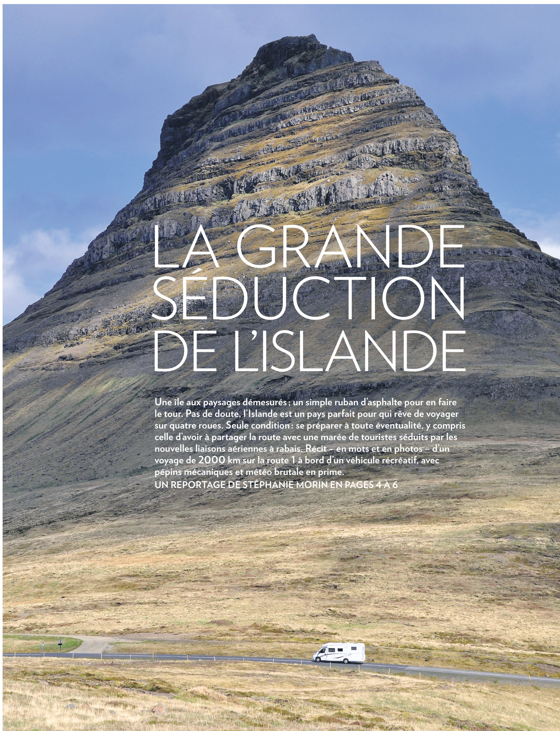
Le mont Kirkjufell, dans la péninsule de Snæfell.

UN REPORTAGE DE STÉPHANIE MORIN EN PAGES 4 À 6