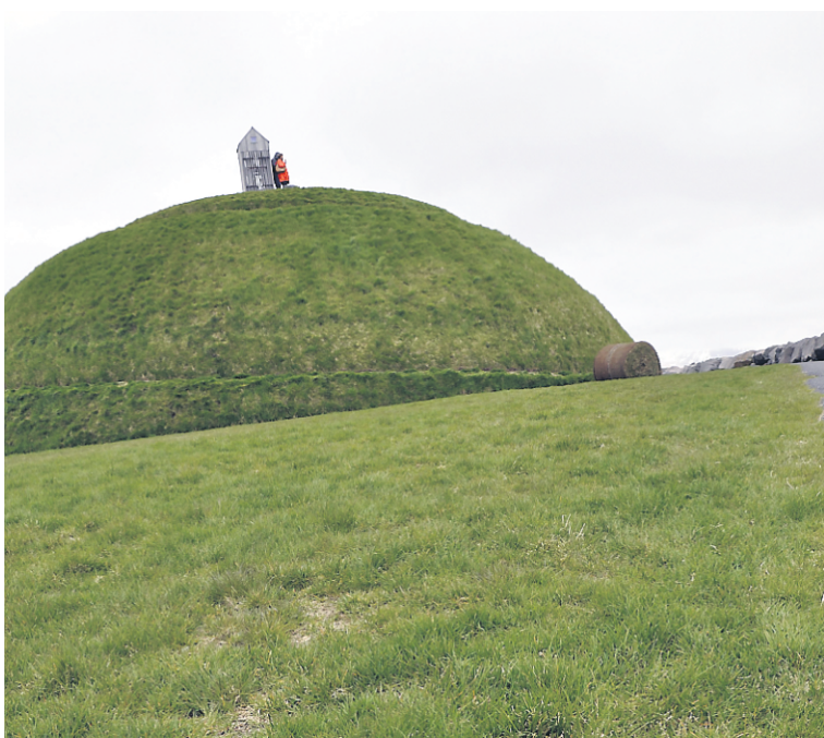
Pufa, œuvre d'art publique dans le port de Reykjavik.