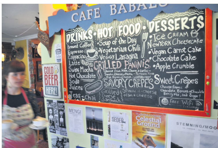
Le café Babalú, à Reykjavik.