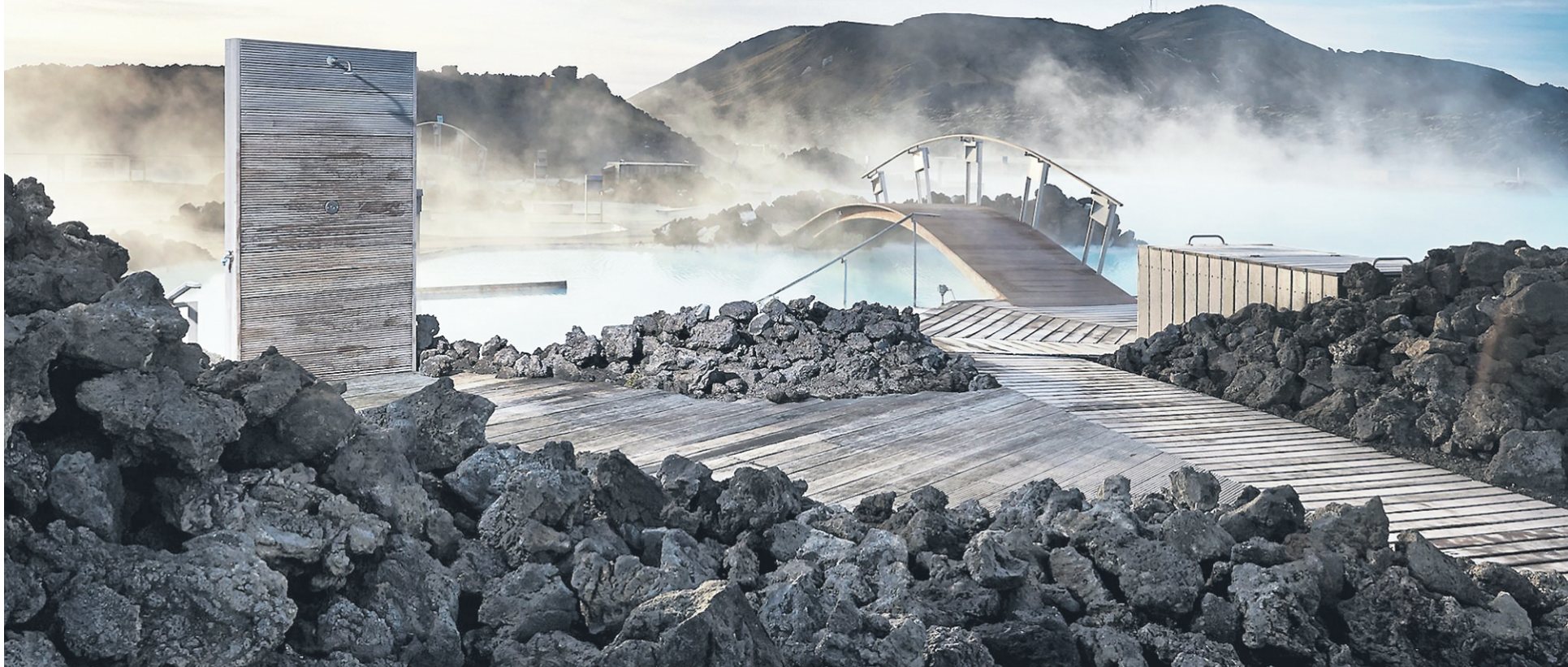
Le spa géothermique Blue Lagoon est le site le plus visité d'Islande.