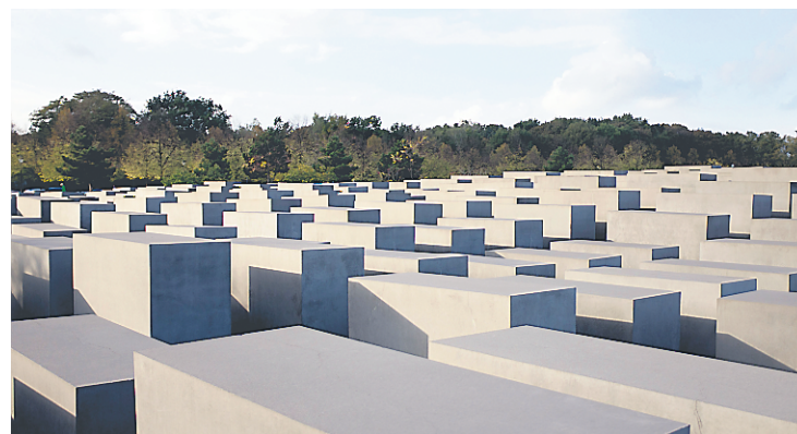
L'Holocaust Mahnmal est l'initiative d'un groupe de citoyens. Hommage aux victimes de l'Holocauste, le monument est composé de 2711 stèles disposées en rangées sur 19 073 m 2 . Ces blocs de béton à hauteur variable représentent « un système qui se veut ordonné mais qui a perdu le contact avec la raison humaine », et ont été installés de cette façon afin de « créer un sentiment de malaise et de confusion chez le spectateur qui les traverse ». Le nom de chacune des victimes juives est écrit dans le musée situé sous ce mémorial.