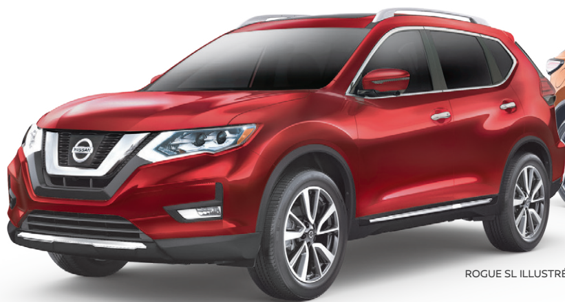
ROGUE SL ILLUSTRÉ*

(Le rabais Mon Choix de 3 500 $* et le crédit de 4 000 $* sur les pièces et accessoires s'appliquent au Titan 2017.)