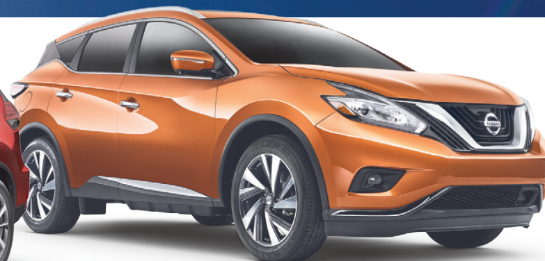
MURANO PLATINE ILLUSTRÉ*