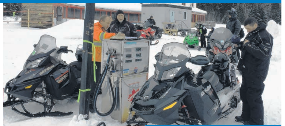
Les motoneigistes ont pu jouir de la reprise des activités du Relais de la Cache à Cascapédia.

La Gaspésie est de plus en plus renommée pour son ski hors-piste et sa neige poudreuse. L'hiver qui nous quitte n'en a pas fait exception. Les différentes activités offertes dans le Parc national de la Gaspésie, au Chic-Chac de Murdochville ainsi que dans les autres centres de skis de la péninsule ont ravi les skieurs étrangers et locaux. Encore une fois, les