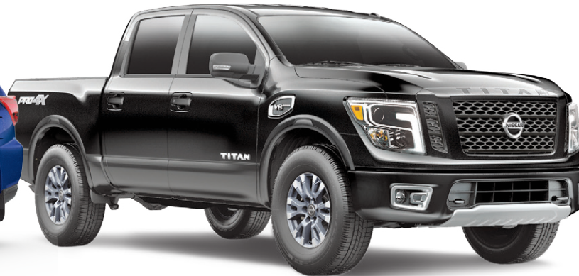
TITAN PRO-4X ILLUSTRÉ*