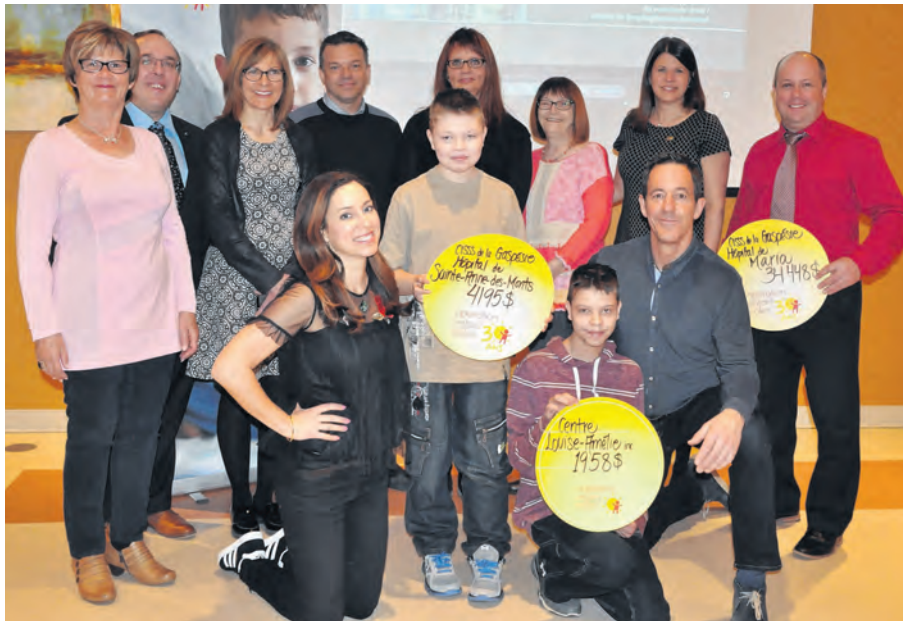
Plus de 40 000 $ ont été annoncés lors du passage d'OES à Bonaventure, pour Maria et Sainte-Anne-des-Monts.

OES ne reçoit pas de dons dédiés. Ainsi, tous les montants amassés sont centralisés et redistribués. Les sommes sont remises à 87 % aux quatre grands centres pédiatriques du Québec, et 13 % est redistribué dans les centres hospitaliers régionaux qui peuvent faire des demandes pour de l'équipement spécialisé. « Les établissements font une demande et un comité d'experts indépendants les analyse et