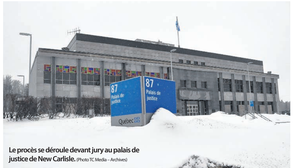
Le procès se déroule devant jury au palais de justice de New Carlisle.

Certains scénarios plus violents, toujours envers des femmes en raison de la nature du crime dont il était suspecté, avaient pour but d'amener Réal Savoie à s'identifier au groupe. «L'objectif n'était pas de démontrer qu'on était un groupe dangereux, mais qu'il comprenne comment fonctionnait l'organisation; que la violence envers les femmes ne nous