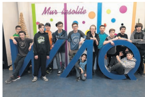
La première édition du WAQ Junior a comblé les 13 étudiants gaspésiens présents à l'événement.

Cet événement numérique offrait une panoplie d'activités, de forums et de conférences aux participants. Ils sont plus d'une trentaine d'entrepreneurs et de professionnels gaspésiens à y avoir assisté. Il s'agissait pour eux d'une opportunité de choix de mettre