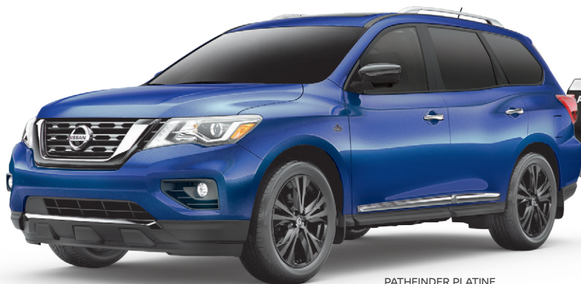
PATHFINDER PLATINE ÉDITION MINUIT ILLUSTRÉ*