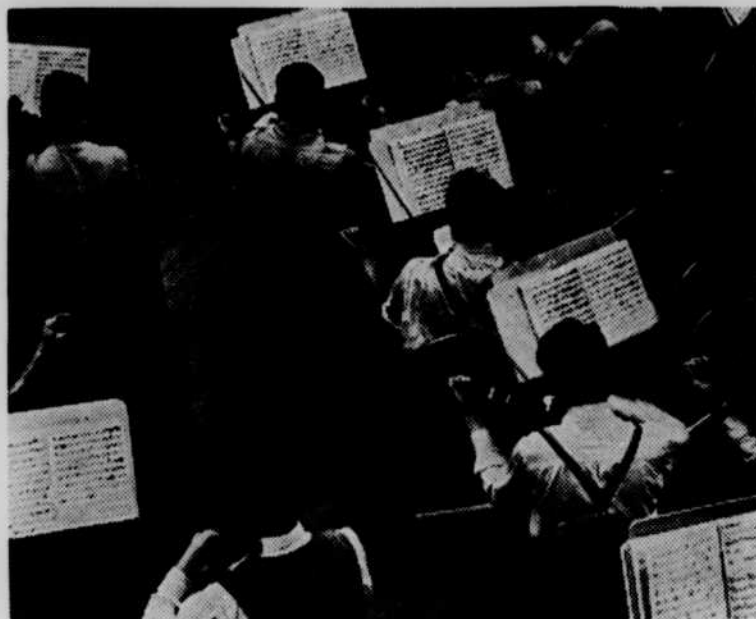
La photo ci-dessus montre une partie des musiciens qui composent l'Orchestre Symphonique de Radio-Canada dont les concerts hebdomadaires sont entendus sur les postes du réseau Français, le lundi, à 10 h. 15 du soir. Cet orchestre est dirigé alternativement par les meilleurs chefs d'orchestre canadiens et étrangers. Des solistes réputés participent également à ces concerts qui sont diffusés de Toronto. Les programmes sont consacrés à des oeuvres classiques et contemporaines.