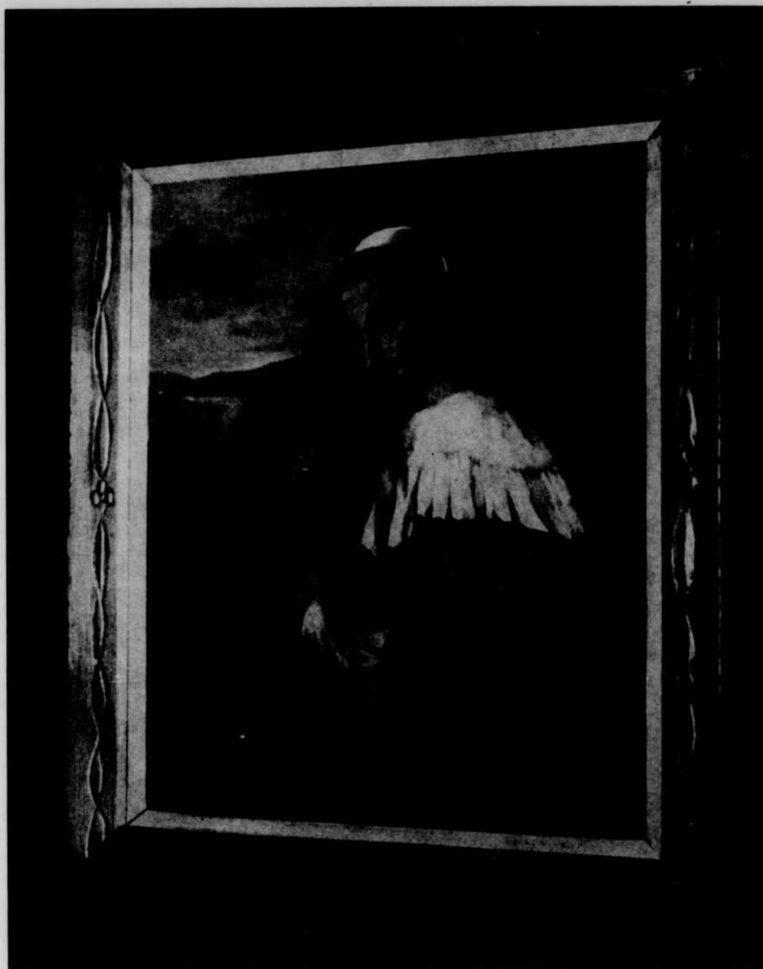
La fondatrice de l'Hôtel-Dieu de Montréal