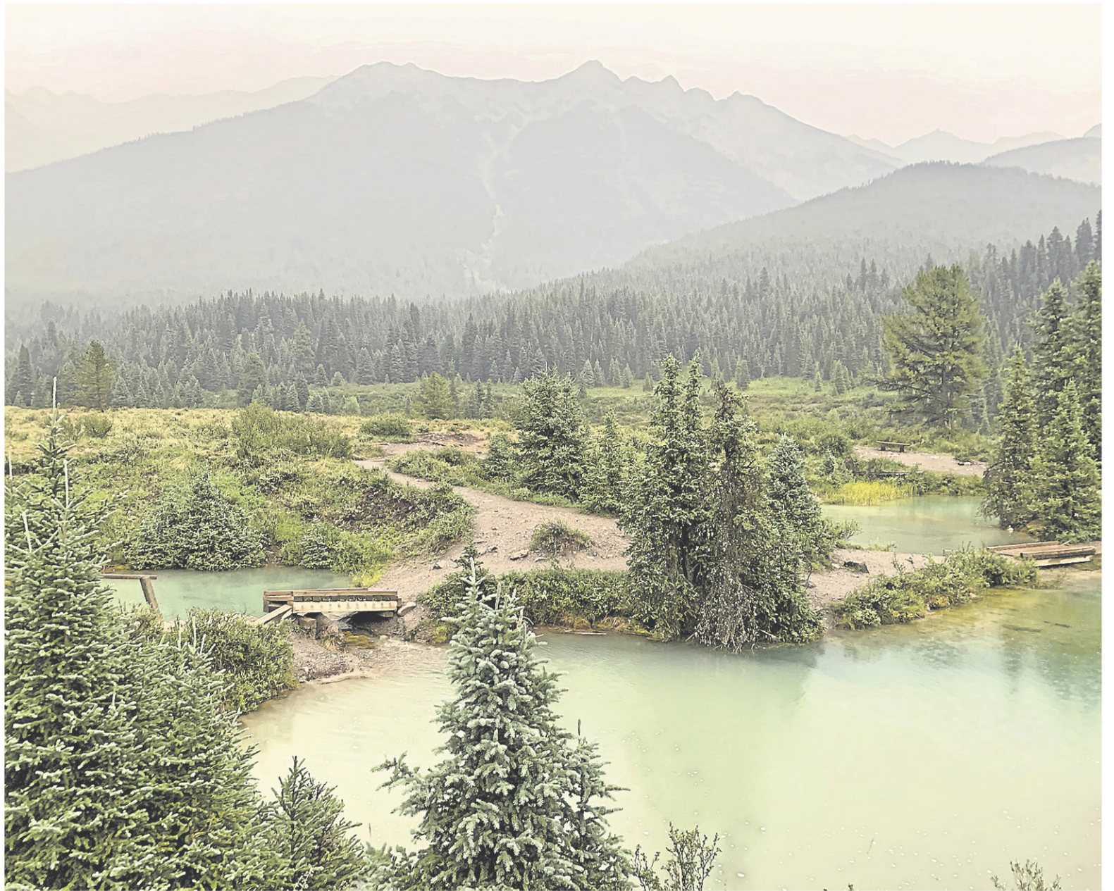
Au canyon Johnston, les cuves d'eau colorées appelées pots d'encre (Ink Pots) sont moins impressionnantes que le panorama lui-même. Il faut dire que la pluie a joué les trouble-fêtes en diluant les couleurs éclatantes dont se réjouissent normalement les touristes.

Le lac Minnewanka est le seul de tout le parc national de Banff où les embarcations à moteur sont acceptées.