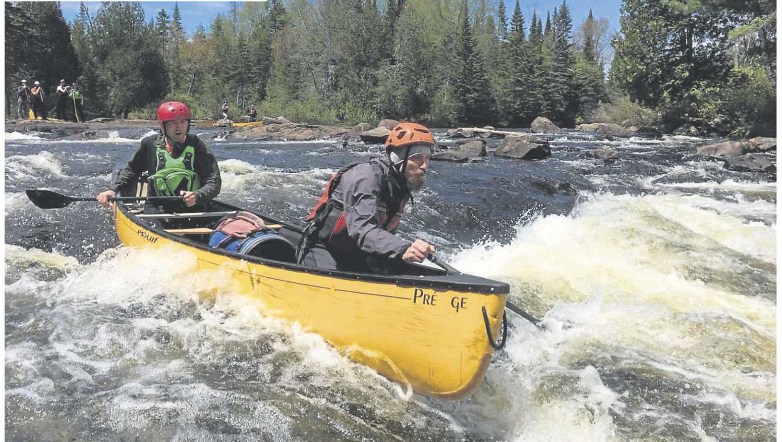
Pour suivre une formation en eau vive, comme celle-ci organisée il y a quelques années, il faut avoir réussi un programme d'introduction au canotage et, idéalement, une formation en eau calme. Bref, il faut revenir au Canot 101.

Les aspirants canoteurs essaient les fameux coups sur la terre ferme,