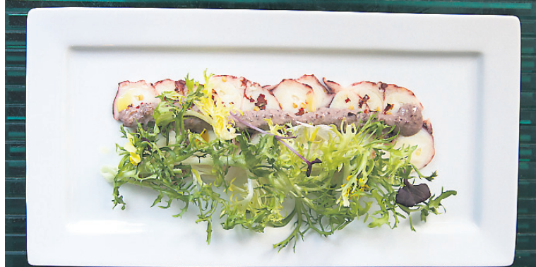
Plats à l'Atelier d'Argentine