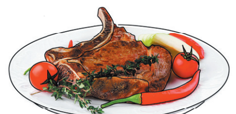
Asados GRILLADE DE BŒUF TROUVEZ LA RECETTE DANS SAQ.COM

Bœuf à l'argentine PARFAIT AVEC DES VINS TYPIQUES DU PAYS