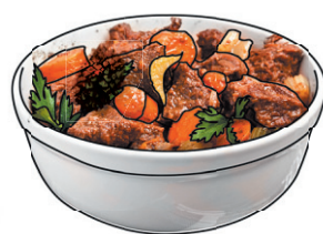
Carbonada MIJOTÉ DE BŒUF TROUVEZ LA RECETTE DANS SAQ.COM