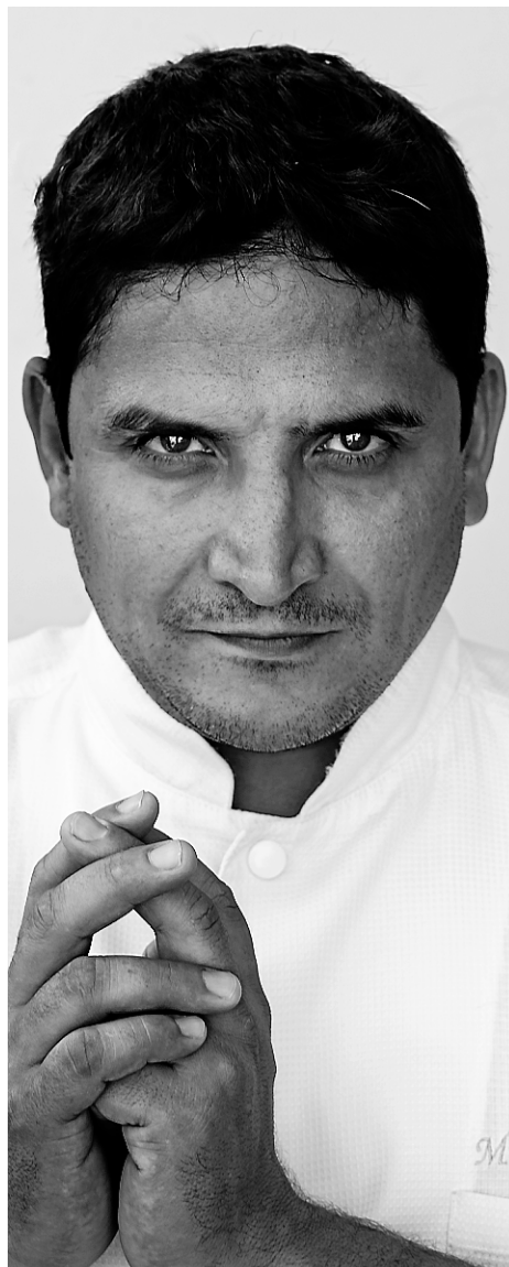
Mauro Colagreco fait partie de ceux qui façonnent le chemin que prend la cuisine actuelle comme des fins sablés au mascarpone et fraises ou du loup à l'oseille sauvage et sauce fumée (en bas).

Mais dans l'assiette, le résultat est fignolé, précis. On est loin des plats de pâtes à partager, goulument. Les terroirs sont exprimés de façon simple, mais les techniques sont audacieuses