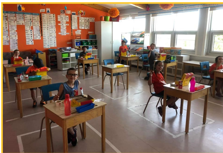
À l'école de la Rivière de Sainte-Hedwidge, l'année scolaire s'est terminée par des olympiades et un dîner.