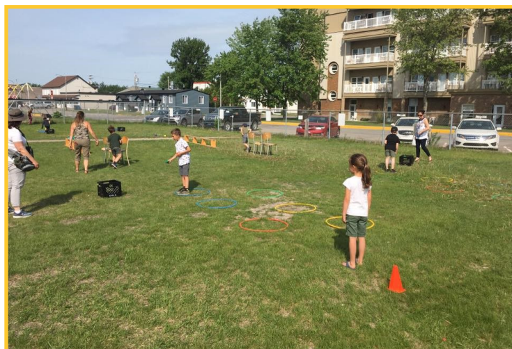
Les « aventuriers caniculares » de l'école Sainte-Thérèse de Dolbeau-Mistassini.