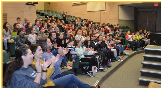
Près de 130 élèves de la 4 e à la 6 e année du primaire ont participé au colloque.