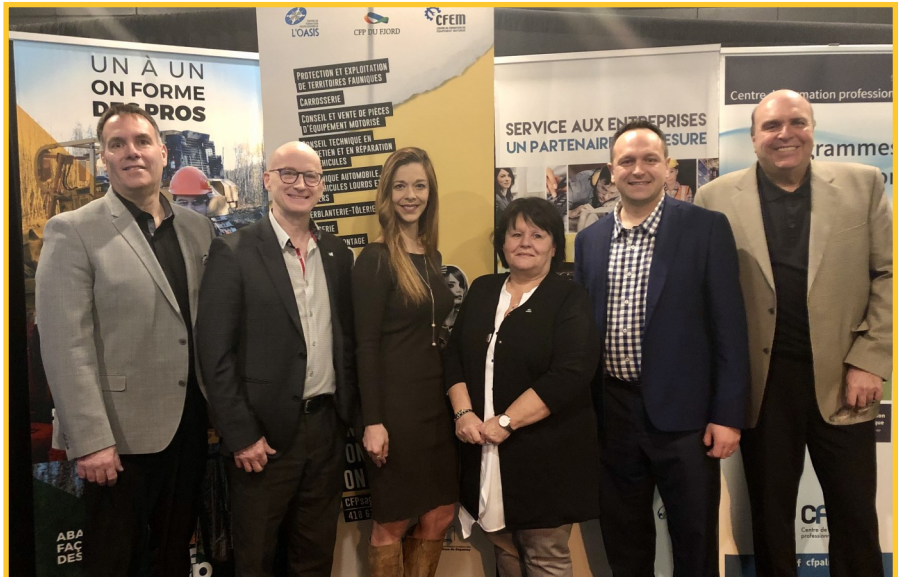
Le lancement s'est déroulé à Alma le 21 janvier 2020, en présence de plusieurs personnes impliquées dans cette initiative régionale.