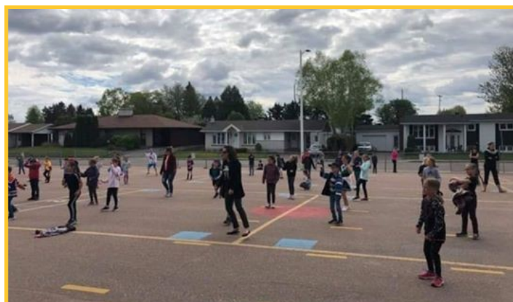
À l'école Hébert de Saint-Félicien, les élèves ont pratiqué la zumba pendant la récréation matinale des jeudis du mois de juin.

La prochaine rentrée scolaire sera différente de celles que nous avons connues auparavant. Mais dès le 28 août, les équipes des établissements scolaires, soutenues par le personnel des centres administratifs, seront prêtes à accueillir les élèves dans le respect des normes qui seront alors en vigueur.