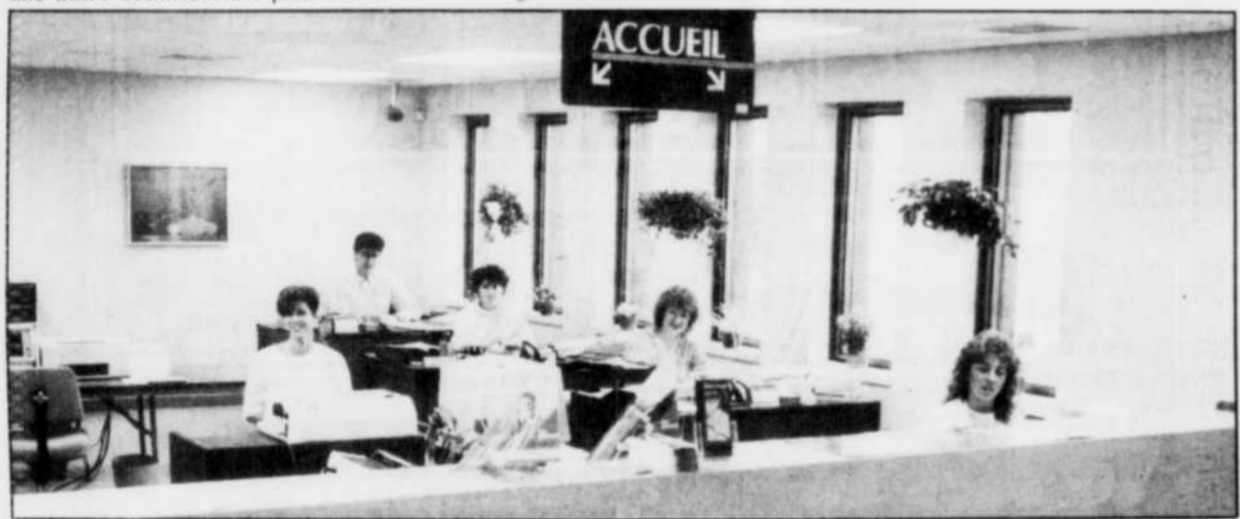
L'ambiance détendue et ultra-moderne du second palier, affecté aux services spécialisés d'épargne et de crédit.

POUR LA FÊTE DES PÈRES... OBTENEZ UN CADEAU