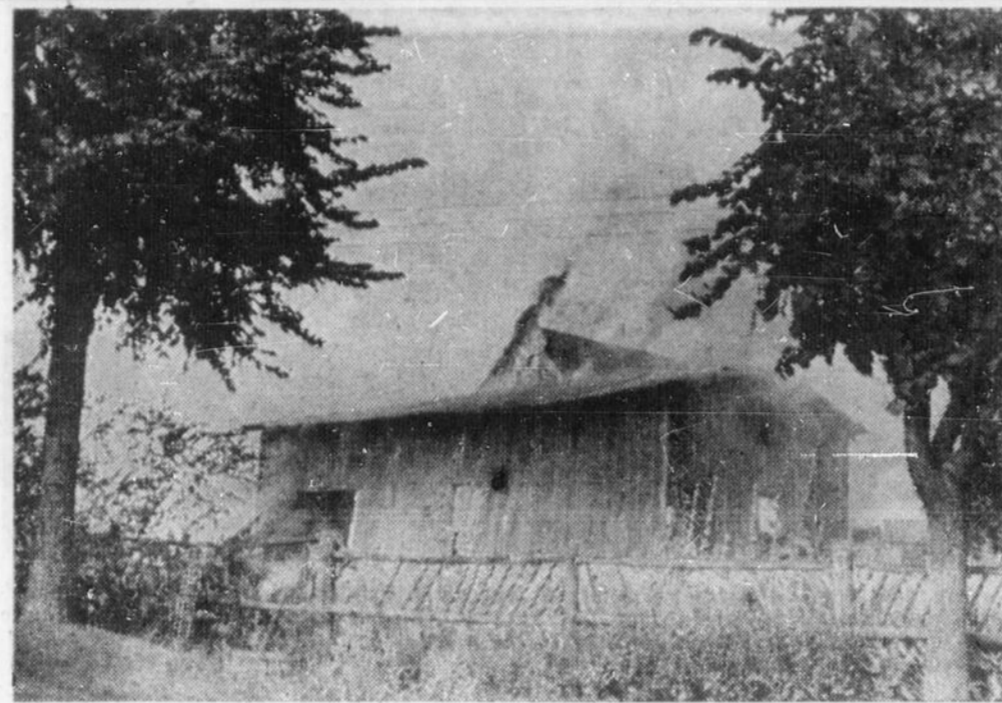
GRANGE INCENDIÉE — Une grange, une écurie et une remise ont été grandement avariées au cours d'un incendie au 369, rue McArthur, vers 4h. 30, lundi après-midi. Les pompiers d'Eastview ont pris près d'une heure pour circonscire l'élément. Ces bâtiments,

Cette question a été longuement débattue au Conseil de ville, au Bureau des commissaires, au comité consultatif sur les besoins hospitaliers de la capitale. Elle fut discutée chez les groupes intéressés et, après plusieurs mois, elle est enfin soumise au Conseil pour approbation. Toutefois, il faudra attendre trois autres semaines avant de savoir si les religieuses pourront obtenir une aide financière qui leur permettra la construction de cet hôpital à l'angle du chemin Base Line et de l'avenue Fisher.