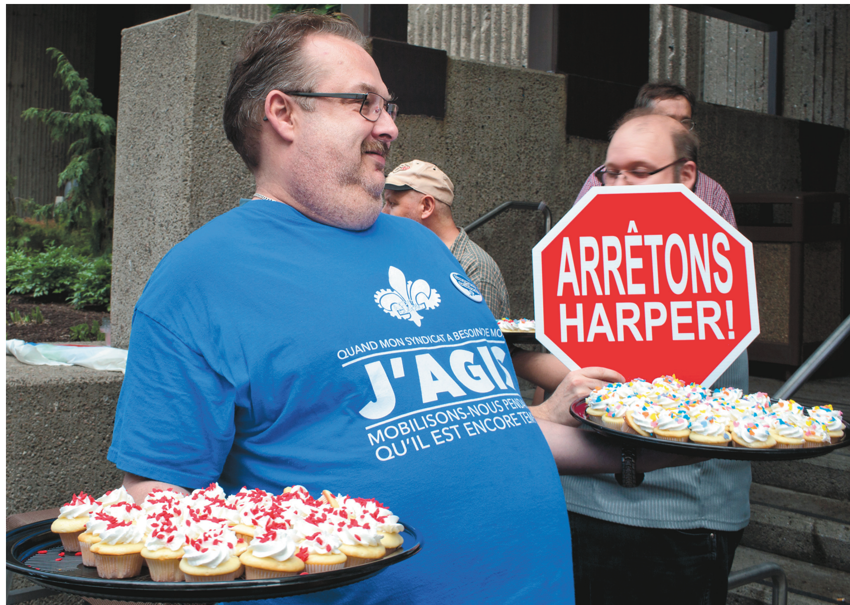
Les fonctionnaires fédéraux se sont rassemblés mardi dans tout le Canada pour protester entre autres contre le musellement des scientifiques canadiens et l'ingérence dans le développement de la science publique.