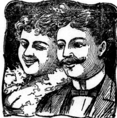
La faiblesse chez les jeunes ou les vieux peut être guérie radicalement et la maladie rendue à un état florissant de santé. Les personnes souffrant de