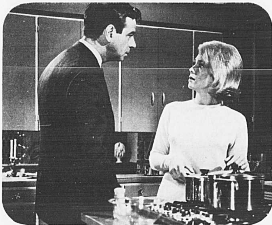
Walter Matthau et Inger Stevens dans "Guide for the Married Man"