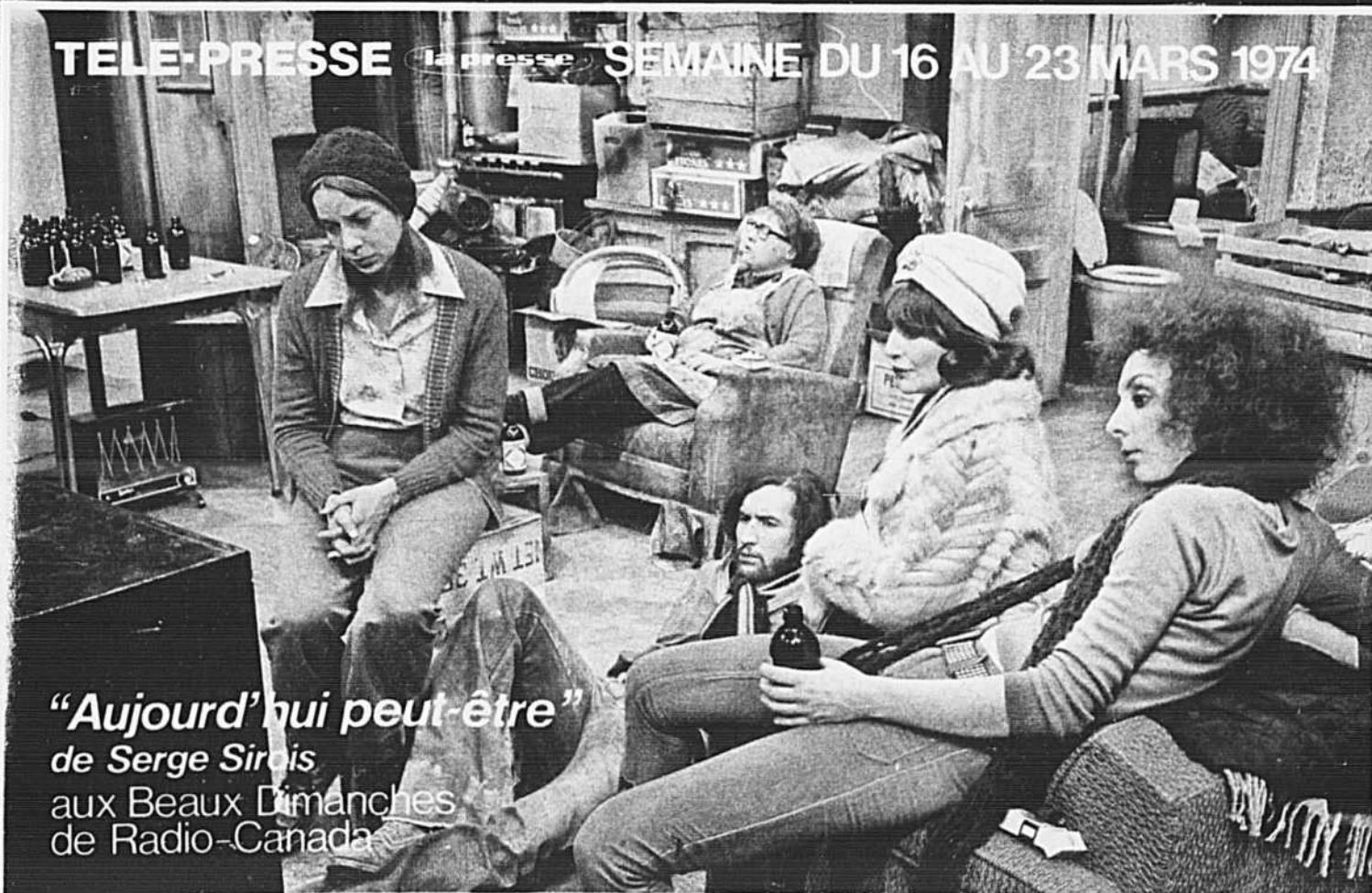
"Aujourd'hui peut-être" de Serge Sirotis aux Beaux Dimanches de Radio-Canada