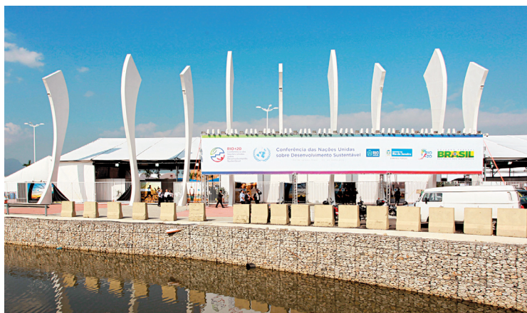
Quelque 130 personnes, représentant près de 70 organismes québécois, participeront à la Conférence des Nations unies sur le développement durable à Rio de Janeiro, au Brésil.

La structure organisationnelle de Rio+20 est complexe et comprend trois niveaux de participation. Le premier niveau est constitué des délégations officielles des pays qui participeront à la conférence. Ce sont ces délégations qui négocieront entre elles afin d'accoucher d'un texte commun à la fin de la conférence.