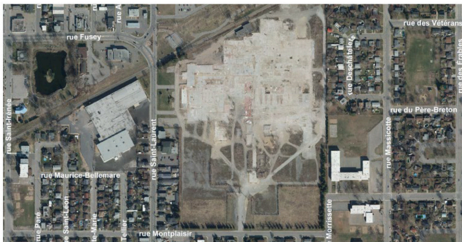
Le site de l'ancienne usine Aleris accueillera un nouveau quartier urbain durable.

« Chaque fois qu'une activité de consultation publique était menée, les résultats des discussions étaient amenés à la table d'un comité interne à la Ville qui évaluait les recommandations, indique Mikaël Morrissette, responsable des relations publiques et porte-parole pour la