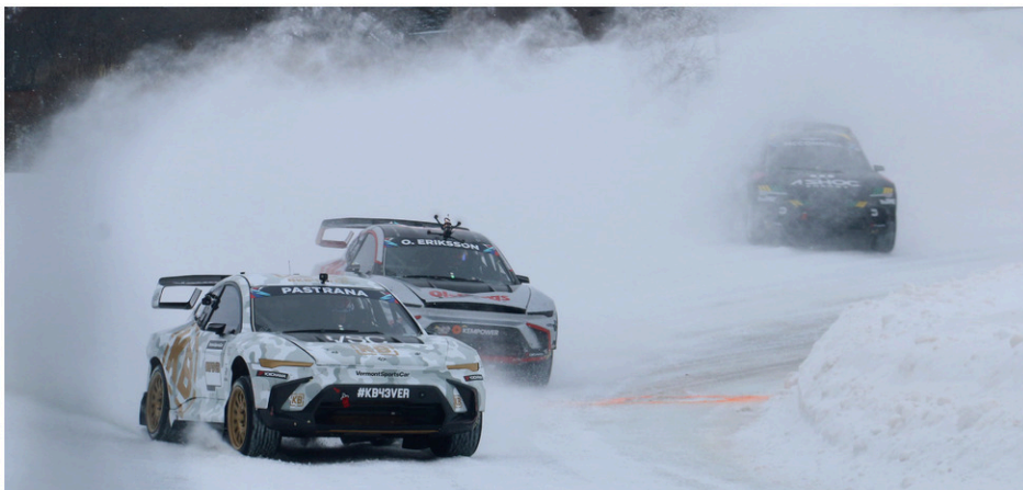
Le Nitro RX du GP3R se tenait les 20 et 21 janvier à l'Hippodrome de Trois-Rivières.

glace à Calgary, alors ce sont de bonnes nouvelles. En piste, on a eu un très bon spectacle. J'aurais aimé avoir davantage de gros noms dans la série maîtresse, mais bon. Les pilotes ont eu du fun!»