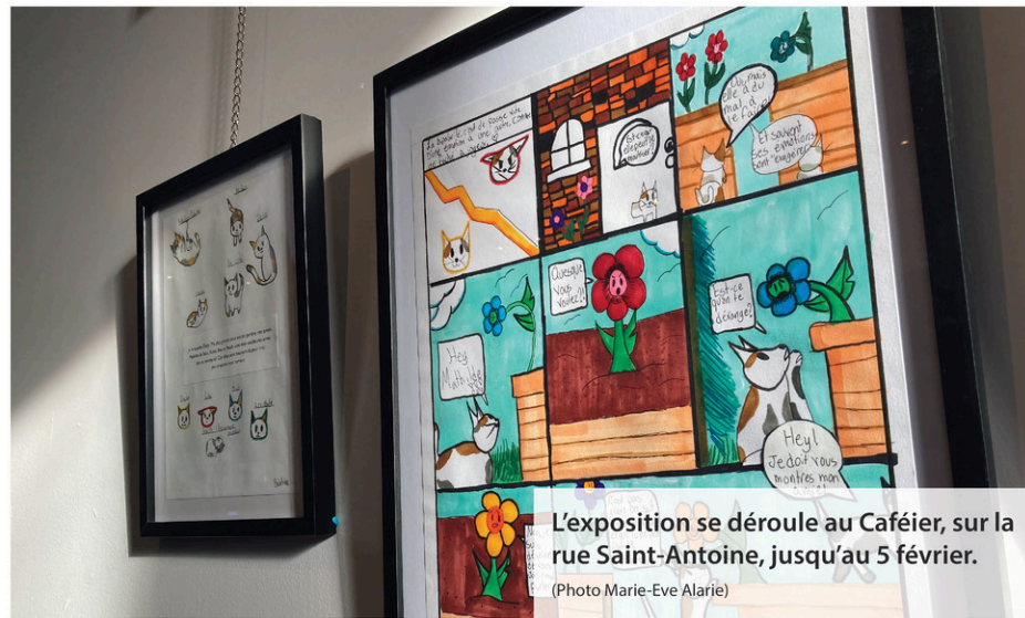
L'exposition se déroule au Caféier, sur la rue Saint-Antoine, jusqu'au 5 février.

Ce projet fut aussi l'occasion de collaborer avec le Centre d'études interdisciplinaires sur le développement de l'enfance et la famille (CDEIF) de l'Université du Québec à Trois-Rivières