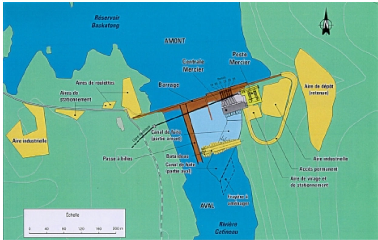
FIGURE 1 : LOCALISATION DES OUVRAGES DE LA CENTRALE MERCIER (TIRÉE DE L'ÉTUDE D'IMPACT)

La centrale puisera son eau dans le réservoir Baskatong, à même les puits de fond 19 à 24 existants du barrage Mercier (Figure 2). Il n'y aura donc pas de construction d'un canal d'amenée. Des grilles à débris seront installées sur la face amont du barrage, afin d'empêcher les débris d'y entrer. L'eau empruntera de courtes conduites forcées qui l'achemineront vers les groupes turbine-alternateur. De là, elle se déversera dans la rivière Gatineau par un canal de fuite de 150 m de longueur situé immédiatement en aval de la centrale. Ces travaux de construction du canal de fuite nécessiteront l'excavation de 28 000 m 3 de déblais.