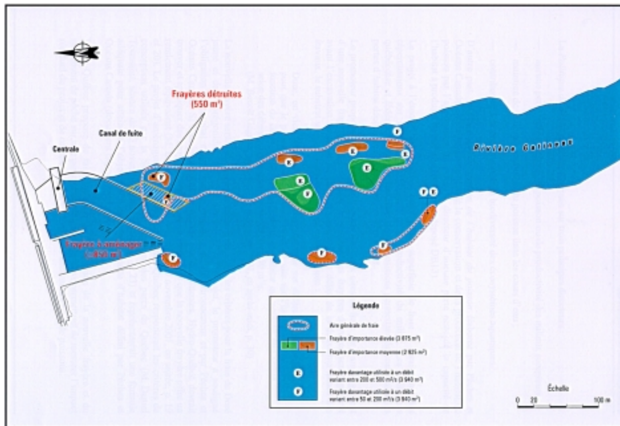
FIGURE 4 : EMPLACEMENT DES FRAYÈRES EXISTANTES EN AVAL DU BARRAGE MERCIER (TIRÉE DE L'ÉTUDE D'IMPACT)

Le doré utilise ces aires de frai du 7 au 20 mai environ, à un moment où d'importantes variations de débit se produisent. Ainsi, entre 1967 et 1997, 50 % des variations des débits journaliers se situent entre 76 et 238 m 3 /s pour cette période. Pour ce qui est des corégonidés, ils fraient en automne aux mêmes endroits lorsque la température de l'eau atteint 6 °C et moins. Selon les conditions de débits rencontrées et les profondeurs correspondantes, les espèces se déplacent dans la zone de frai pour y trouver les conditions de vitesse et de profondeur optimales.