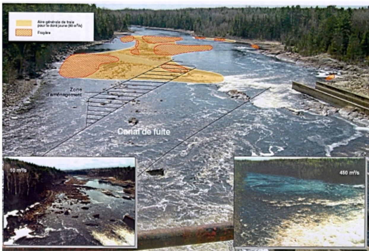
FIGURE 3 : EMPLACEMENT DES FRAYÈRES À DORÉ JAUNE, DU CANAL DE FUITE ET DE LA FRAYÈRE À AMÉNAGER EN AVANT DE LA CENTRALE MERCIER (TIRÉE DE L'ÉTUDE D'IMPACT)

À moins de 200 m en aval du barrage on retrouve une importante aire de frai près de la rive gauche de la rivière située essentiellement sur la portion aval d'un grand haut-fond (Figure 3). Au printemps, quand le débit est faible (moins de 50 m 3 /s), la section aval est exondée et l'eau sortant des pertuis de fond s'écoule le long de la rive droite de la rivière. Par contre, la frayère se trouvant sur l'amont du haut-fond est inondée à un débit de 25 m 3 /s. Lorsque le débit augmente, après le remplissage du réservoir, l'eau inonde toute la largeur de la rivière, rendant la frayère en amont du haut-fond moins attrayante puisque la profondeur de l'eau à cet endroit devient supérieure aux exigences de frai des espèces présentes. L'utilisation de la frayère et son importance dans le maintien des espèces seront discutées dans une section présentée ci-dessous.