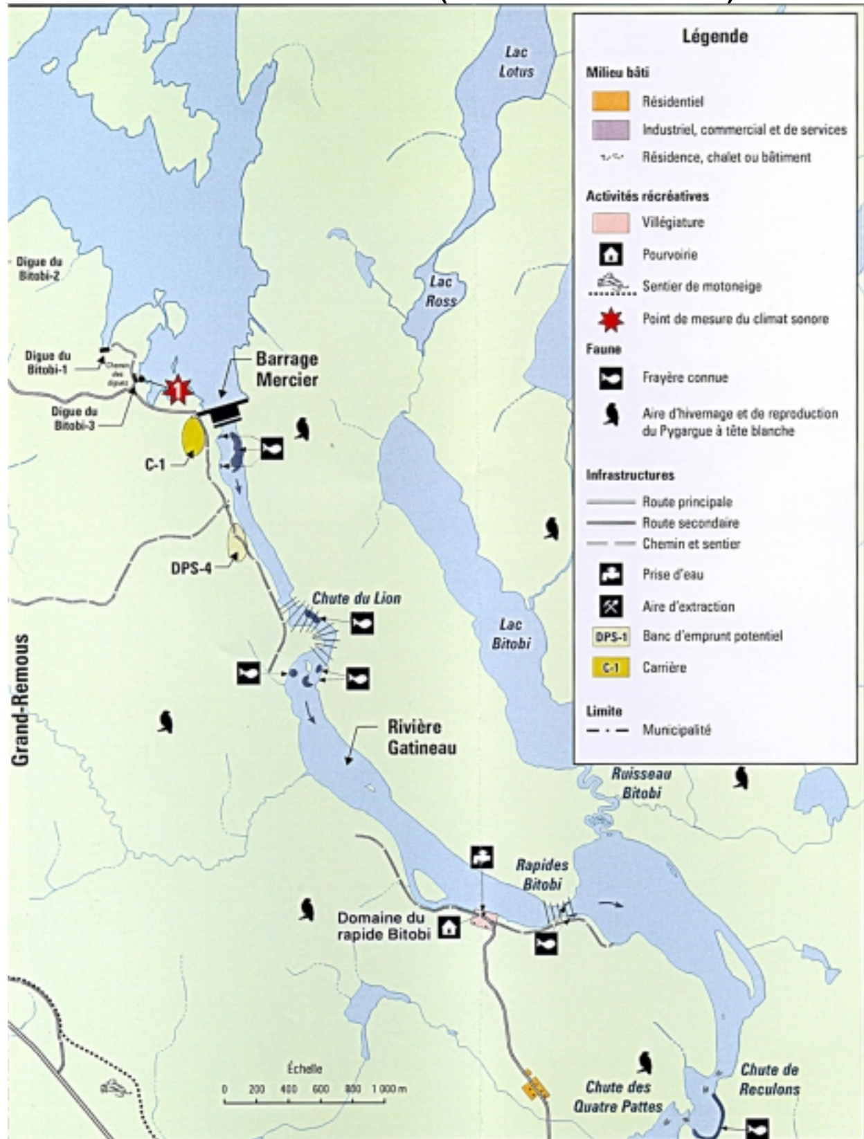
FIGURE 6 : ACTIVITÉS RÉCRÉOTOURISTIQUES ET CARACTÉRISTIQUES FAUNIQUES DANS LA ZONE DES TRAVAUX (TIRÉE DE L'ÉTUDE D'IMPACT)