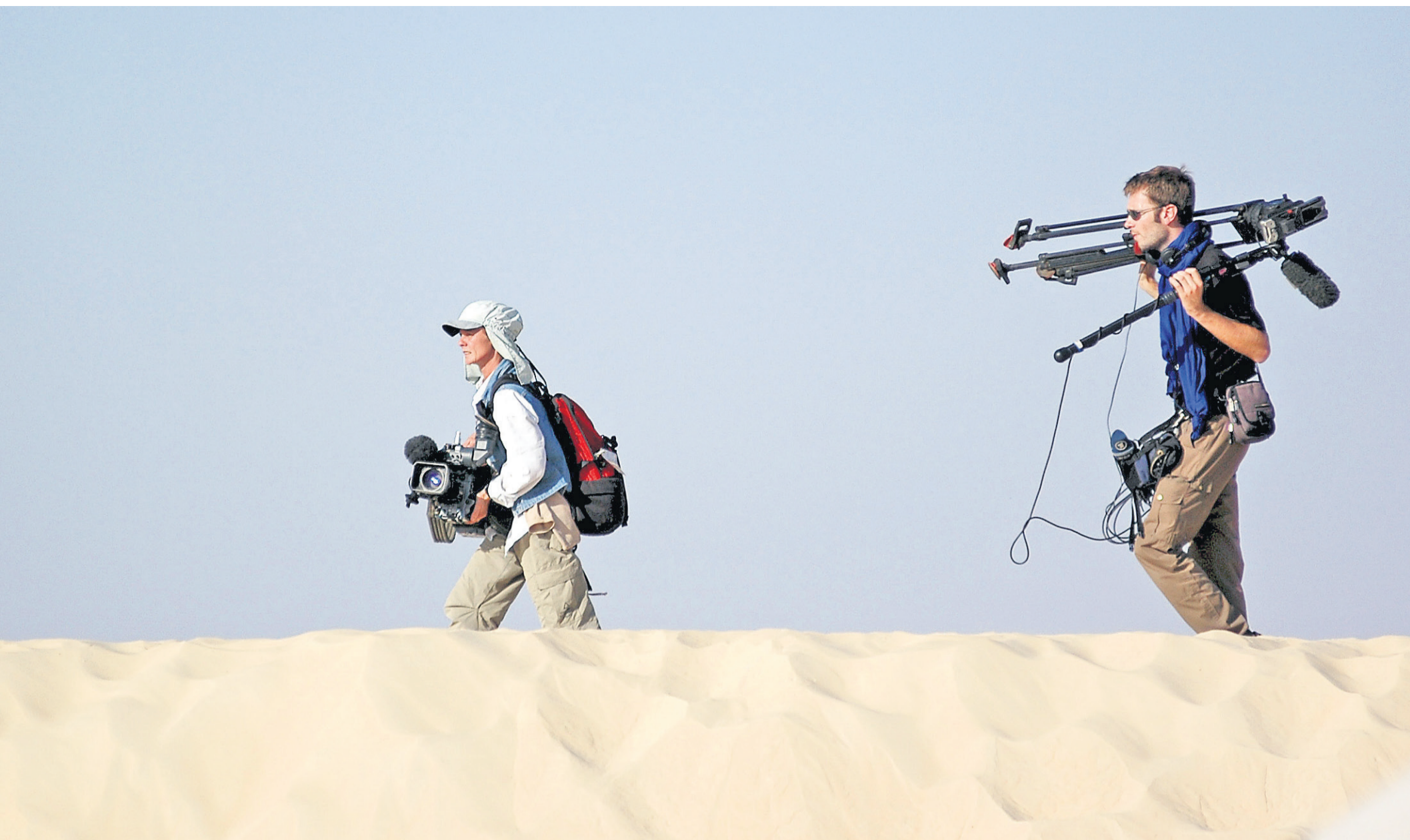
Sur la dune, on peut croiser des Touaregs à dos de dromadaire ou des équipes de tournage venues de partout.