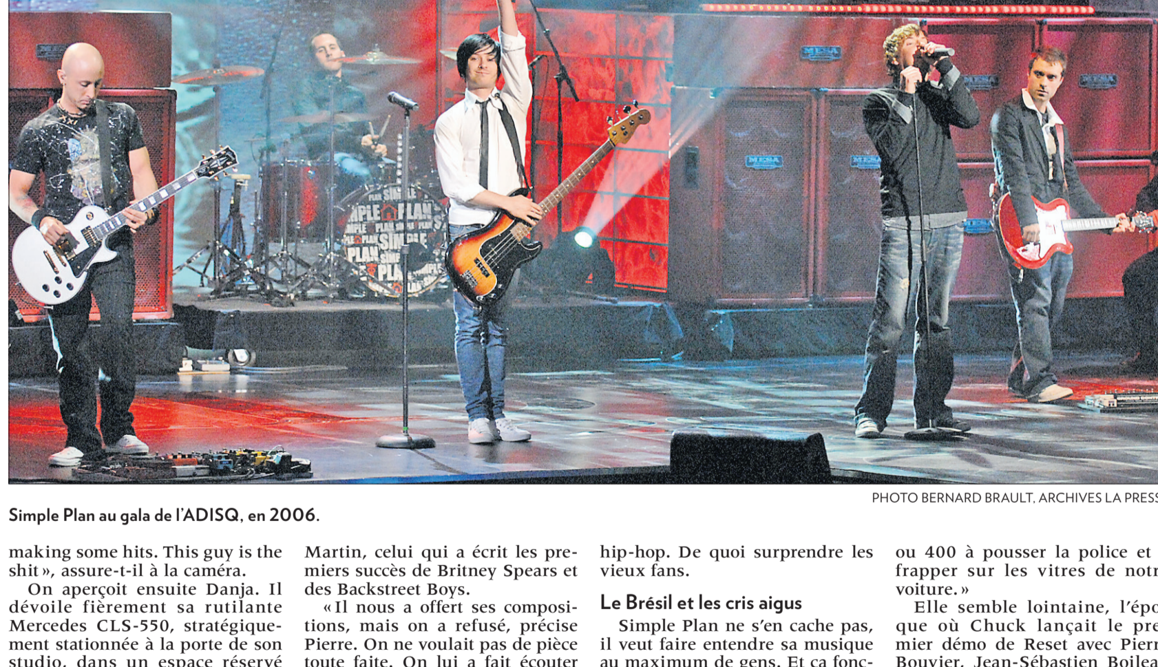
Simple Plan au gala de l'ADISQ, en 2006.

Premier arrêt: chez Danja à Miami, quelques semaines plus tard.