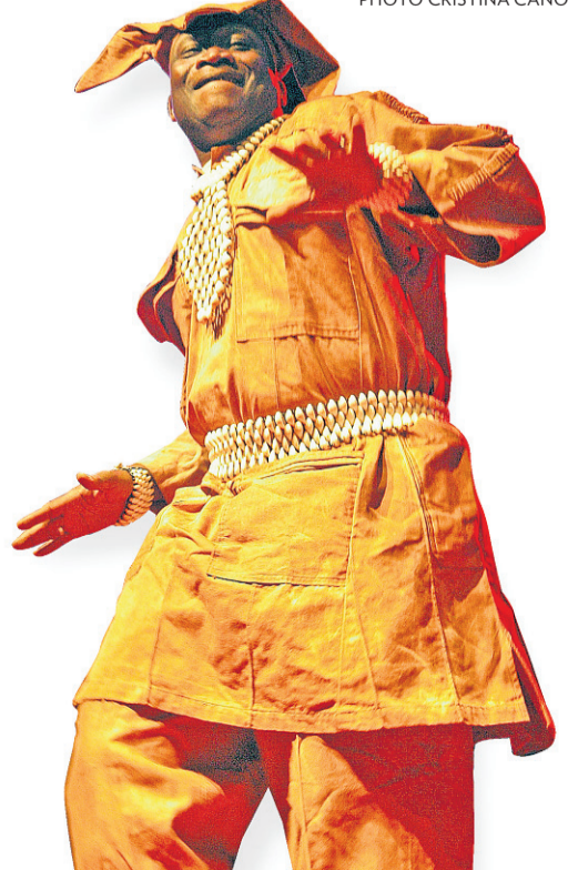
Toumani Diabaté