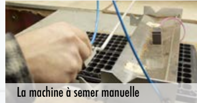
La machine à semer manuelle