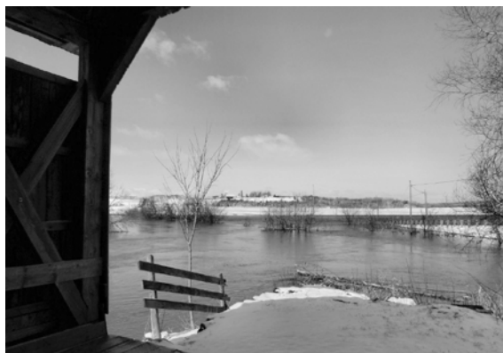
« L'eau est montée au pont Drouin... » Photographie : Gérald Arbour, 2014

Pour information : jmlachance1@videotron.ca