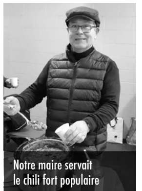
Notre maire servait le chili fort populaire