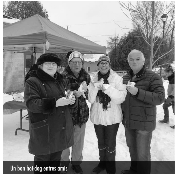
Un bon hot-dog entres amis