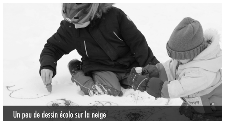
Un peu de dessin écolo sur la neige