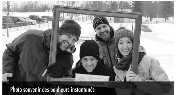
Photo souvenir des bonheurs instantanés

Les Plaisirs d'hiver 2020, ce fut aussi :