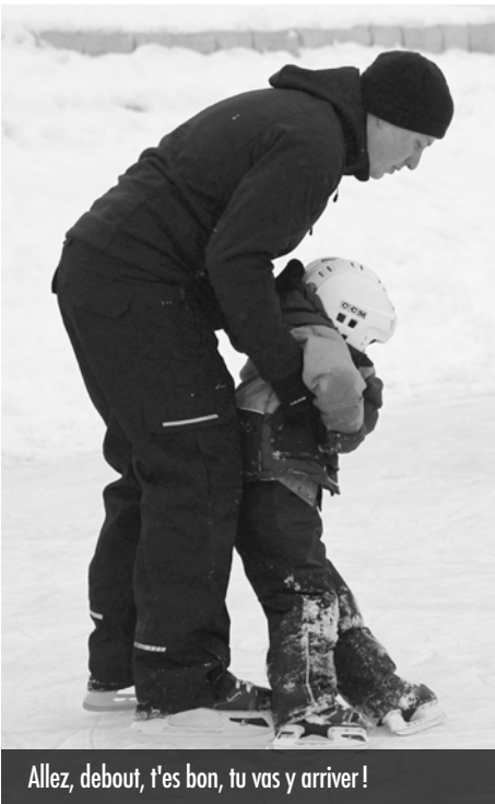
Allez, debout, t'es bon, tu vas y arriver!