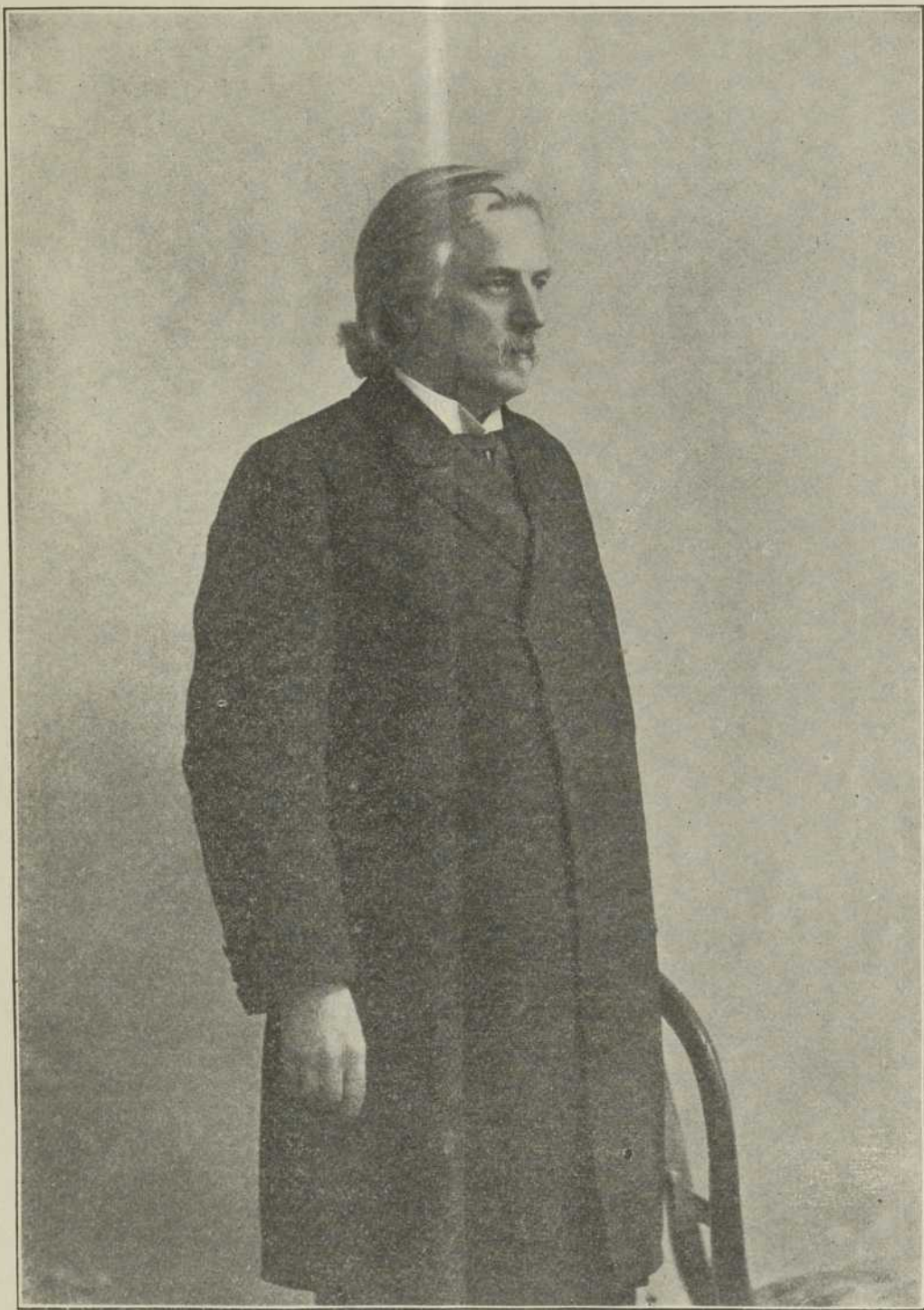
SIR ADOLPHE CHAPLEAU

Ex-Lieutenant-Gouverneur de la Province de Québec