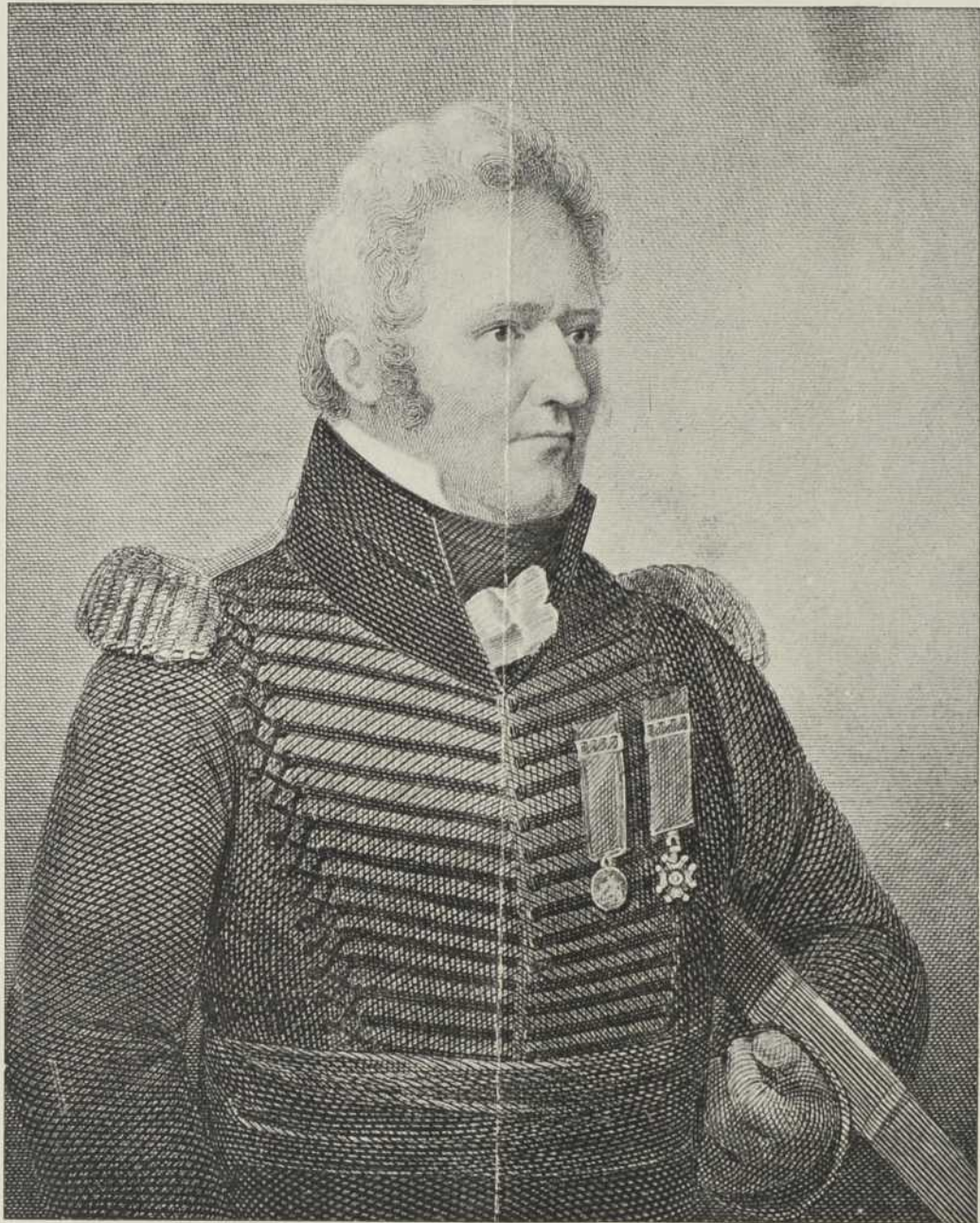
LE COLONEL DE SALABERRY