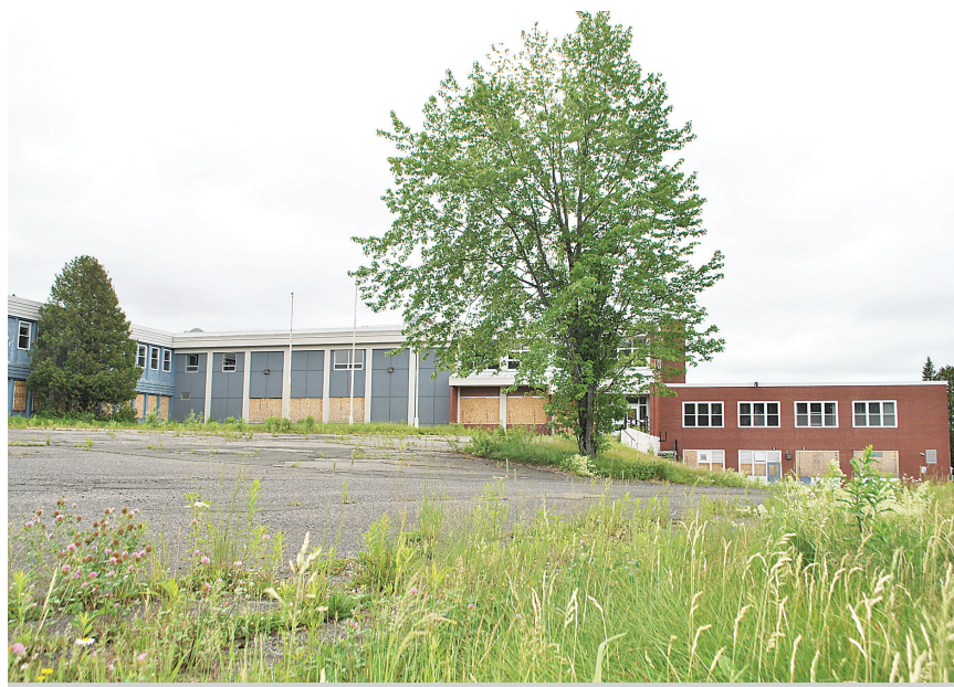
Le bâtiment qui abritait autrefois le CCNB d'Edmundston.

Malgré tout, les interventions ne mènent pas toujours à une démolition. Peter Michaud considère que dans plusieurs cas, un dialogue avec les propriétaires apporte des résultats positifs.