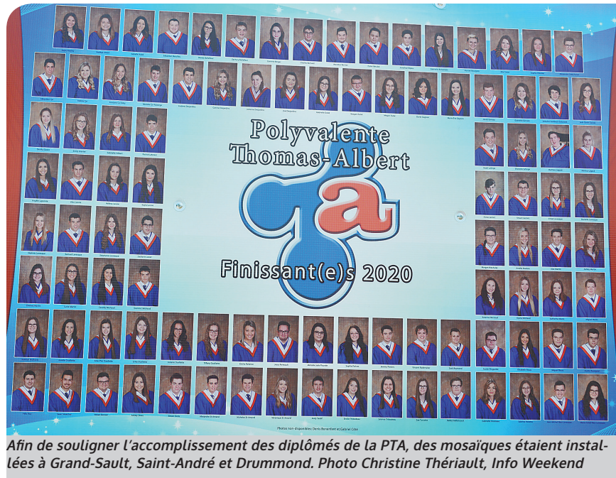
Afin de souligner l'accomplissement des diplômés de la PTA, des mosaïques étaient installées à Grand-Sault, Saint-André et Drummond.