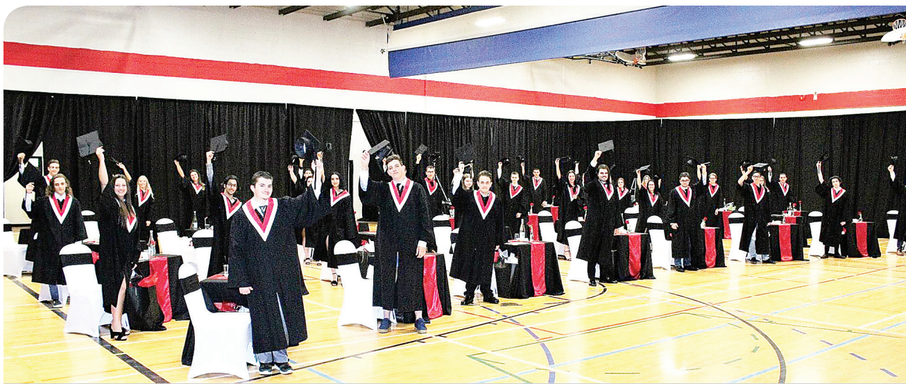
Les finissants de la PAJS étaient heureux de se retrouver pour célébrer la fin de leur parcours scolaire.