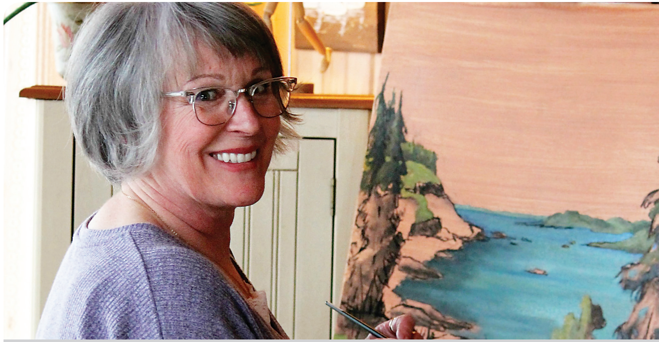
Louise Giroux Photo : contribution

travail des anciens maîtres, surtout ceux utilisant un grand contraste entre l'ombre et la lumière avec une palette de couleur réduite. Interpellée et inspirée par les contrastes, elle utilise la technique du chiaroscuro pour rendre ses créations.