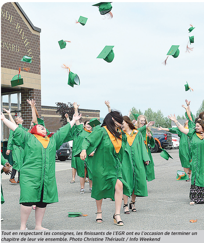
Tout en respectant les consignes, les finissants de l'EGR ont eu l'occasion de terminer un chapitre de leur vie ensemble.