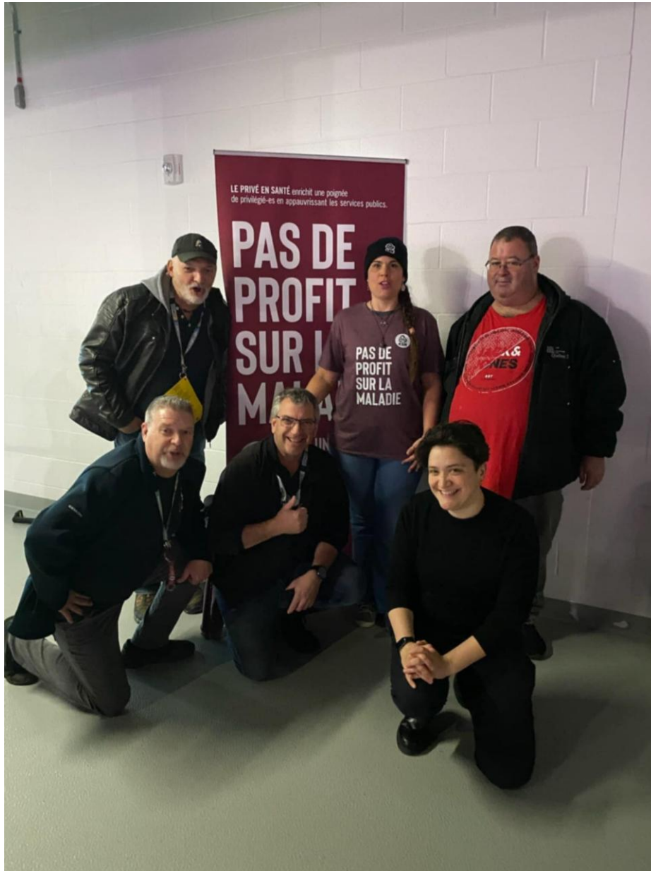
Une partie de l'équipe CSN de l'Ouatuouais, présente à la manifestation " Pas de profit sur la maladie " à Trois-Rivières, le 23 novembre 2024

Même si elle est déjà bien amorcée, je vous souhaite à tous une belle année 2025, avec plein de santé et d'amour!