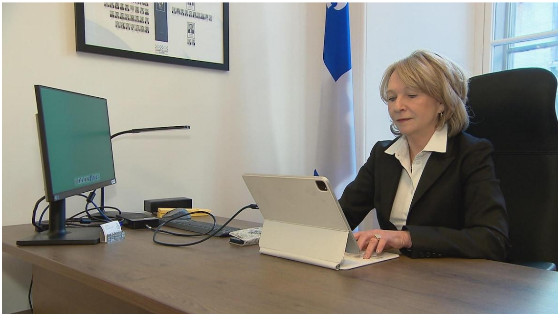
La ministre déléguée à la Santé et aux Aînés, Sonia Bélanger, planche sur un nouveau plan d'action pour soutenir les proches aidants.

Rien ne remplace le contact humain, insiste-t-elle, mais les outils technologiques permettant d'assurer la surveillance à distance d'un proche ne sont pas à négliger, selon elle.