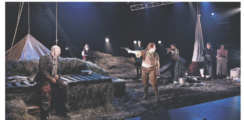
La pièce Avant l'heure mauve, femmes en colère , présentée dernièrement au Périscope

laissent aucune trace, à part des souvenirs impérissables.