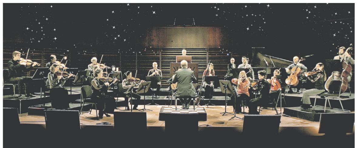
Les Violons du Roy

Chaque dollar investi dans la culture locale est réinvesti dans notre économie pour d'autres biens et services. Au-delà des artistes que vous voyez sur la scène, il y a une multitude de gens qui travaillent dans l'ombre et qui profitent de votre contribution : metteur.e en scène, régisseur.euse, scénographe, éclairagiste, commis à la billetterie, technicien.ne de son, costumier.ère, maquilleur.euse, musicien.ne et bien d'autres artisans dont le travail est méconnu mais essentiel. Il n'y a pas plus local comme achat!