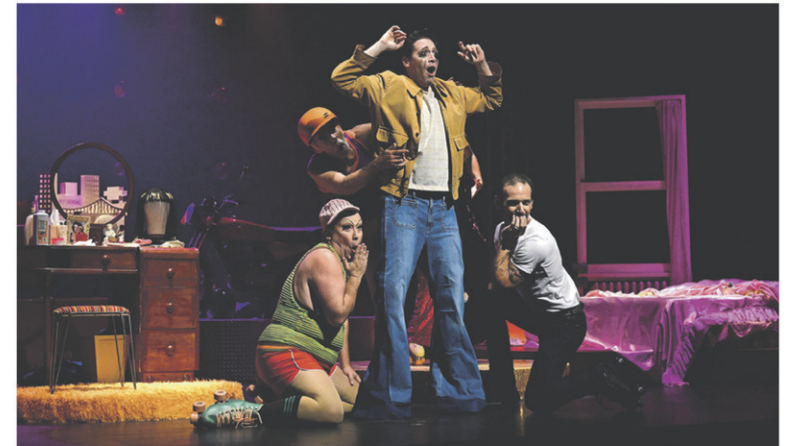
La pièce Hosanna ou la shéhérazade des pauvres , présentée récemment au Triden

Si la protection de l'environnement est une préoccupation pour vous, il est probable que vous ressentiez un certain malaise devant la surconsommation de gadgets et de babioles de toutes sortes associée à la fête de Noël. En offrant des billets de spectacle, un abonnement au musée ou encore un cours de danse, vous contribuez du même coup à réduire votre empreinte écologique. Ce sont des cadeaux immatériels qui, une fois consommés, ne