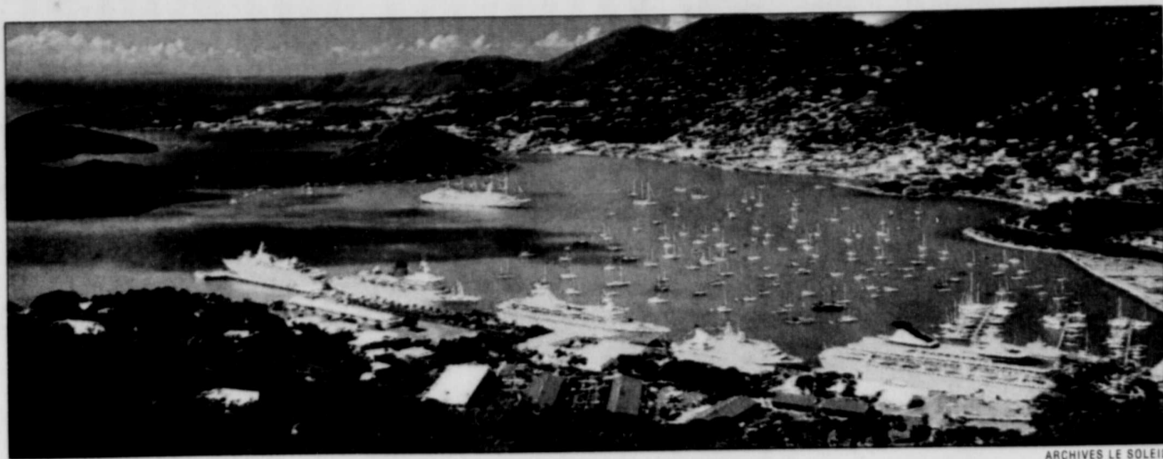
Un décor de rêve pour jouer au capitaine Nemo.

L'« Atlantis » peut emporter 48 passagers pour une plongée de 45 minutes