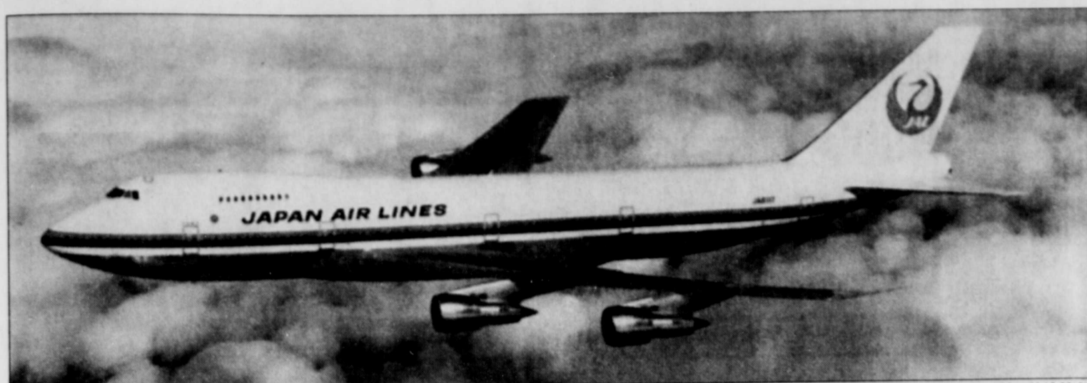
Le nouveau système entrant en vigueur le 1 er février autorise les compagnies à établir les prix comme elles le souhaitent.