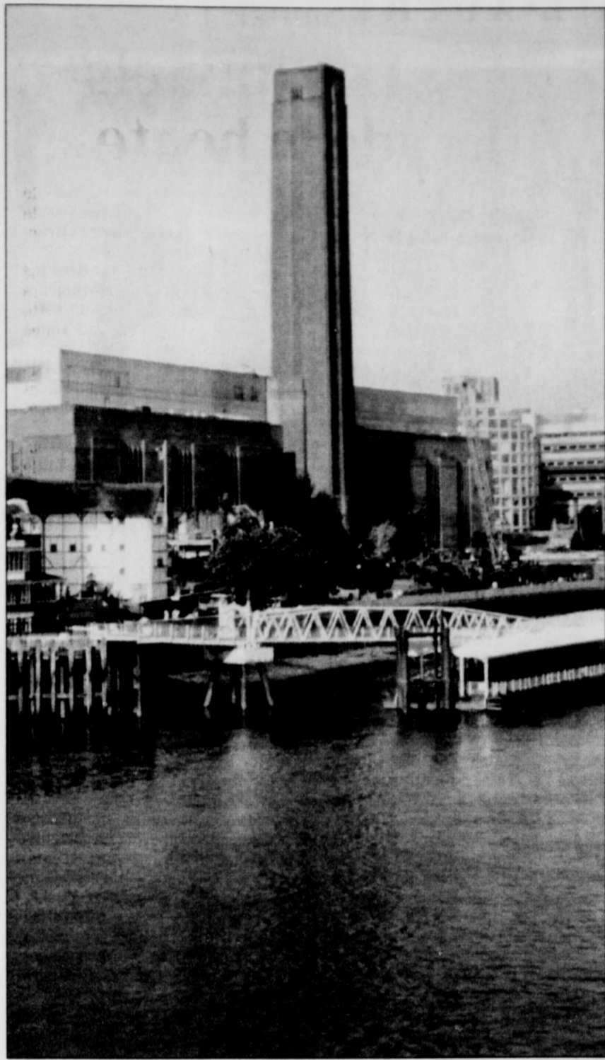
La Tate Modern ouvrira ses portes au public le 12 mai.