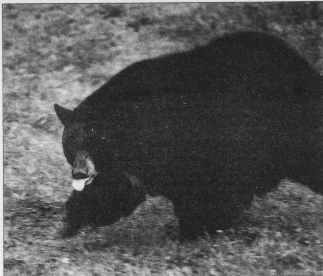
Rien n'est plus désagréable et frustrant que de découvrir qu'un ours noir a envahi votre campement.

Si jamais un ours noir s'approchait trop près de vous et de votre campement, le meilleur moyen de le faire fuir est de faire beaucoup de bruit : frappez sur une poubelle en métal ou sur un chaudron, poussez des cris perçants ou klaxonnez. Si l'ours n'est pas effrayé et ne fuit pas à toute vitesse, éloignez-vous à toute allure !