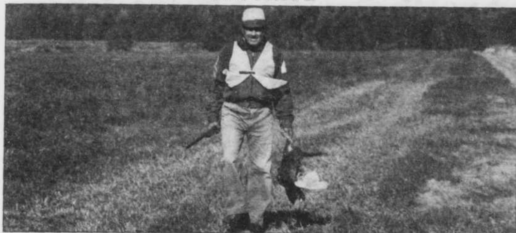
En terrain découvert ou dans un sous-bois, il faut toujours s'assurer d'être bien reconnu.