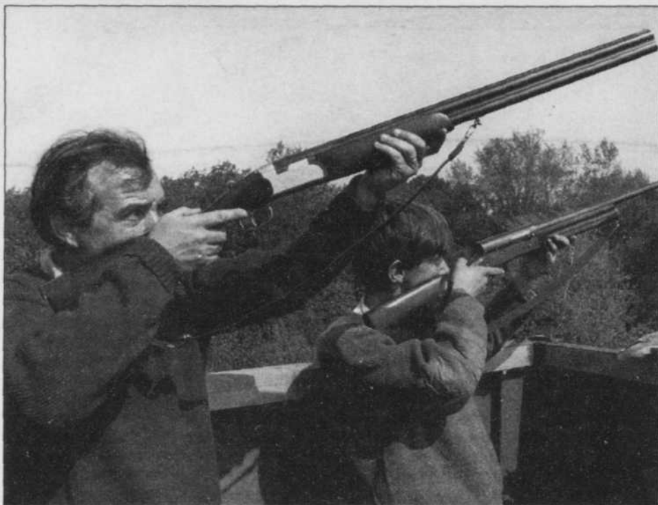
Il est important d'accompagner les jeunes dans des activités d'initiation au maniement des armes à feu pour leur assurer un bon départ.

Le sauvagin doit connaître parfaitement son fusil et les munitions qu'il utilise. C'est un devoir pour lui de pratiquer le tir à la volée avant le début de la saison de