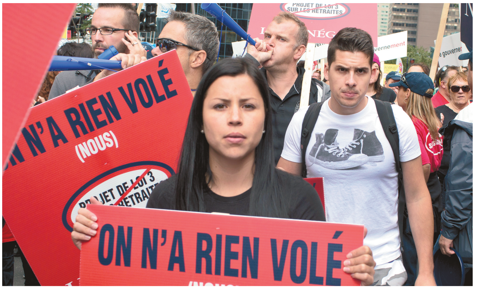
La marche de samedi, à Montréal, a réuni des dizaines de milliers de personnes issues notamment des groupes syndicaux.