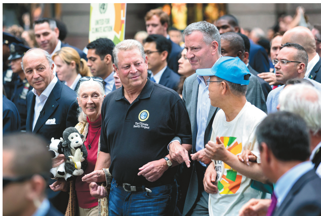
Le ministre français des Affaires étrangères, Laurent Fabius, la primatologue Jane Goodall, l'ancien vice-président américain Al Gore, le maire de New York, Bill de Blasio, et le secrétaire général de l'ONU, Ban Ki-moon, ont marché ensemble dimanche dans les rues de New York.