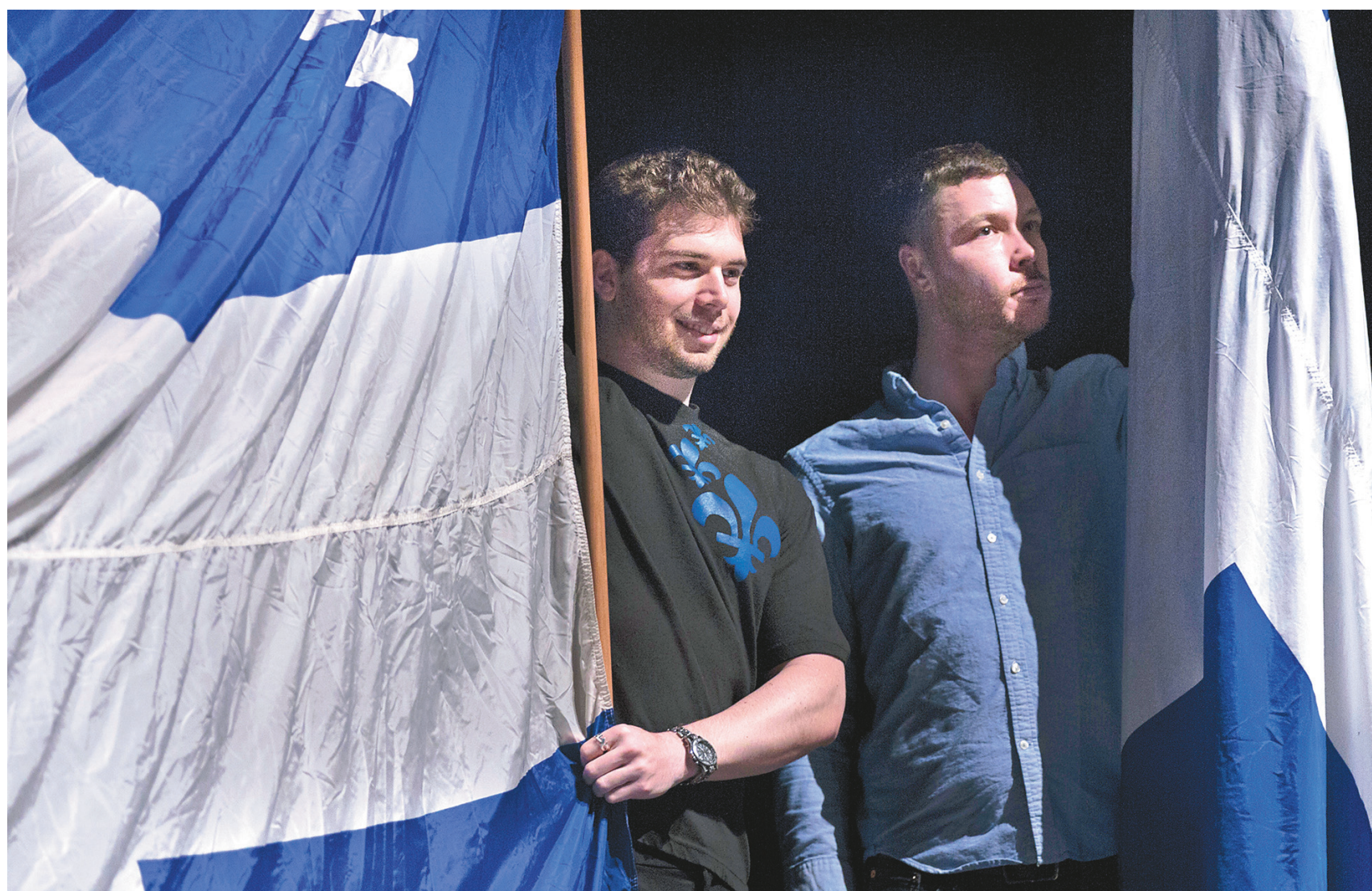
ANNIK MH DE CARUFEL LE DEVOIR

Pour donner un nouveau souffle à la cause souverainiste, le mouvement indépendantiste devra arriver à mobiliser les jeunes et les communautés culturelles.