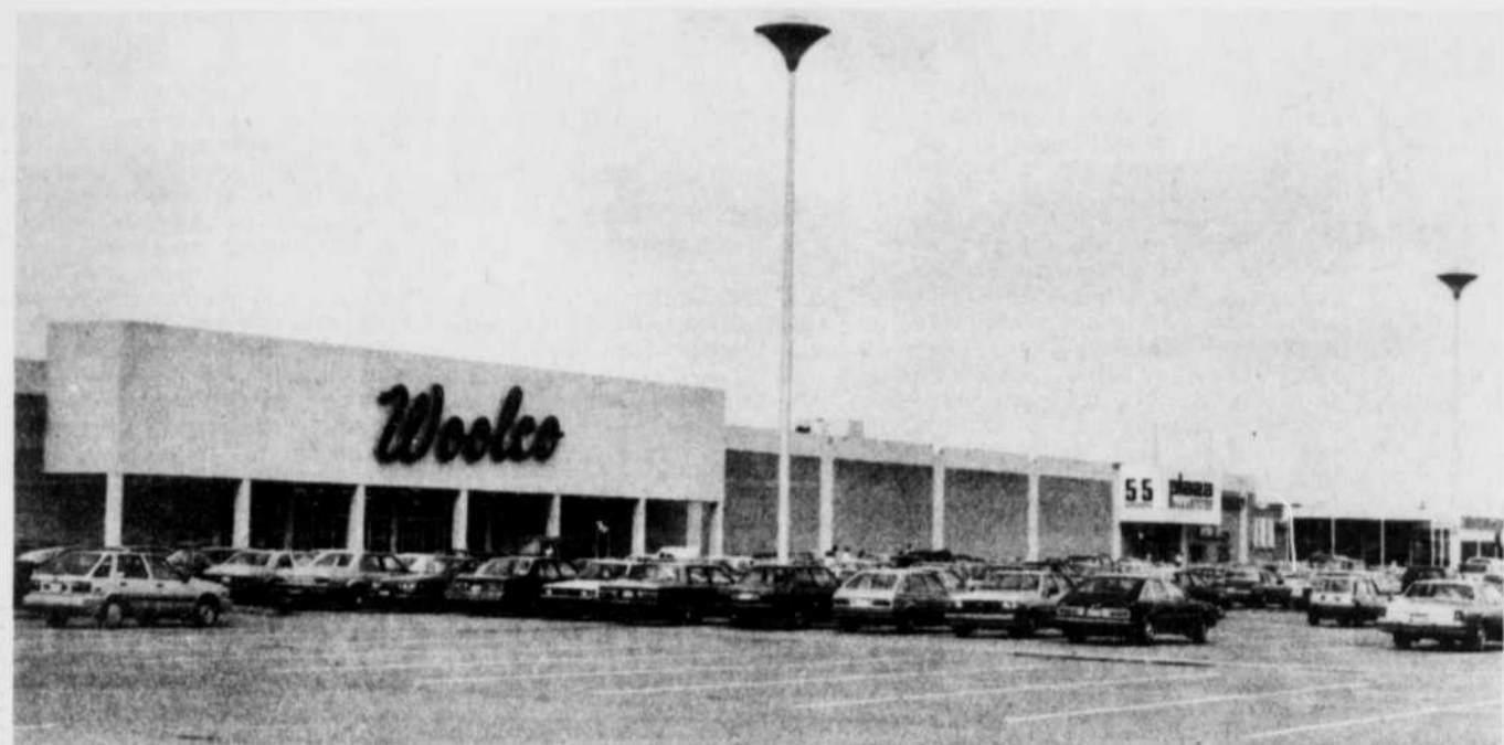
A moins de contretemps tout à fait imprévisibles, le propriétaire du centre commercial Plaza Rock Forest,