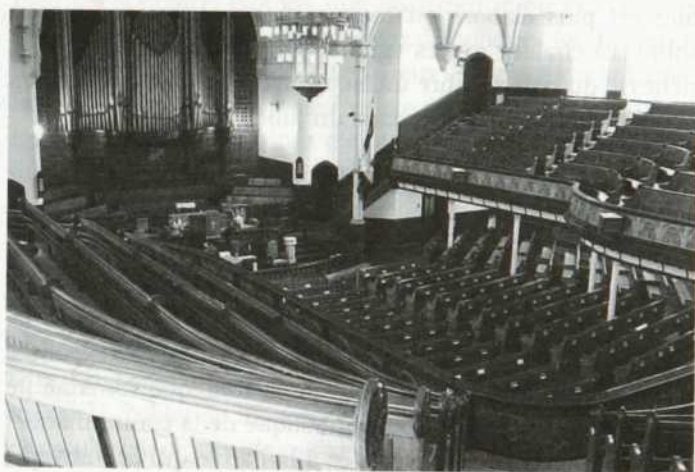
St-James united Church (ancienne église méthodiste). À noter l'effet demi cercle et amphithéâtre.

grants des pays de l'Est et du Moyen-Orient, les communautés orthodoxes ne sont pas en situation précaire.