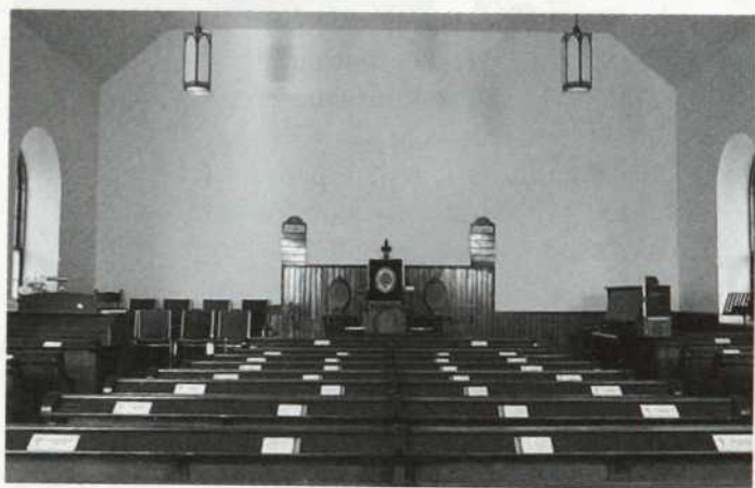
Côte-des-Neiges Presbyterian Church. À noter la très grande simplicité intérieure du sanctuaire.

Plusieurs dénominations protestantes, surtout dans ces deux derniers groupes, anabaptiste et spiritualiste, se réclament du titre d'Églises évangéliques et ont parfois des tendances fondamentalistes.