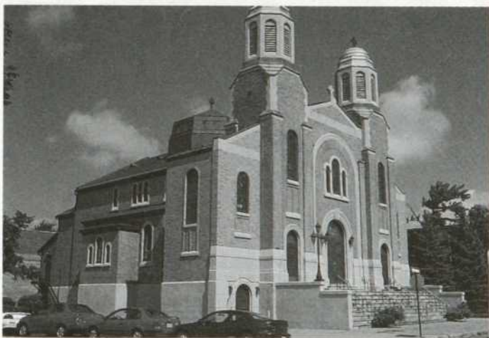
Église orthodoxe St-Georges. Communauté libanaise. À noter la coupole centrale au milieu du bâtiment.

chapelle des Ursulines à Québec sert de premier temple protestant français. Si l'aristocratie anglaise était d'obédience anglicane, un grand nombre des soldats de sa majesté était écossais, donc majoritairement presbytériens et plusieurs marchands britanniques étaient des méthodistes et des baptistes. La conversion des canadiens français au protestantisme passa au second plan derrière les tentatives continues d'équilibre entre les différentes branches au sein du protestantisme. L'Acte de Québec, voté en 1774, concédera des droits au clergé catholique en échange d'une soumission tacite aux supérieurs légitimes.