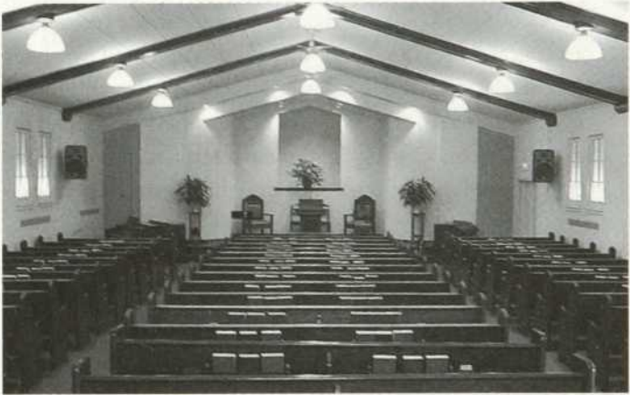
Snowdon Baptist Church. À noter, simplicité moderne, ouverture pour le baptistère pour adulte à l'arrière sur l'estrade, effet « salle de classe ».

nationalisme québécois et adhésion religieuse. Les protestants francophones souffraient, pour leur part, du statut de double minorité : Minorité protestante francophone, dans une majorité protestante anglophone et dans une majorité catholique francophone. Ils devaient se contenter, comme service religieux, d'aller à la « mitaine », déformation des termes de « meeting » pour parler de la réunion et de « meeting house », en allusion à la simplicité des lieux de réunions pour le culte chez les protestants.