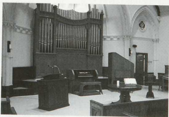
Église unis St-Jean. À noter, pas d'estrade et la table de communion est une table de cuisine ronde en bois sur laquelle trône une Bible.

où le nombre est suffisant, cette église est autonome. Le temps a créé et renforcé des tendances qui font qu'aujourd'hui existent des groupes très traditionnels (High Church) et d'autres plus protestants et évangéliques (Low Church). L'organisation anglicane, quoique épiscopale, ne possède aucune hiérarchie suprême qui coordonne les dénominations des différents pays, le diocèse étant l'unité fondamentale de l'Église. Ainsi, la reine d'Angleterre n'est que le chef spirituel de l'église d'Angleterre et l'archevêque de Canterbury a un pouvoir symbolique sur le regroupement des Églises anglicanes et épiscopaliennes, de par le monde, mais pas d'autorité formelle. Ces Églises se caractérisent par une certaine symbolique religieuse et une liturgie proche du catholicisme.