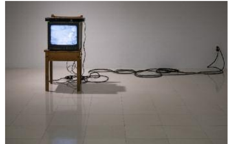
STÉSY MCINNIS-RAIL QUÊTE , 2022 VIDÉO, LECTEUR DVD SUR TÉLÉVISEUR CATHODIQUE