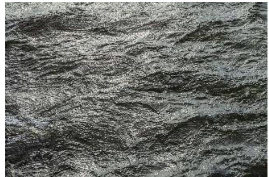
CI-CONTRE SANS TITRE (EAU 23)