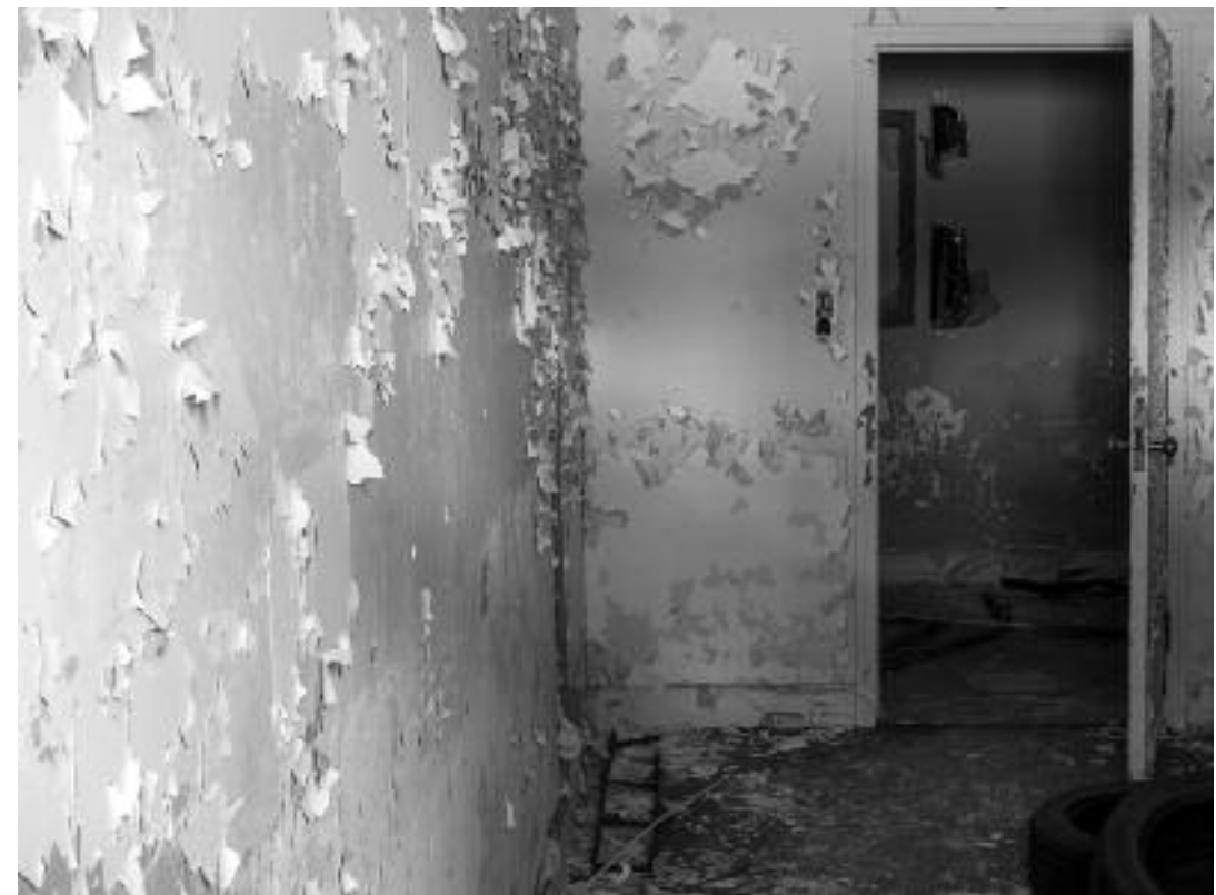
SYLVIE READMAN MUE, 2021 IMPRESSION À JET D'ENCRE SUR MYLAR

La matérialité des images de Readman s'incarne ainsi à travers un travail sur le support qui participe activement à la construction d'une expérience tout en permettant de nouer forme et sens. Dans le cas de Cime , véritable évocation de la nordicité et de la