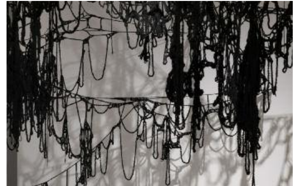
ADÈLE LA FAY SANS TITRE , 2022 LAINE CROCHETÉE