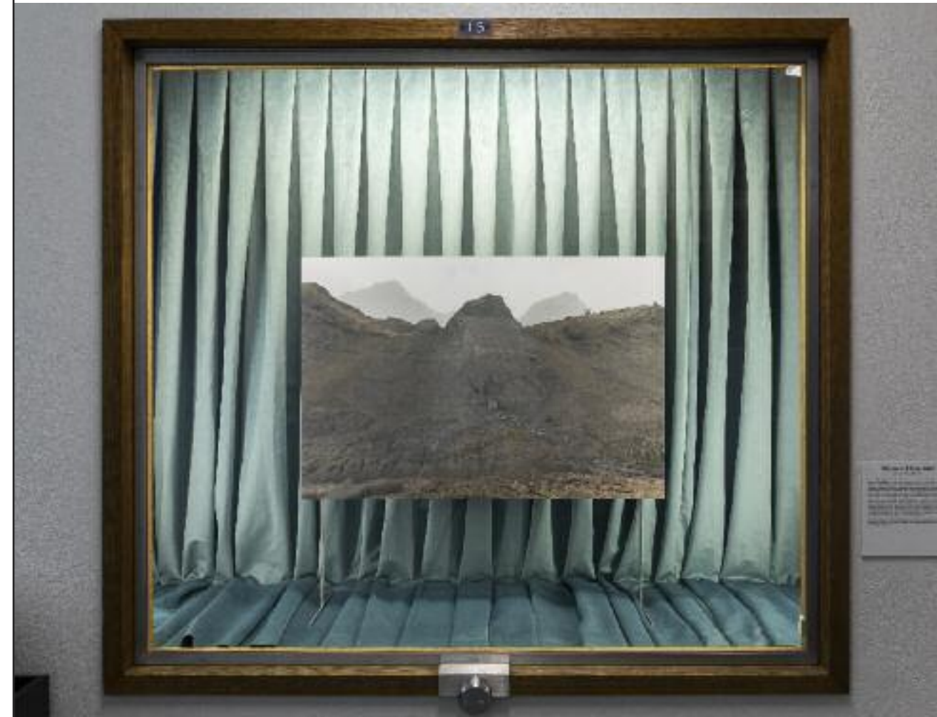
GENEVIÈVE CHEVALIER MIREMENT/L'INSTABILITÉ, (DÉTAIL) MUSÉE DE GÉOLOGIE RENÉ-BUREAU, PAVILLON ADRIEN-POULLIOT