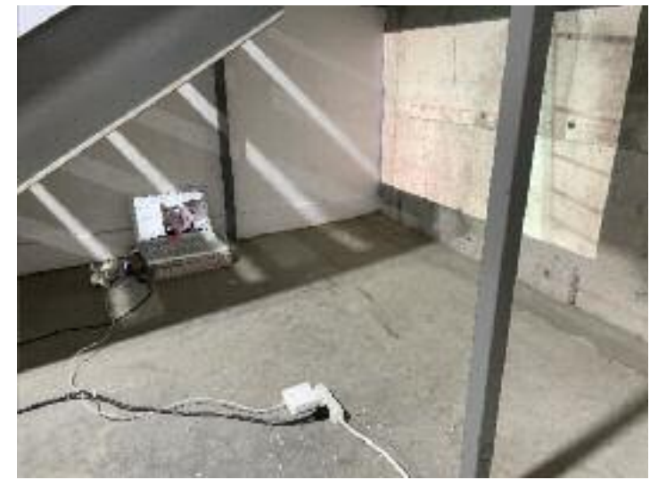
P. 14 ET 15 PHOTOS : ALEXANDRE ST-ONGE