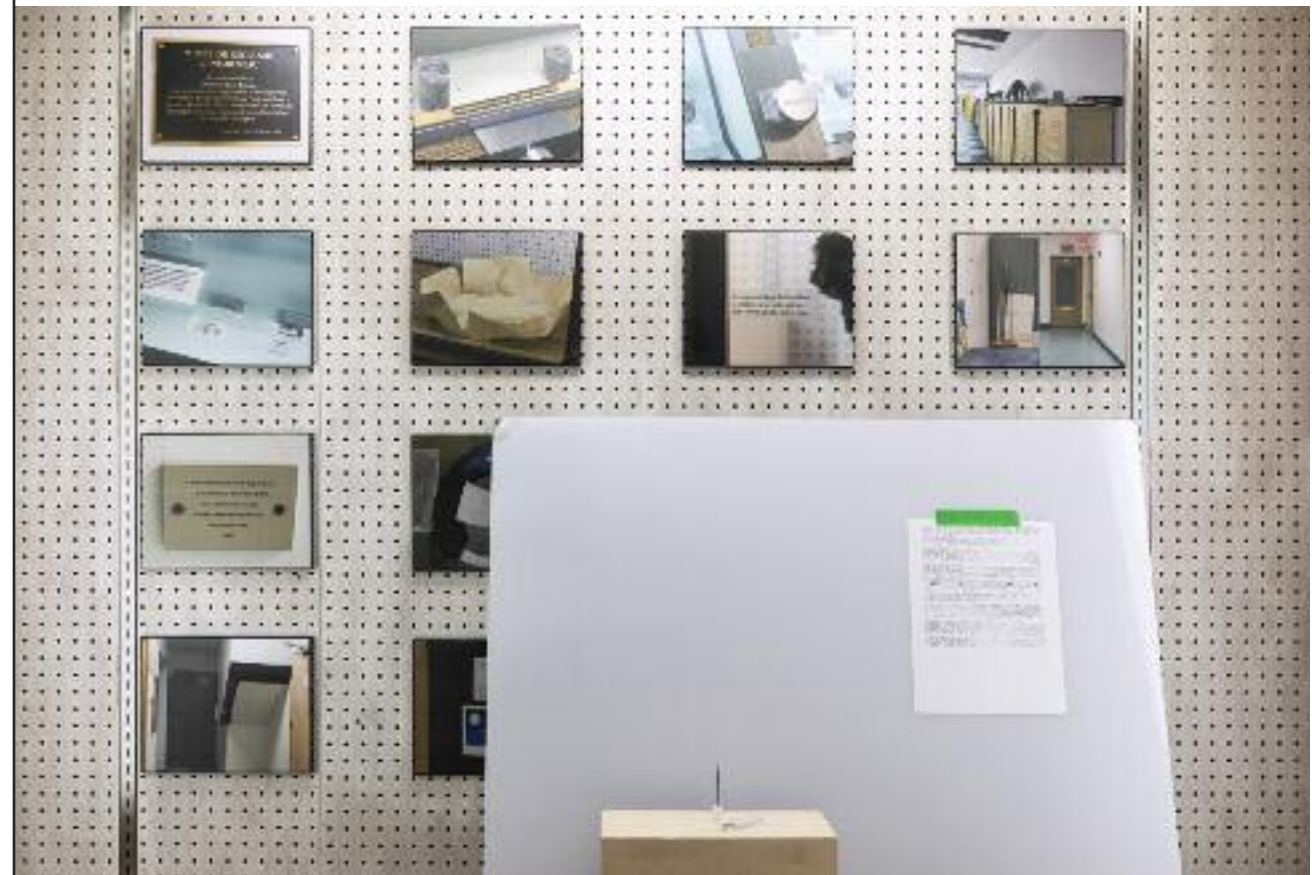
PHILIP GAGNON DE RENÉ-BUREAU À OLIVIER RABEAU, MUSÉE DE GÉOLOGIE RENÉ-BUREAU, PAVILLON ADRIEN-POULIOT

(À noter qu'une œuvre, intitulée En éveil , était également présentée dans les vitrines de la collection d'oiseaux du département de biologie, pavillon Alexandre-Vachon, campus de l'Université Laval. Ce projet fut mené en collaboration avec des professeur-e:s en ornithologie et des techniciennes du département de biologie.)