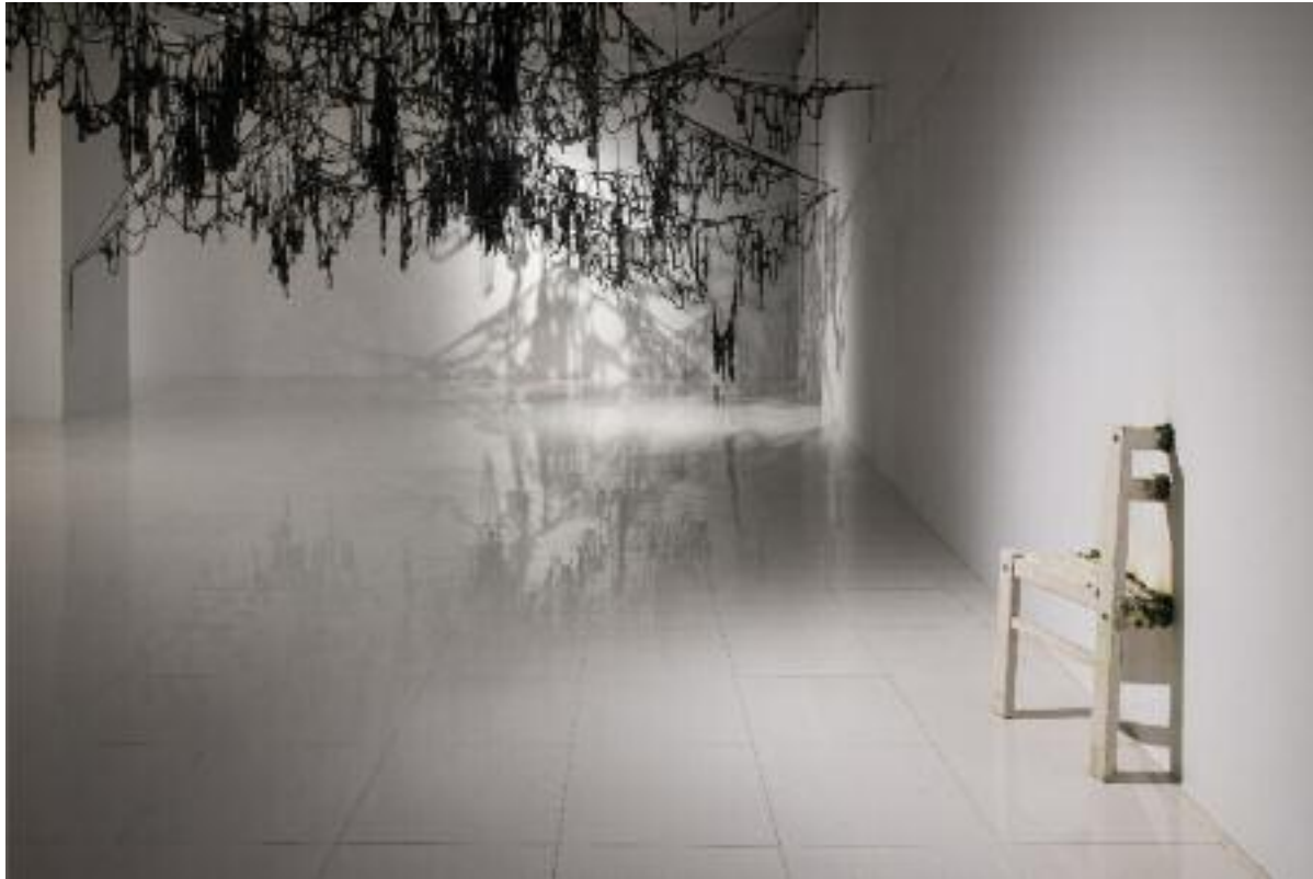
P. 22, 23 SANS TITRE, 2022 LAINE CROCHETÉE

À l'inverse de Rochette, les environnements créés par Adèle sont accueillants et invitent à la communion, à l'expérience tactile et au recueillement. Suspendus au plafond de la galerie, des amas de laine noire se connectent et s'étioilent en plusieurs masses informes qui peuvent rappeler la forme d'un dessin abstrait au crayon de plomb effectué à la va-vite sur une feuille de papier. Ce trait est toutefois spatialisé, s'accrochant aux poutres de la galerie fraîchement rénovée, soulignant par le fait même sa structure. L'œil averti remarquera également une petite chaise blanche avalée par le mur de la galerie et renforçant l'idée que l'architecture de la pièce est muable et vivante.