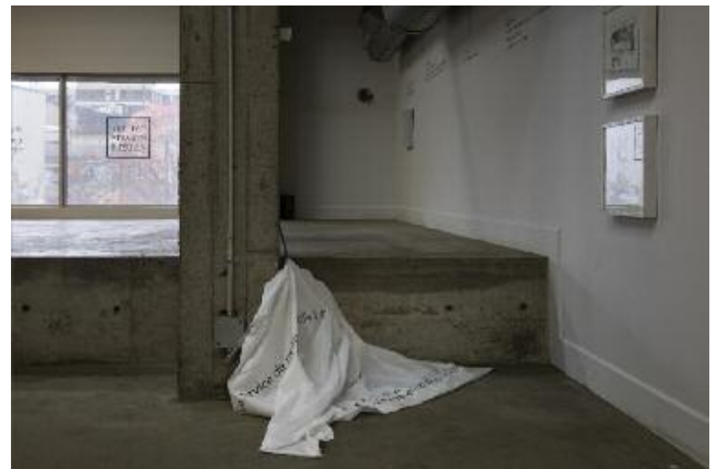
P. 6 ET 7 PHOTOS : MICHEL BOUCHER