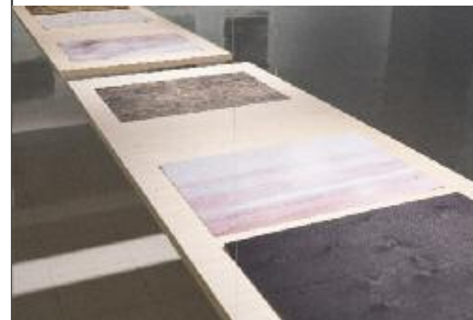
DENIS RIOUX SÉRIE PHÉNOMÉNA, 2023 IMPRESSION JET D'ENCRE SUR TOILE MONTÉE SUR FAUX CADRE EN BOIS

elle propose des œuvres qui renouent avec la longue tradition artistique des vanitas , ces motifs picturaux qui incarnent l'éphémère : papillons, ruines, chandelles, etc. Nocturnes , véritable clef de voûte de cet univers référentiel, reprend le motif canonique du crâne qui agit comme un memento mori , comme un rappel de l'inéluctable.