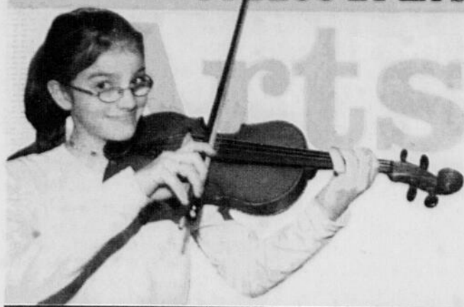
École Sacré-Coeur La musique a de nouveaux bienfaiteurs / Page D3