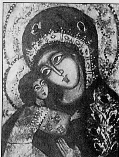
«Vierge et Enfant»