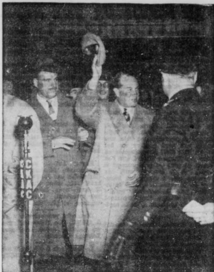
Une foule d'admirateurs s'étaient réunis dans le grand hall de la gare Windsor, à Montréal, pour souhaiter la bienvenue à MAURICE CHEVALIER, le célèbre comédien français des boulevards parisiens, à sa descente du train arrivant de New-York. Après avoir donné des concerts à la salle du Plateau, dans la métropole, il fera une tournée à travers la province.