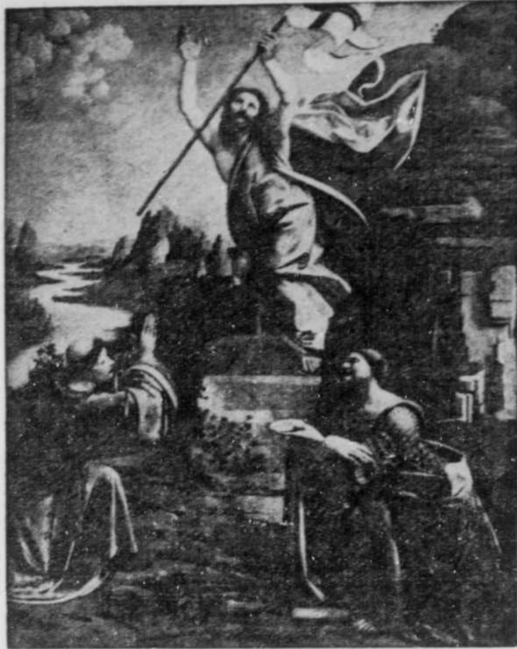
"La Résurrection du Christ" un des chefs-d'oeuvre de Léonard de Vinci.