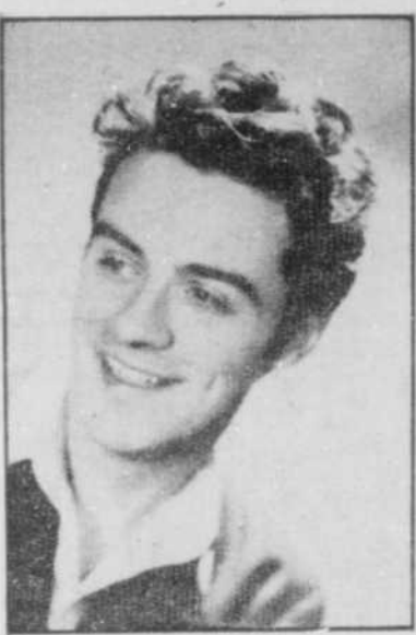
GUY MAUFFETTE réalisateur

Le 26 juin: "Le Brésil, puissance internationale".