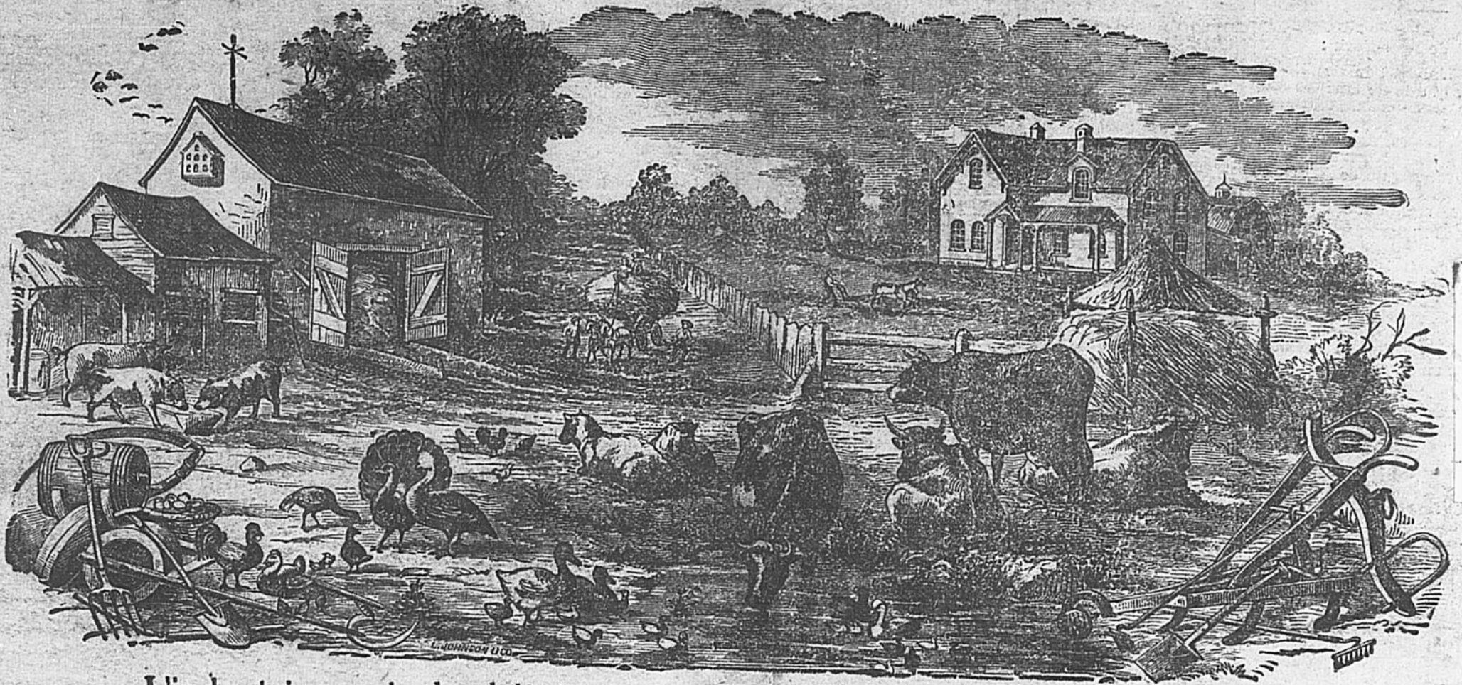
Assemblée législative Jan 1900

L'industrie agricole doit toujours être la base de la richesse des nations