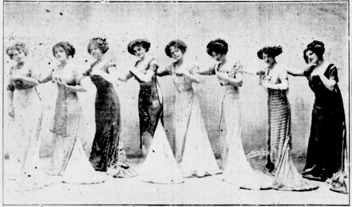
LES FILLES "S" DANS LE "GRAIN DE BEAUTE", AU THEATRE DE SA MAJESTE, SAME DI APRES-MIDI ET SOIR

TOUTE personne se trouvant le seul chef d'une famille, ou tout individu mâle de plus de 18 ans, pourra prendre comme homestead un quart de section — de terre de l'Etat disponible au Manitoba, à la Saskatchewan ou dans l'Alberta.