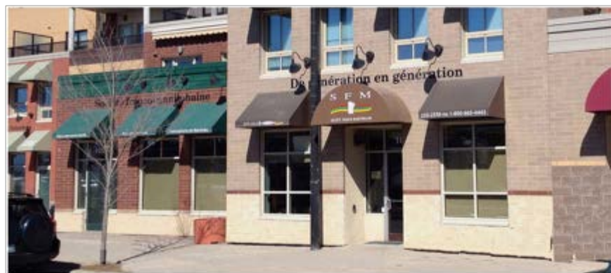
Fig. 2. Le siège social de la Société Franco-manitobaine, rue Provencher à Winnipeg.