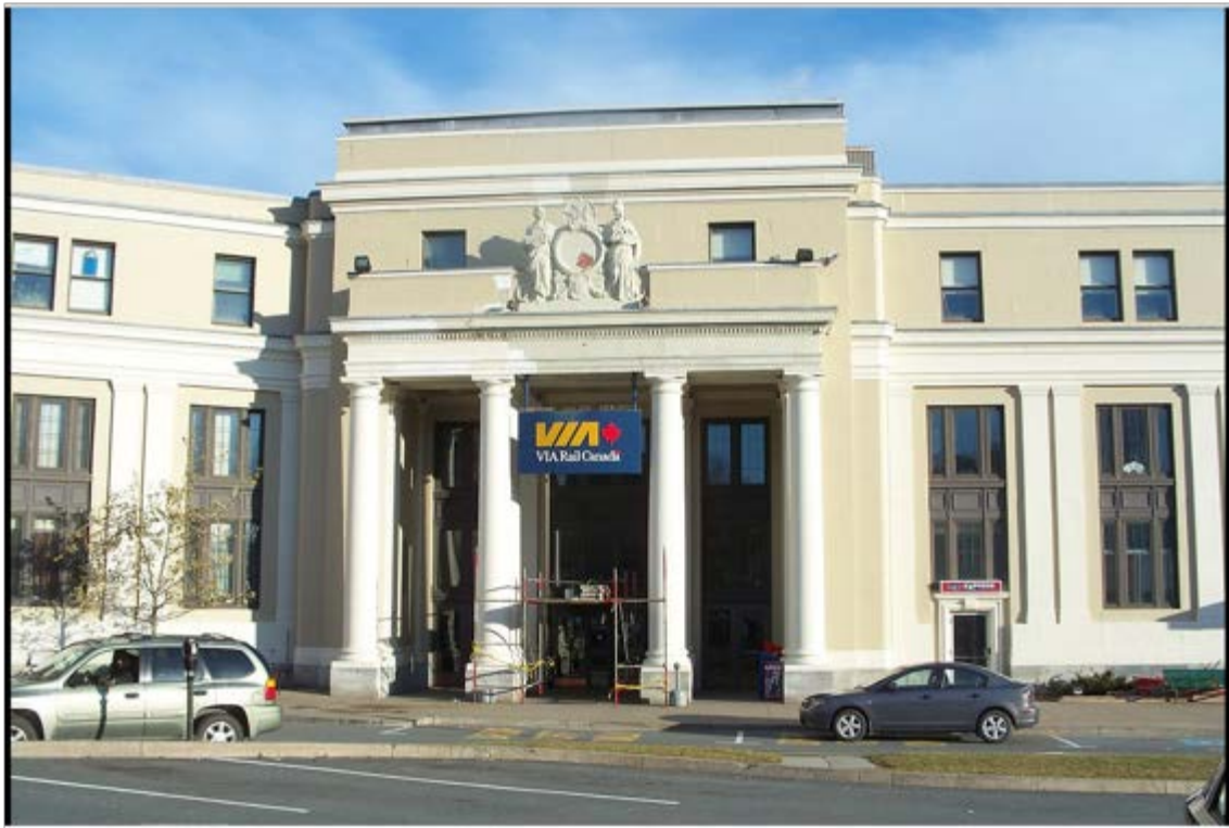
Fig. 3. Terminus de la voie ferrée transpacifique à Halifax en 2008.