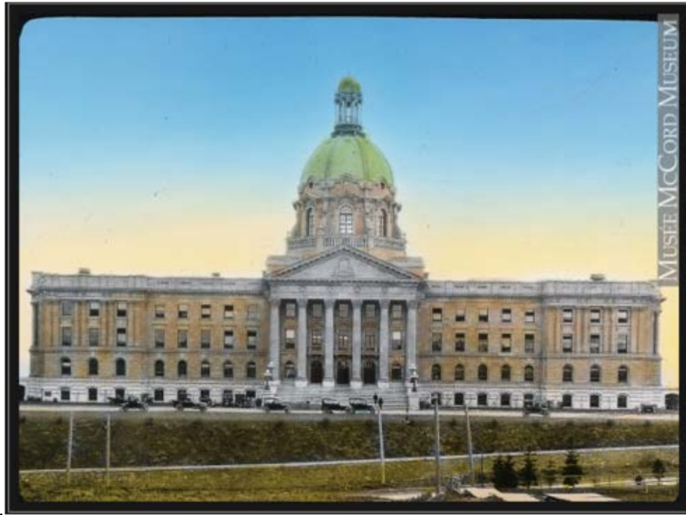
Fig. 1. Le Parlement à Edmonton vers 1923.

Une OBE avec des activités politiques. ***** Alberta français. Pierre Demers Vedette.