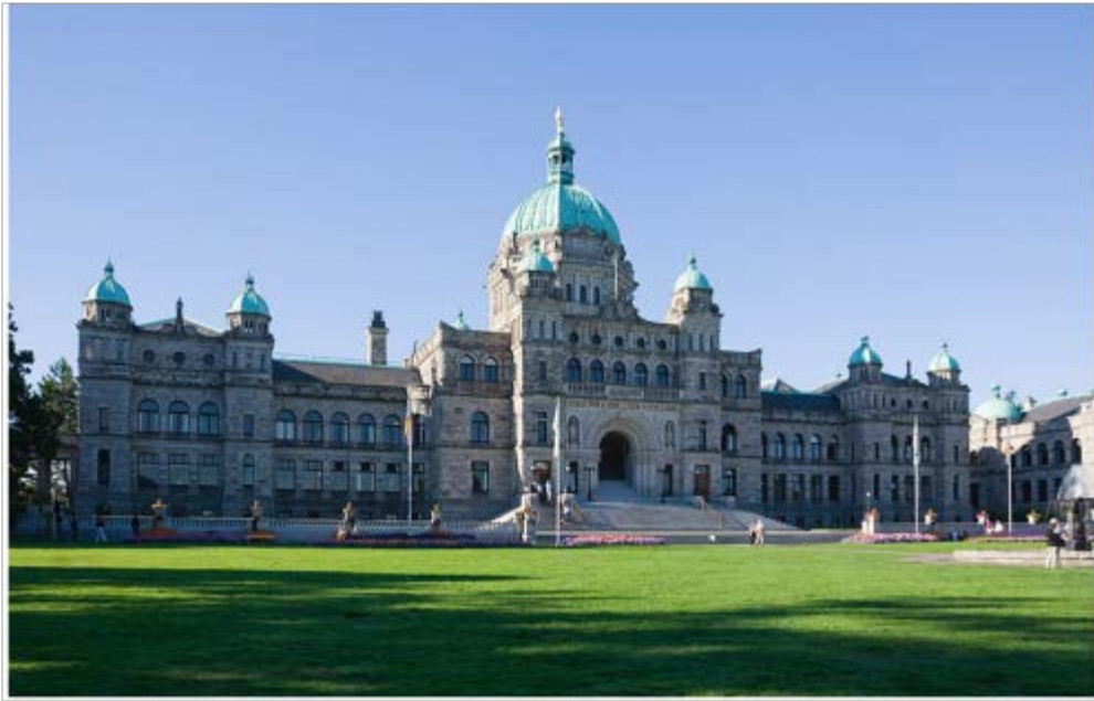
Fig. 1. Le Parlement à Victoria.

Le grand rêve canadien de 1867, il est là! Grâce entre autres au chemin de fer du Pacifique.