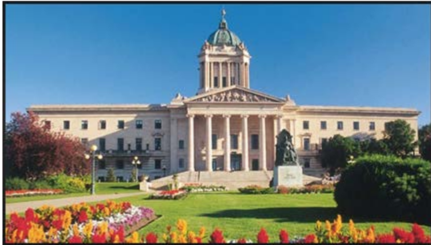
Fig. 1. Le Parlement à Winnipeg. De qui la statue, Victoria ou Élisabeth?