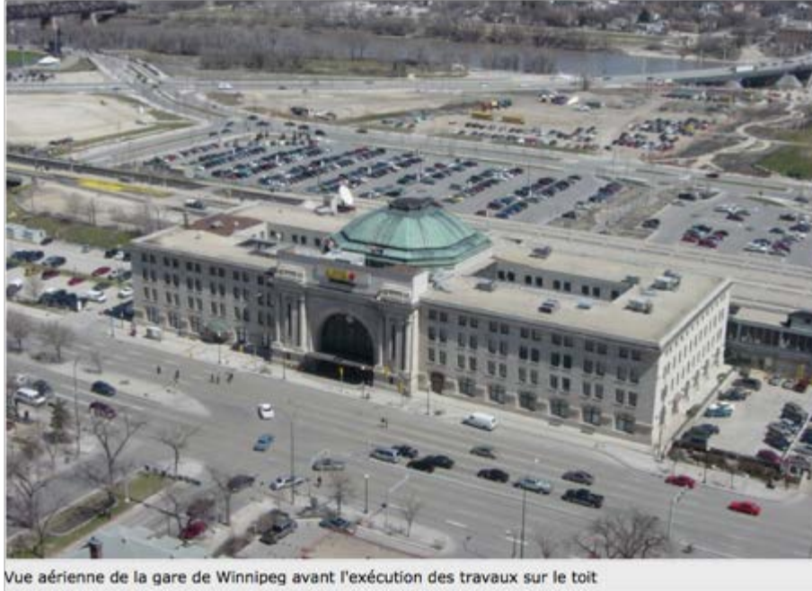
Fig. 3. Gare de Winnipeg.

Je n'ai pas été capable de me documenter aussi pleinement sur les OBE comparables, et il en est, dans les 3 autres provinces de l'Ouest soit Saskatchewan, Alberta et Colombie-Britannique. Dans mon esprit, ces 4 provinces très canadiennes sont marquées par un bâtiment pour leur Assemblée nationale, une gare ferrovaire et une société de français bilingue minoritaire maintenue par Patrimoine canadien.