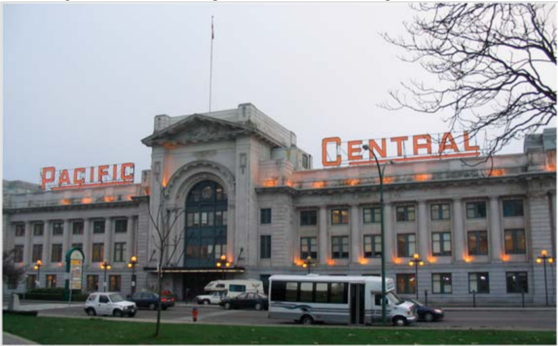
Fig. 2. Terminus de la voie ferrée transpacifique à Vancouver.

Et voici en cherchant les gares terminus de cette précieuse voie ferrée à chaque extrémité.