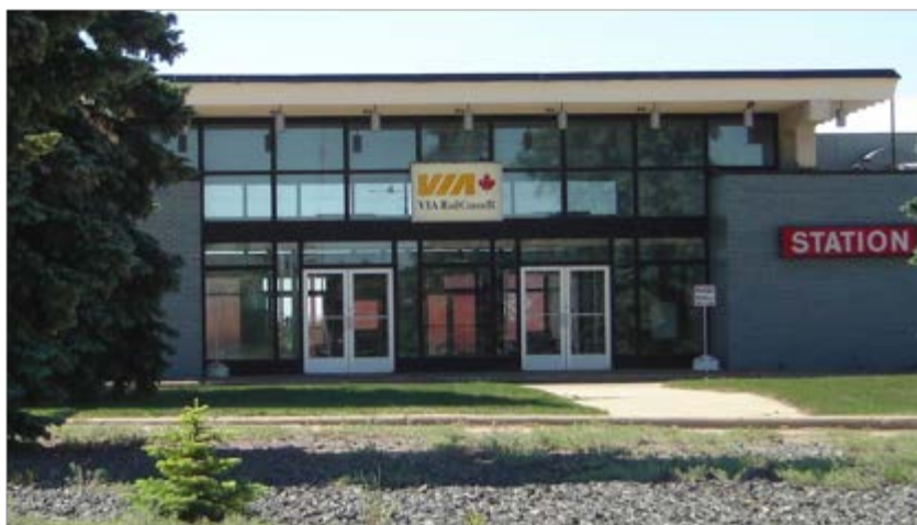
Fig. 3 La gare de Saskatoon en Saskatchewan. Trois trains par semaine dans chaque sens.