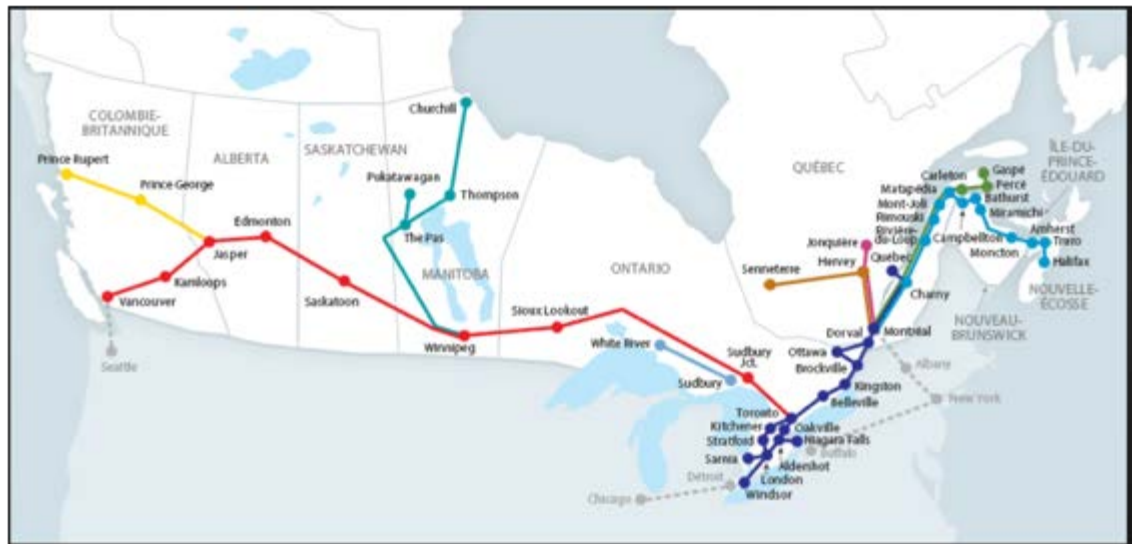
Fig.4, Via Rail Halifax à Vancouver,