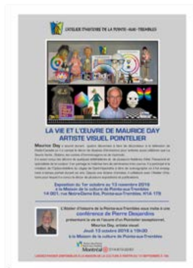
Fig. 1. iday.