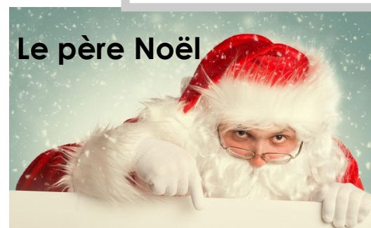
Le père Noël

D'après la légende, une jeune fille pauvre aurait voulu offrir un cadeau à la Vierge Marie la veille de Noël. N'ayant rien à offrir, elle alla cueillir de simples feuilles mais ces dernières se transformèrent en magnifiques fleurs écarlates. On raconte que c'est depuis ce jour que les poinsettias offrent leurs plus belles couleurs durant la période de Noël.