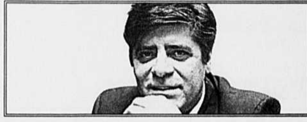
GILLES C. MARCOTTE

La nomination de Billy Smith couronne une année marquée d'honneurs pour l'ancien magnifique gardien des Islanders qui a vu son numéro être retiré en plus d'être intronisé au Temple de la renommée d'Ottawa.