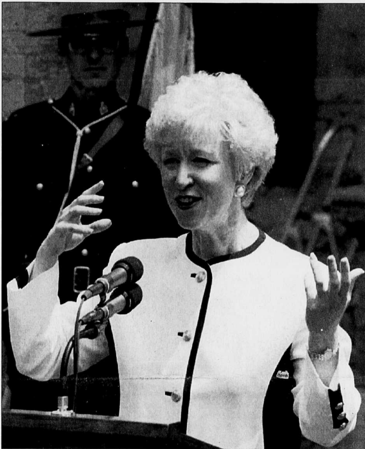
Kim Campbell a été assermentée hier pour prendre la succession de Brian Mulroney au poste de premier ministre. C'est la première fois que les Canadiens ont une première ministre. On voit ici Mme Campbell dans un exercice imposé: la conférence de presse.