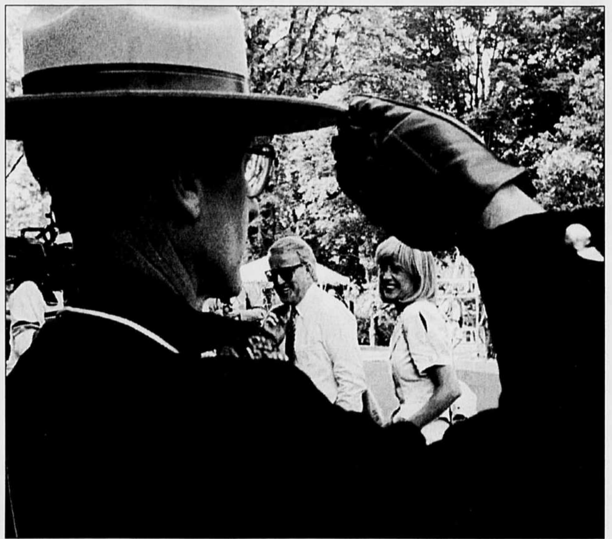
Dernier salut d'un policier de garde devant Rideau Hall hier: le premier ministre et son épouse se rendaient à la cérémonie d'assermentement qui allait introduire Kim Campbell 19e premier ministre du pays.

Le matin, j'étais sur le quai à m'asperger d'eau froide lorsque le soleil me surprit. C'était un 10 juin, et ce soleil de juin était une flèche qui transperce et qui embrase, et voilà que la forêt prit feu, avec le lac et tout ce qui vivait autour. Dans la lumière de l'incendie, il n'était plus possible de ne pas voir. Je vis des papillons à queue jaune et des oiseaux supersoniques, des lucioles accouplées et des libellules hélicoptères, je vis les bourgeons neufs des épinettes étincelants comme des bagues et tellement de couleurs et de bruissements, partout, une débauche de vies triomphantes. Dans le soleil de l'incendie, il n'était plus possible d'ignorer plus longtemps que cet endroit broussailleux, encombré, primaire, était en réalité un paradis, un jardin sacré dont on m'avait miséricordieusement confié la clé. A cause du soleil, je m'étendis sur le quai, en ce 10 juin d'il y a dix ans, et je vis tout ce qu'il y avait à voir, je vis le sentier qu'emprunte chaque matin l'original pour aller boire, les chanterelles et les cèpes champignonnant dans la mousse, je vis la chaloupe rouge qu'on ravaudrait chaque printemps comme une part de nous qui fuit et qui persiste, je vis toutes les fissures par où se faufile pour comprendre le monde, je vis cette vieille dame que je serais un jour, sautillant sur les rochers moussus d'un pas guilleret, environnée de mouches noires qui ne la touchent pas.