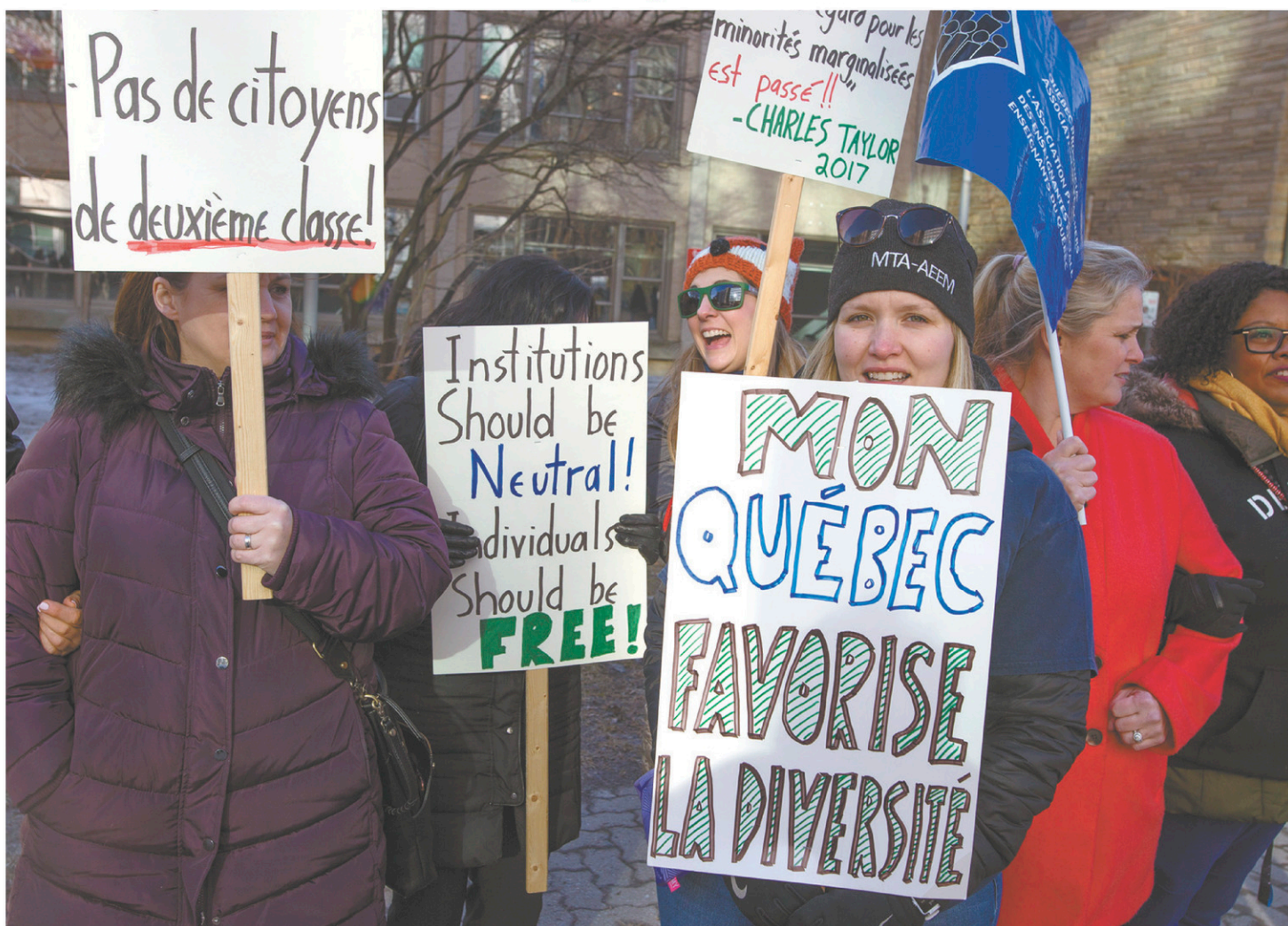
Des enseignants et des membres de la communauté ont formé une chaîne humaine à l'extérieur d'une école secondaire de Westmount, mercredi matin, pour protester contre le projet de loi sur la laïcité du gouvernement Legault. Plusieurs des manifestants — ils étaient environ 150 — portaient fièrement la kippa ou le hidjab en solidarité avec ceux et celles qui pourraient être exclus d'un futur emploi dans la fonction publique. Le projet de loi 21 du gouvernement de la Coalition avenir Québec prévoit d'interdire le port de signes religieux par des employés de l'État en position d'autorité, afin de garantir la laïcité de l'État québécois.