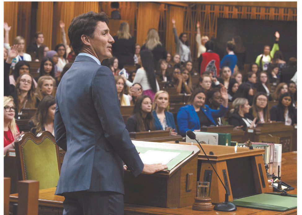
Le premier ministre a livré un discours devant les « héritières du suffrage », dont certaines lui ont tourné le dos.

Le premier ministre ne s'est pas offusqué de cette protestation. « Il y a un éventail de points de vue dans notre pays et nous devons nous assurer que ces voix sont entendues ou qu'elles peuvent choisir de ne pas prendre la parole ou de ne pas écouter [la parole des autres]. »