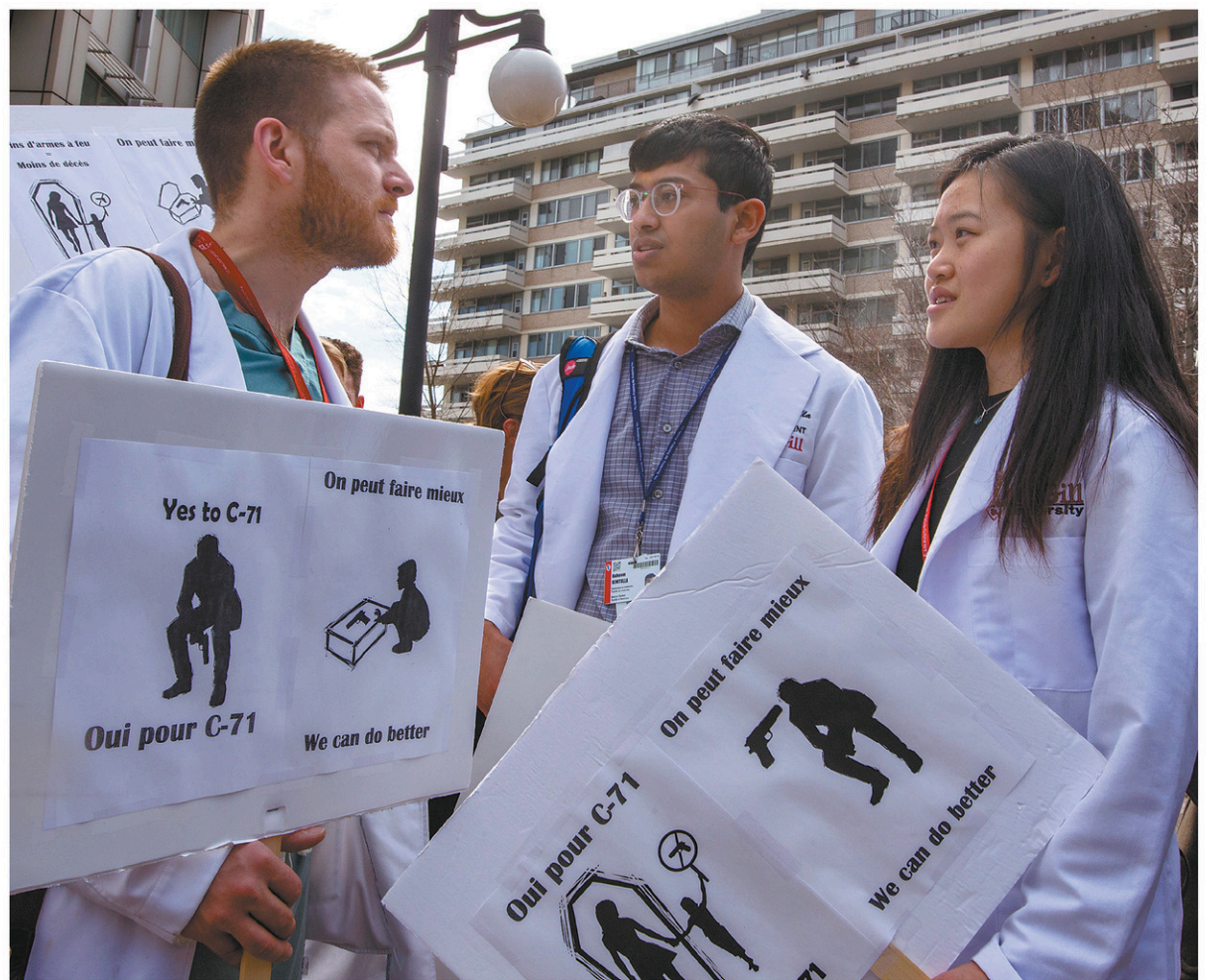
Le personnel de centres hospitaliers, à Montréal comme dans d'autres villes au Canada, a manifesté mercredi pour le bannissement de certains types d'armes à feu et un meilleur contrôle des autres. Médecins et infirmières sont à même de constater tout le mal que peuvent causer ces armes.

En vertu du principe de précaution, la France a introduit dans sa politique nutritionnelle de santé publique 2018-2022 l'objectif de réduire de 20 % la consommation d'aliments ultratransformés entre 2018 et 2021, soulignent les auteurs de l'article. « Ici, Santé Canada considère que nous ne disposons pas d'assez de données probantes pour [condamner] les aliments ultratransformés sans nous attirer des poursuites judiciaires par l'industrie agroalimentaire », explique M. Moubarrac avant d'ajouter que, pour le moment, le nouveau Guide alimentaire canadien se limite à recommander aux citoyens « de cuisiner » au lieu d'acheter des aliments déjà préparés.