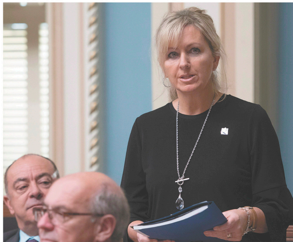
La ministre Andrée Laforest a présenté mercredi un projet de loi qui donne plus de marge de manœuvre au Tribunal administratif du logement, la nouvelle appellation de la Régie du logement du Québec.

Le RCLALQ se réjouit par ailleurs de l'ajout prévu de ressources en région et