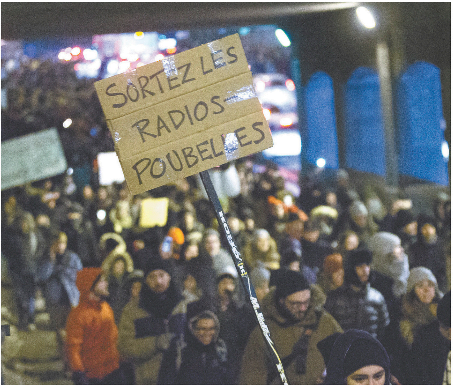
Certaines radios de la capitale ont été mises en cause dans la tuerie à la grande mosquée de Québec en raison des opinions de leurs animateurs contre l'immigration arabe.

Si certaines personnes ont accepté de témoigner à visage découvert, plu-