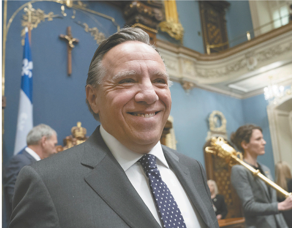
Le premier ministre François Legault

Pour ce faire, le gouvernement Legault utilise le cadre fédératif lui-même, le texte même des chartes, qui permettent justement de telles déroga-