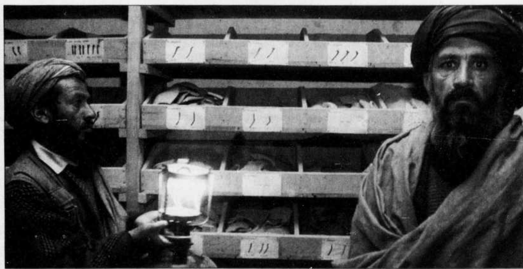
Un employé du musée national de Kaboul a montré hier aux journalistes ce qu'il reste de l'institution.

Le musée national de Kaboul est ouvert aux journalistes