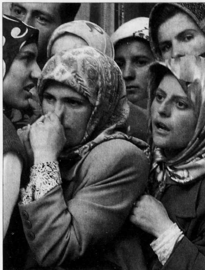
Une foule de Macédoniens, dont la plupart sont d'origine albanaise, s'est massée devant des bureaux gouvernementaux, hier à Skopje, pour obtenir un passeport afin de pouvoir quitter le pays.

Reste qu'aucun signe de retraite massive des rebelles n'était perceptible. Les fortifications et les bar-