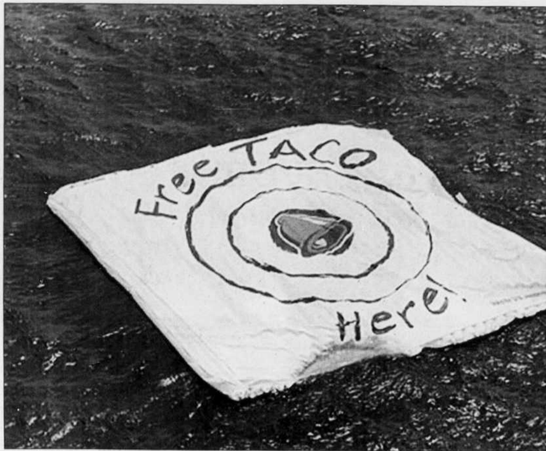
Mir était fébrilement attendue hier dans le Pacifique Sud. La chaîne de restaurants américaine Taco Bell allait offrir un taco gratuit à tous ses clients si les débris de la station Mir frappaient la cible flottante qu'elle avait placée sur l'océan, au large de l'Australie...

La station Mir a accompli plus de 86 000 révolutions autour de la Terre depuis son lancement en 1986. Les Russes se sont déjà débarrassés d'engins spatiaux dans cette zone entre l'Australie et le Chili.