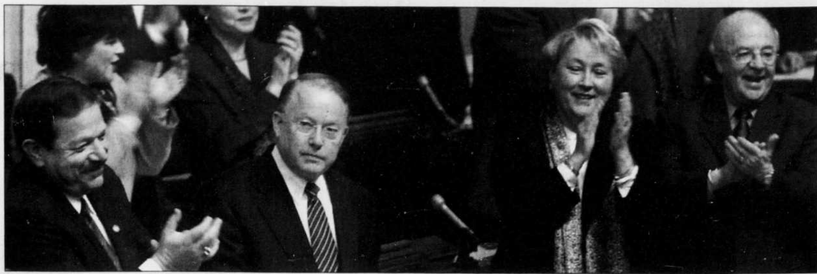
Le premier ministre Bernard Landry est applaudi par ses collègues, dont Jacques Brassard, Pauline Marois et Guy Chevrette.

Il sera nécessaire d'accélérer la cadence, dans ces régions-ressources, pour leur permettre de prendre pleinement leur place dans la nouvelle économie et pour maintenir la position concurrentielle du Québec sur les marchés mondiaux. Cette stratégie comprendra également des mesures qui auront un impact im-