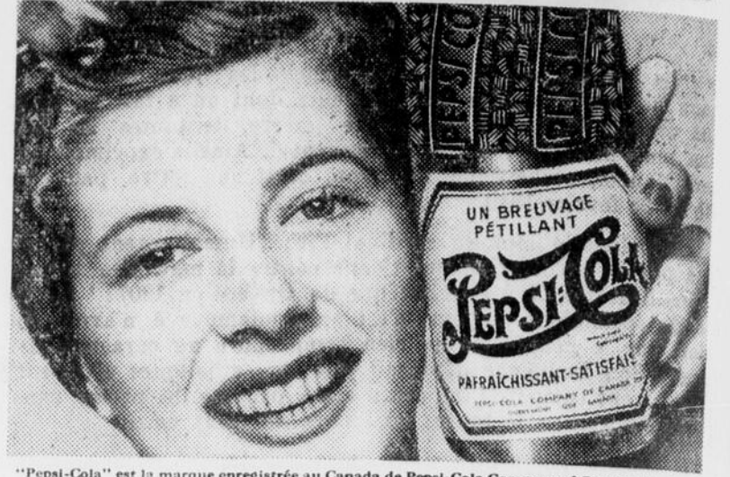
"Pepsi-Cola" est la marque enregistrée au Canada de Pepsi-Cola Company of Canada, Limited