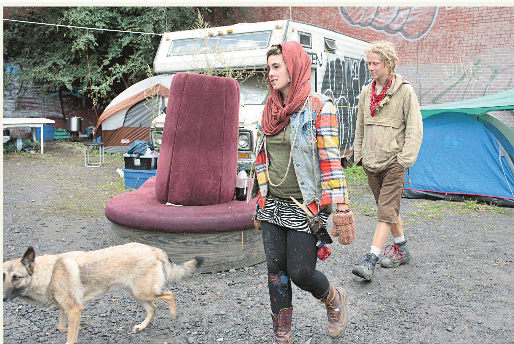
Des résidents du 2019, rue Moreau et des sympathisants occupaient mardi le terrain adjacent à l'immeuble. Tous les résidents des 38 lofts de cette ancienne usine de sous-vêtements d'Hochelega-Maisonnette ont été avisés par la Ville de Montréal qu'ils ne pouvaient plus occuper cet immeuble, jugé non sécuritaire à des fins résidentielles. Depuis au moins 20 ans, les lofts Moreau sont occupés par une communauté d'artistes. Le prix de ces lofts, très mal entretenus jusqu'à maintenant par leur propriétaire, Vito Papasodaro, tournait autour de 1000 dollars par mois.