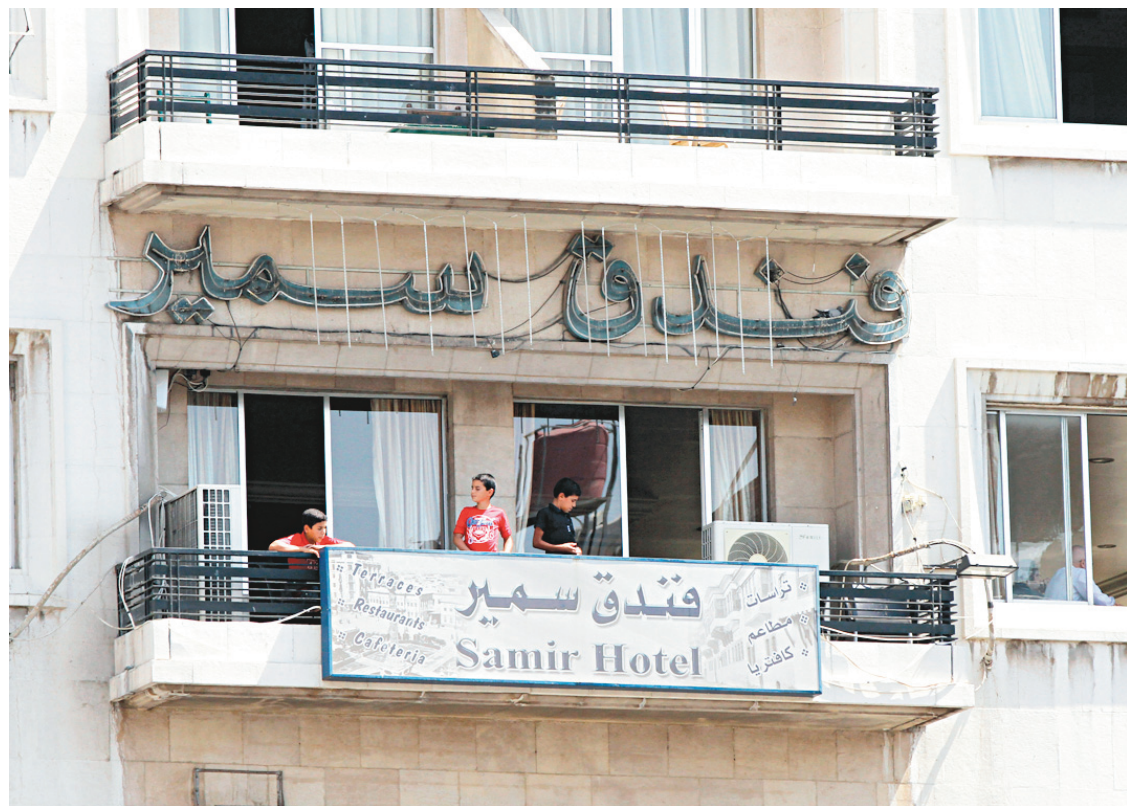
Des enfants s'amusaient mardi sur le balcon de la chambre d'hôtel qu'ils habitent à Damas.